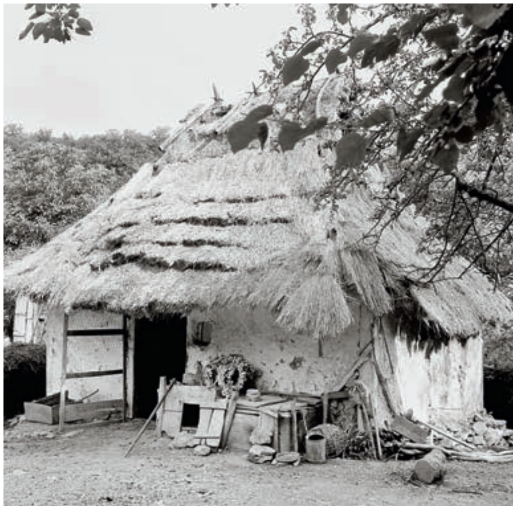
Varbóc, Kossuth Lajos utca 2. sz. alatti gazdasági épület, 1954