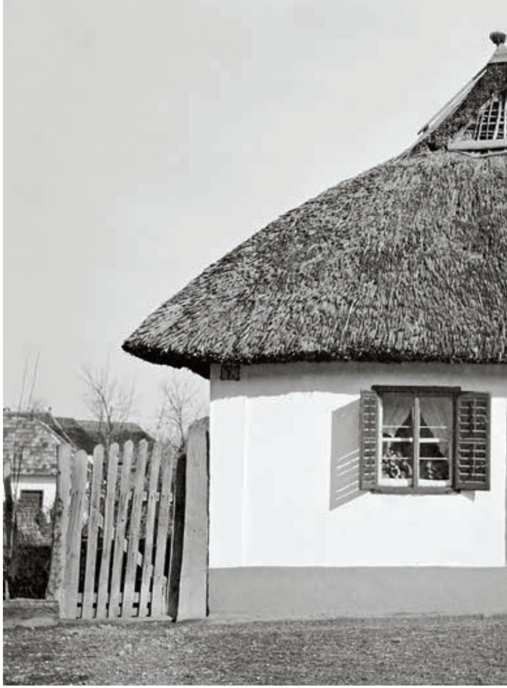
Lakóház, Mezőkövesd, 1937