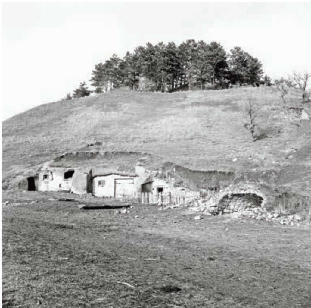
Ólak. Cserépváralja, 1955