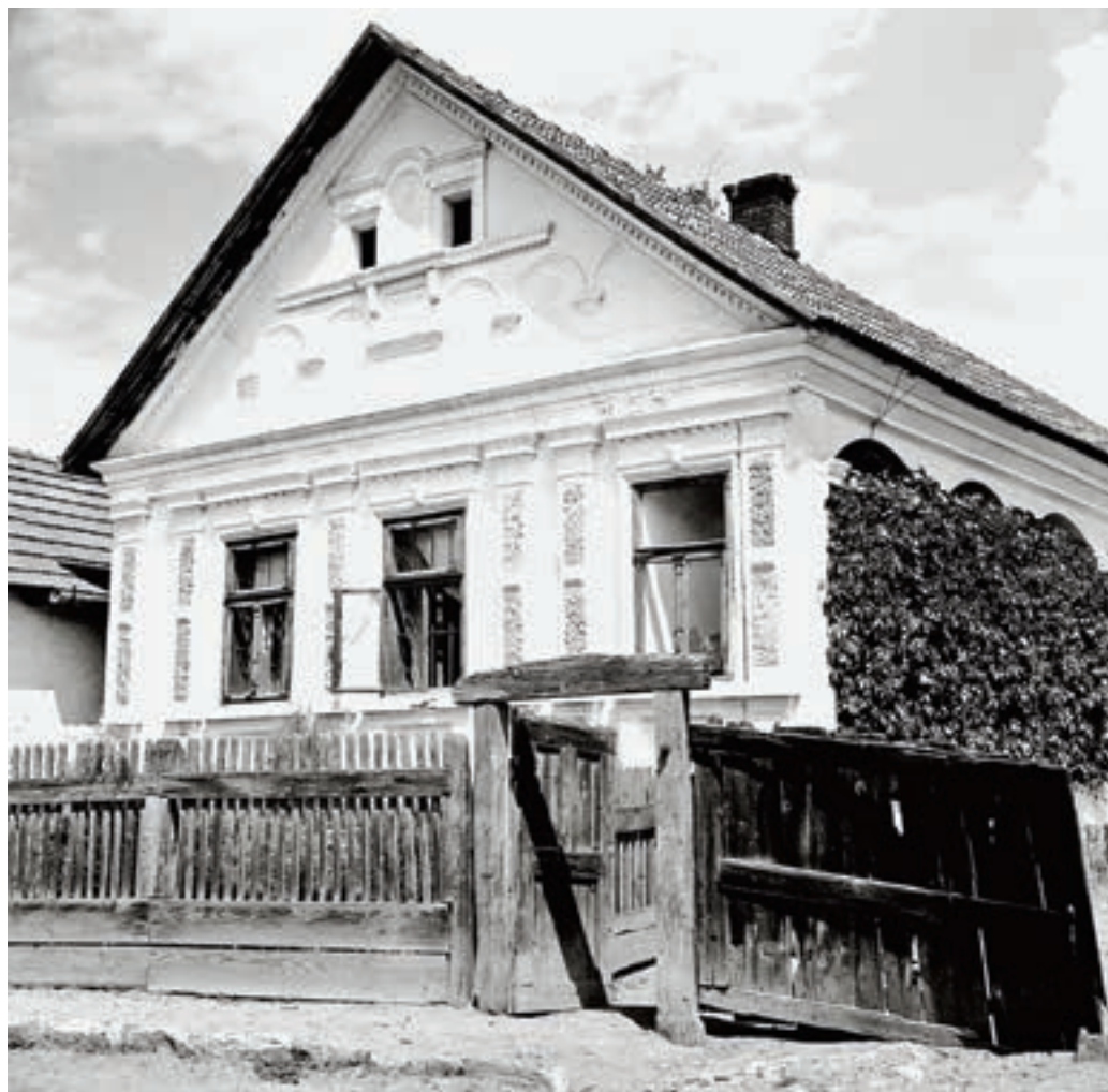
Borsod, József Attila utca 8. sz. alatti lakóház, 1951