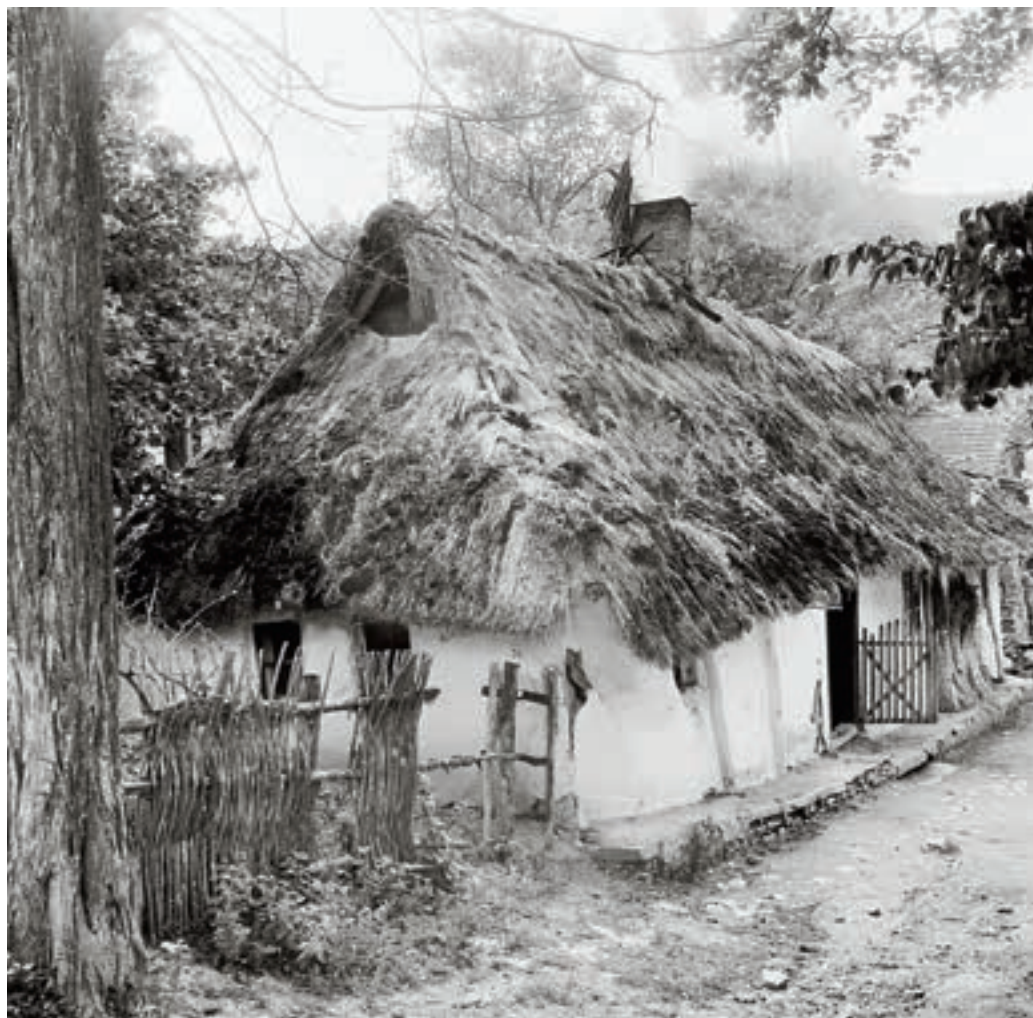
Szín, Szabadság út 24. sz. alatti lakóház, 1954