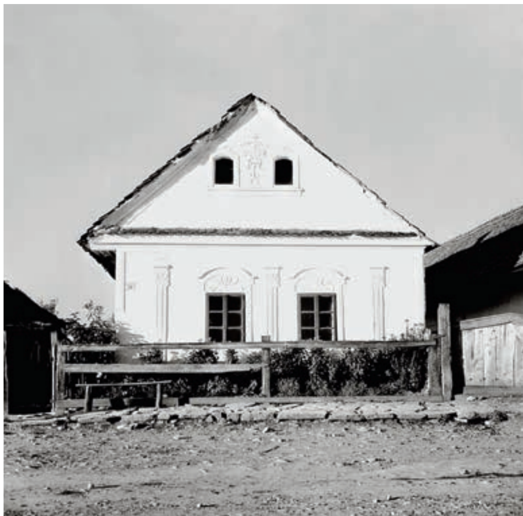
Perkupa, Petőfi Sándor utca 36. sz. alatti lakóház, 1954