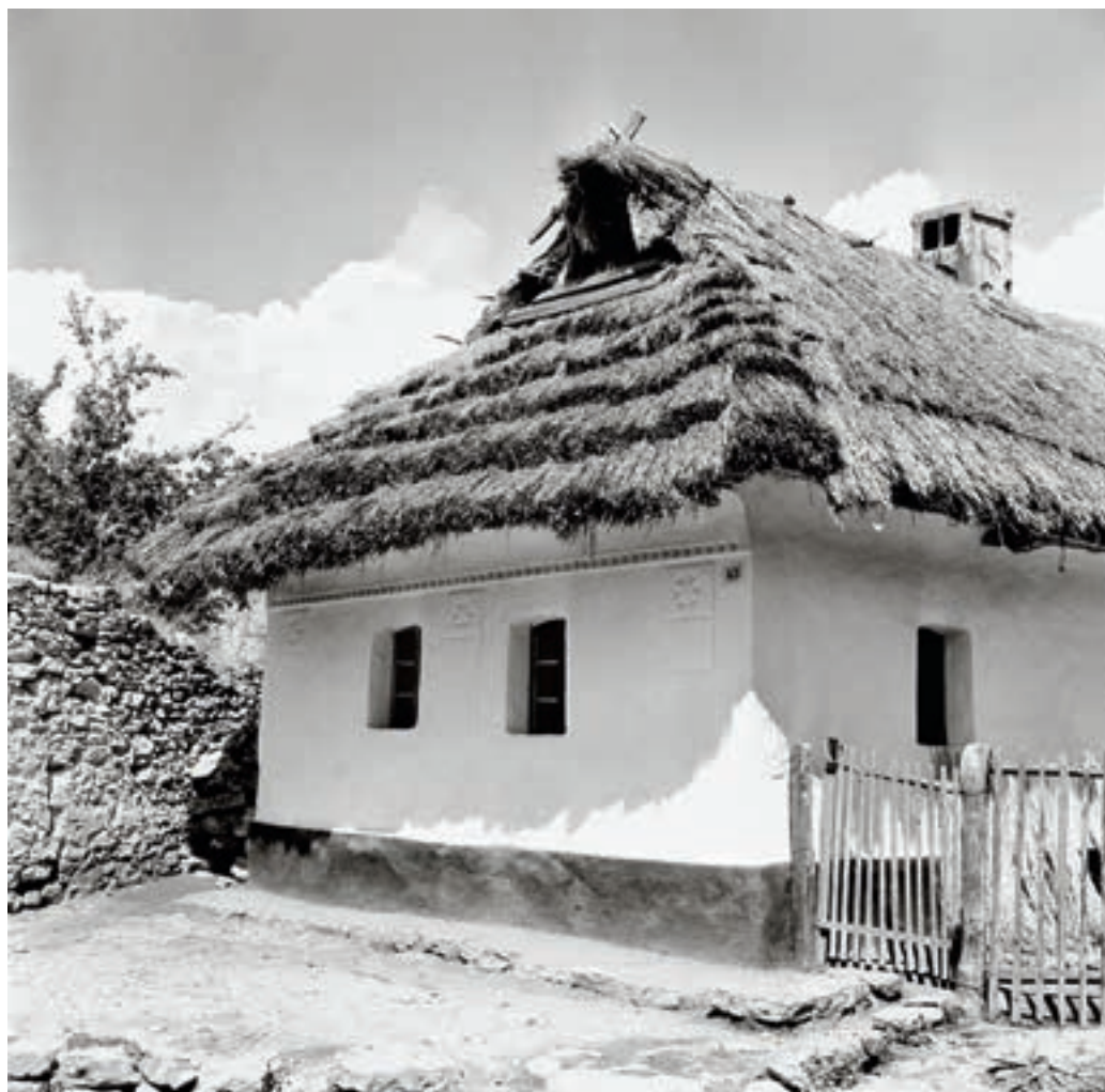
Hídvégardó, Petőfi Sándor utca 43. sz. alatti lakóház, 1954