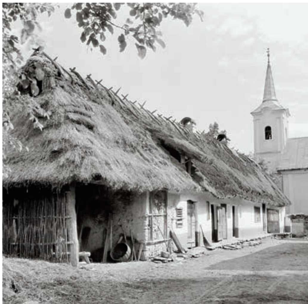
Perkupa, Petőfi Sándor utca 51. sz. alatti lakóház, 1953