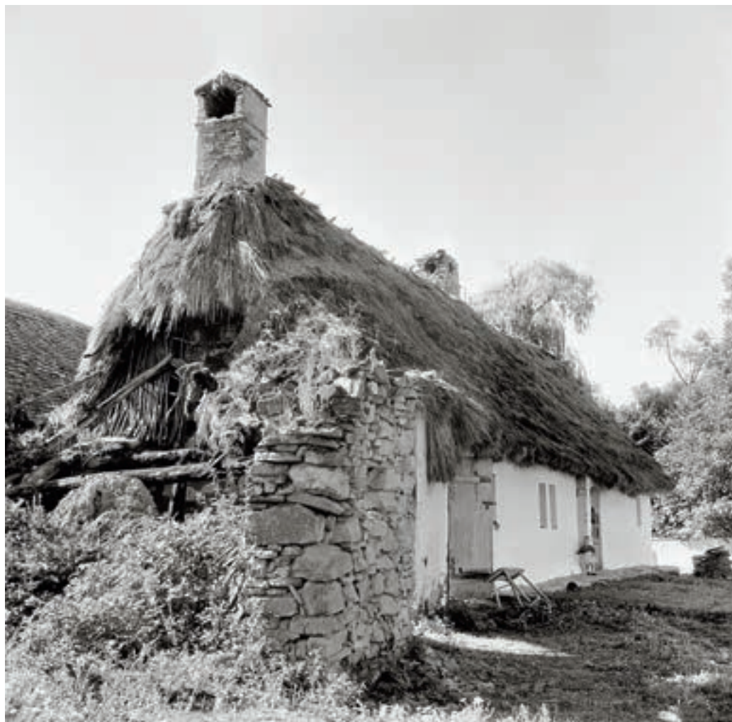
Perkupa, Petőfi Sándor utca 49. sz. alatti lakóház, 1954