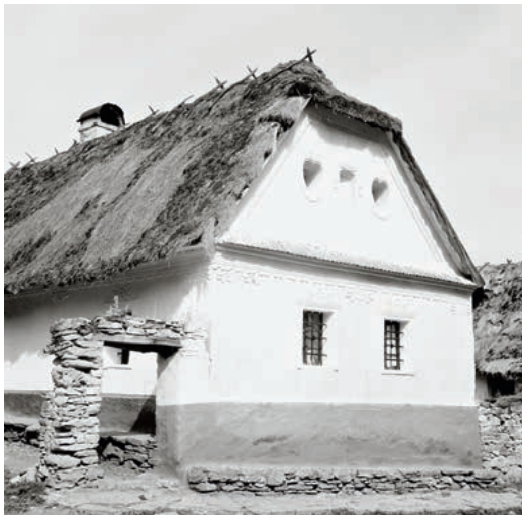
Perkupa, Petőfi Sándor utca 51. sz. alatti lakóház, 1953