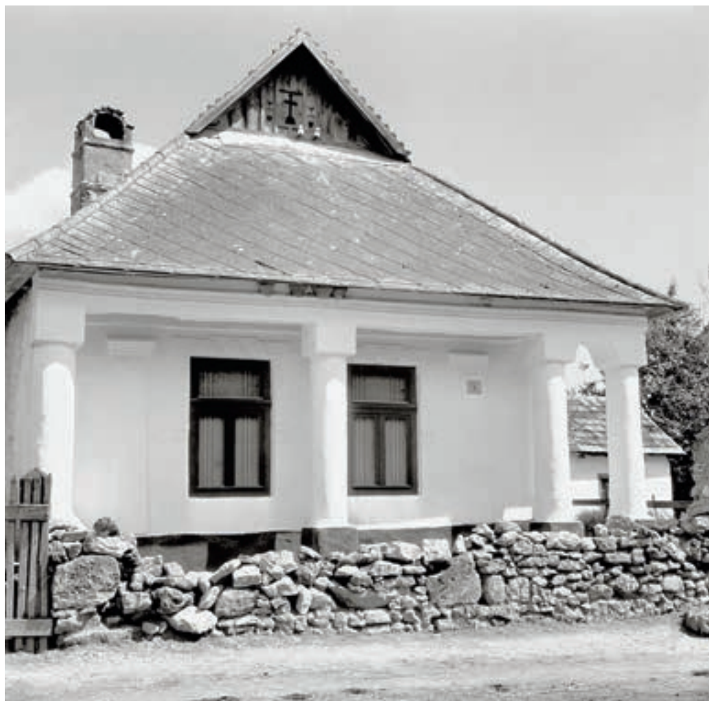
Hídvégardó, Fő út 5. sz. alatti lakóház, 1954