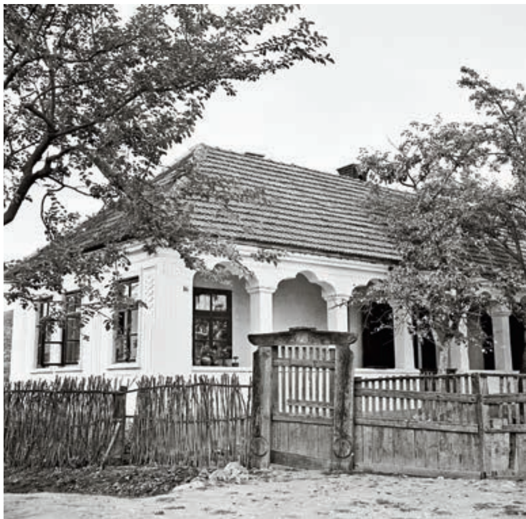
Szalonna, Kossuth Lajos utca 47. sz. alatti lakóház, 1950