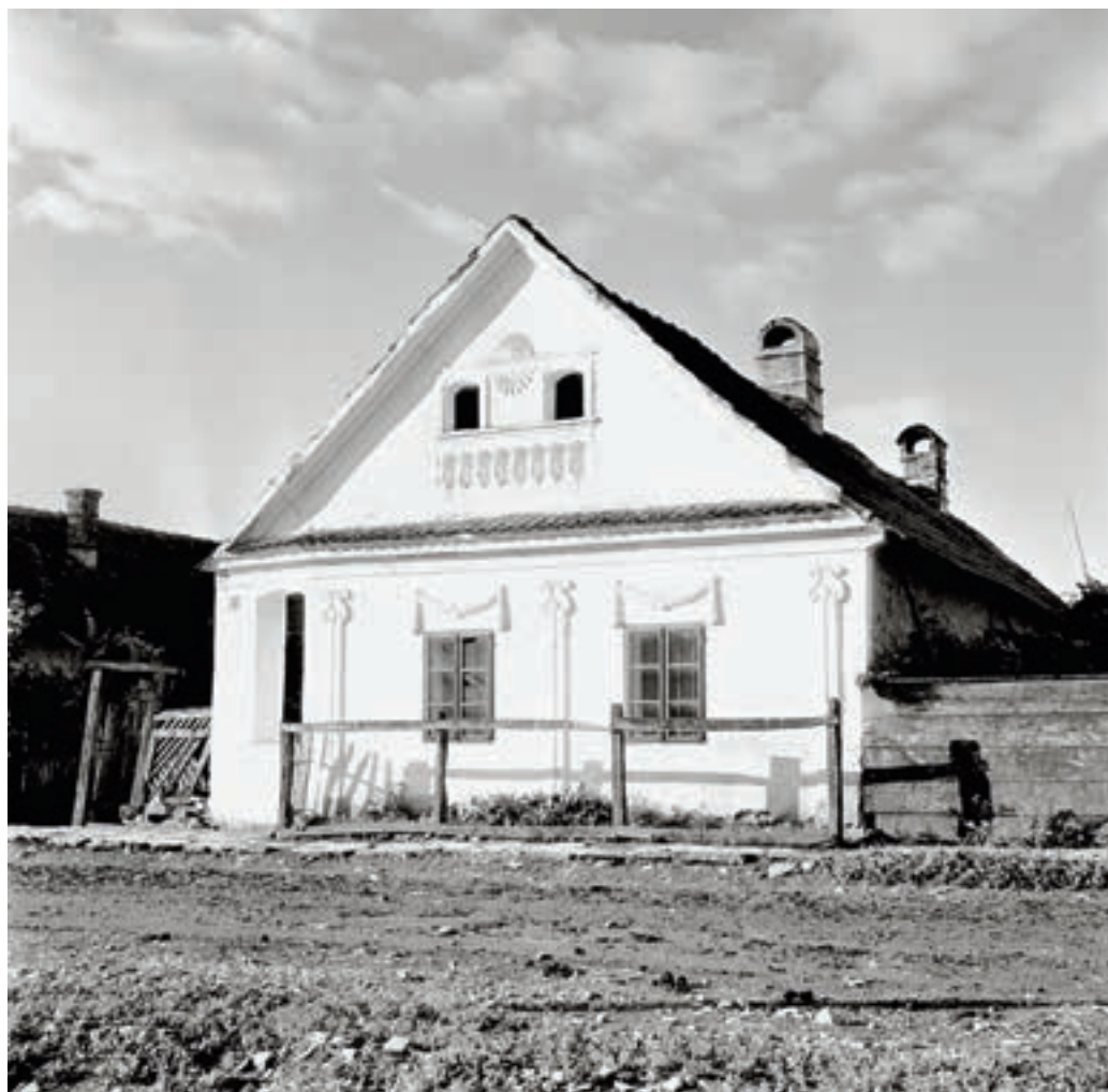
Perkupa, Petőfi Sándor utca 24. sz. alatti lakóház, 1954