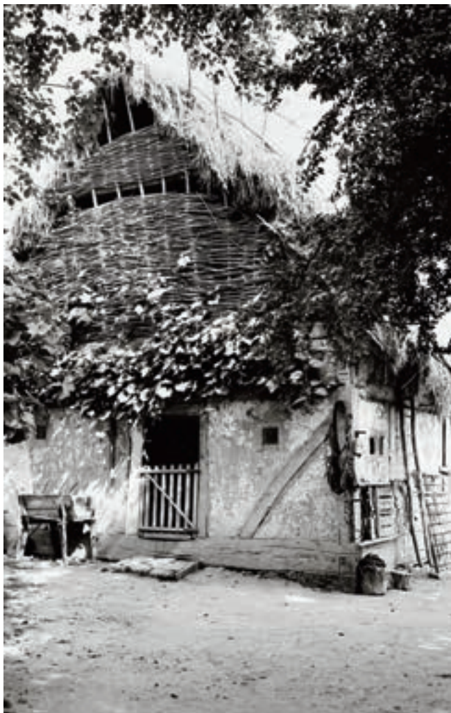
Kamra. Vejti