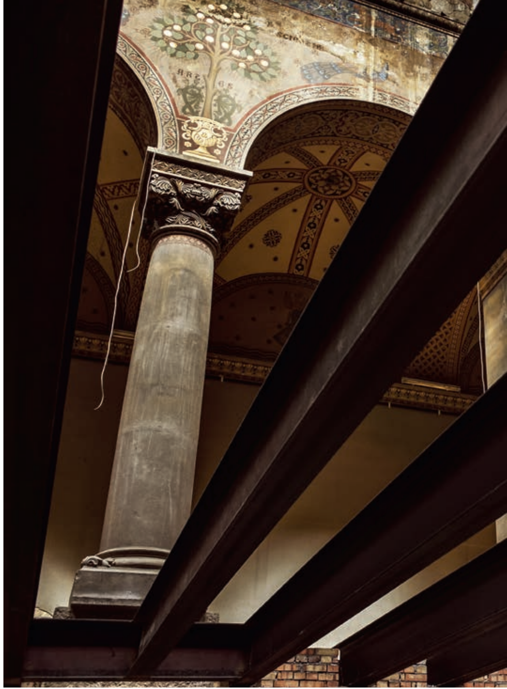
A Szépművészeti Múzeum jelenleg folyó rekonstrukciója