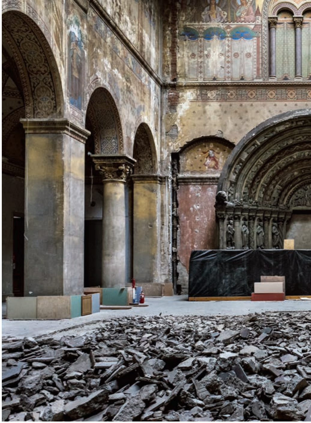
A Szépművészeti Múzeum jelenleg folyó rekonstrukciója