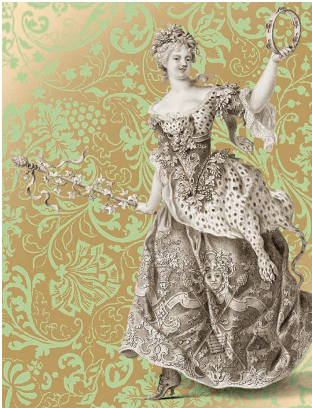
Antonio Daniele Bertoli: Bacchánsnő, Bécs, 1730 körül Theatermuseum, Wien