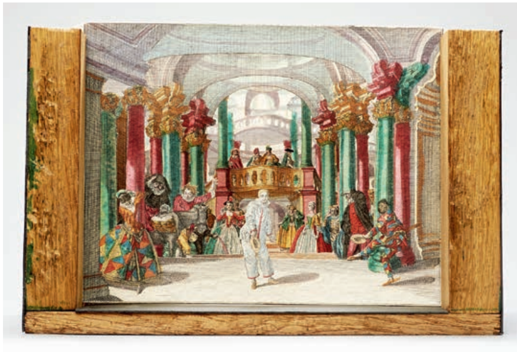
Olasz komédiások előadása Ötrészes miniatűr színház, Augsburg, 1750 körül Martin Engelbrecht, Theaterrmuseum, Wien