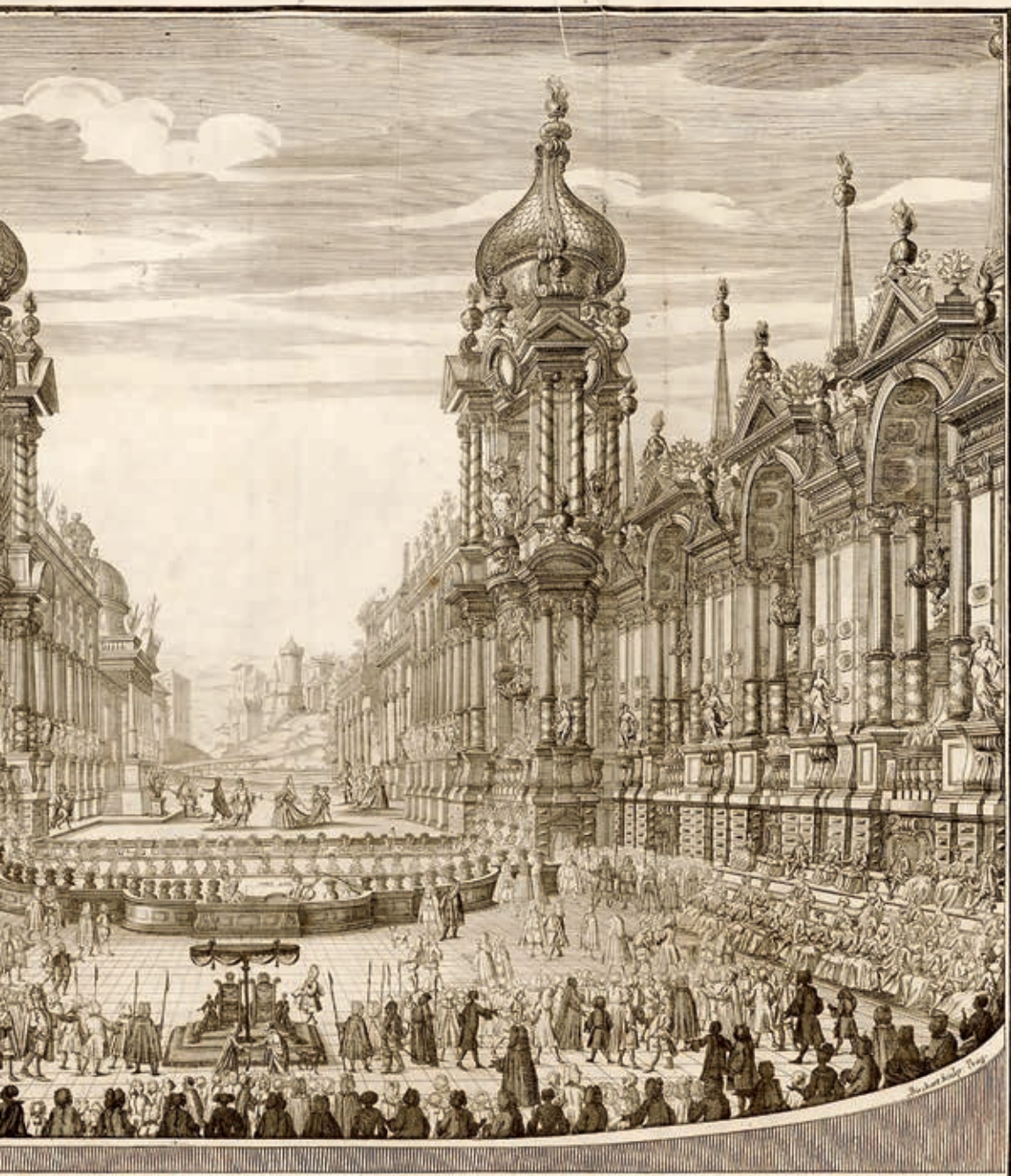
OSTANZA e FORTEZZA rappresentata nel Reale Castello di Praga L'anno MDCCXXIII.