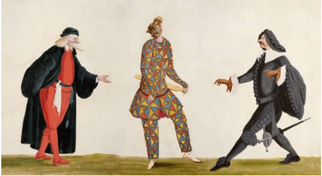
Pantalone – Arlecchino – Capitano. Bécs, 1680 körül Lodovico Ottavio Burnacini, Theatermuseum, Wien