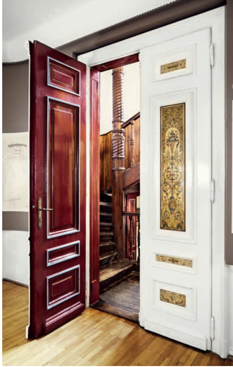
Az Erdős Renée-ház részlete