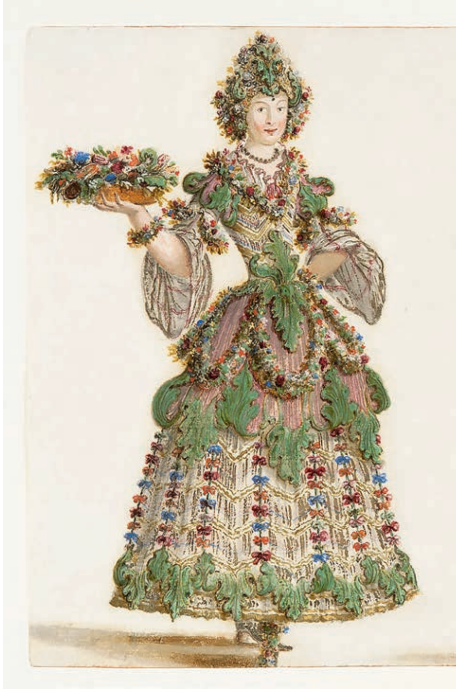
Giardinieri - Szereplők a bécsi királyi udvar karneváli játékból, Bécs, 1680 körül Lodovico Ottavio Burnacini, Theatermuseum, Wien