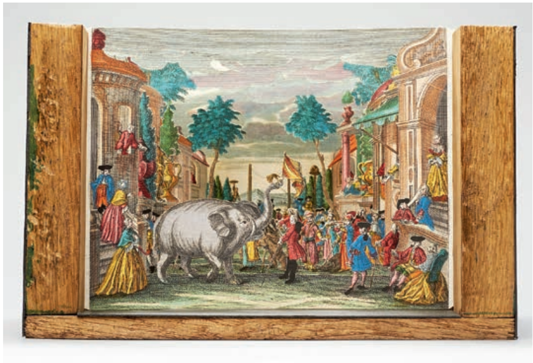
Idomított állatok előadása Ötrészes miniatűr színház, Augsburg, 1750 körül Martin Engelbrecht, Theaternuseum, Wien