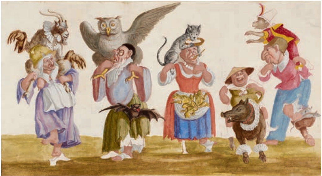
Maschere ridicole, Bécs, 1680 körül Lodovico Ottavio Burnacini, Theatermuseum, Wien