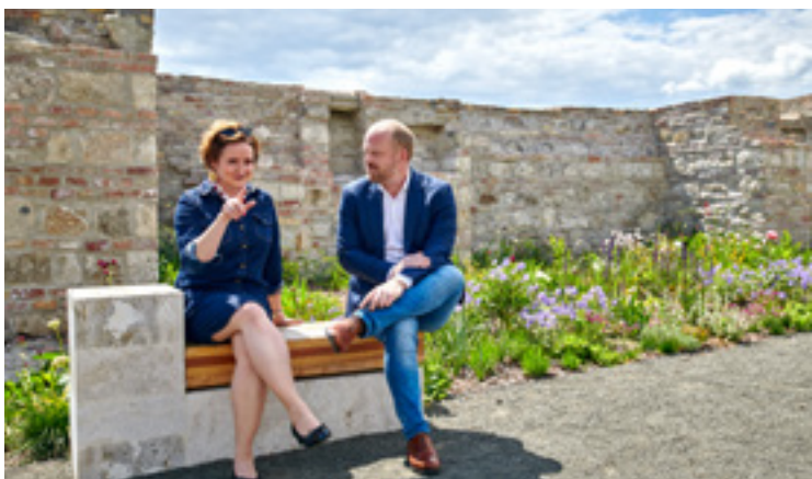
A Budavári Palotanegyed megújult pihenői és virágágyásai