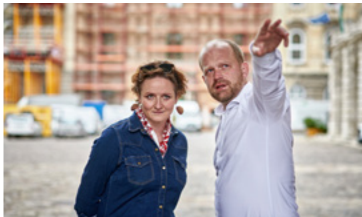
Az Oroszlános udvarban is van mit megnézni