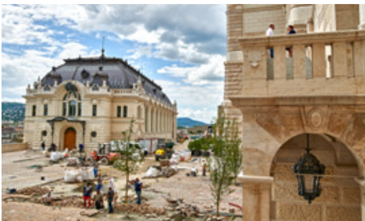
A Lovarda impozáns épülete a Stöckli lépcsőről