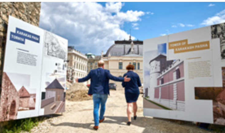
Még építési terület a Lovarda előtt