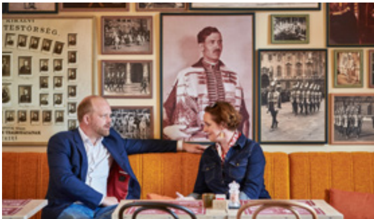
A Főőrségben kialakított kávézóban

ingatlanfejlesztés, hanem történelmi rekonstrukció zajlik itt a Várban, minden épületre vonatkozóan elkészült egy történelmi, tudományos dokumentáció. Szakértői csapat ássa elő a legkülönbözőbb szállítóleveleket, számlákat, színmintákat a hiteles rekonstrukcióhoz. Utóbbiakból tudjuk például, milyen is volt pontosan a híres Hauszmann-zöld, amely például a Lovardában számos belsőépítészeti elemnél megjelenik. Ugyanakkor a megújuló funkcióknak megfelelő, 21. századi szempontokat is figyelembe kell vennünk – például biztosítanunk kell az akadálymentes közlekedést, és természetesen máshogy alakítjuk ki most a Főőrség belső tereit, mint száz éve, hiszen most nem egy puritán laktanya-épület, hanem egy kávézó és étterem várja ott a látogatókat.”