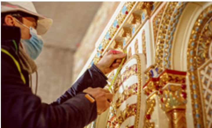
Teljesen megújul a Szent István-terem