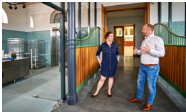
A Lovarda egyes terei catering célra kialakítva