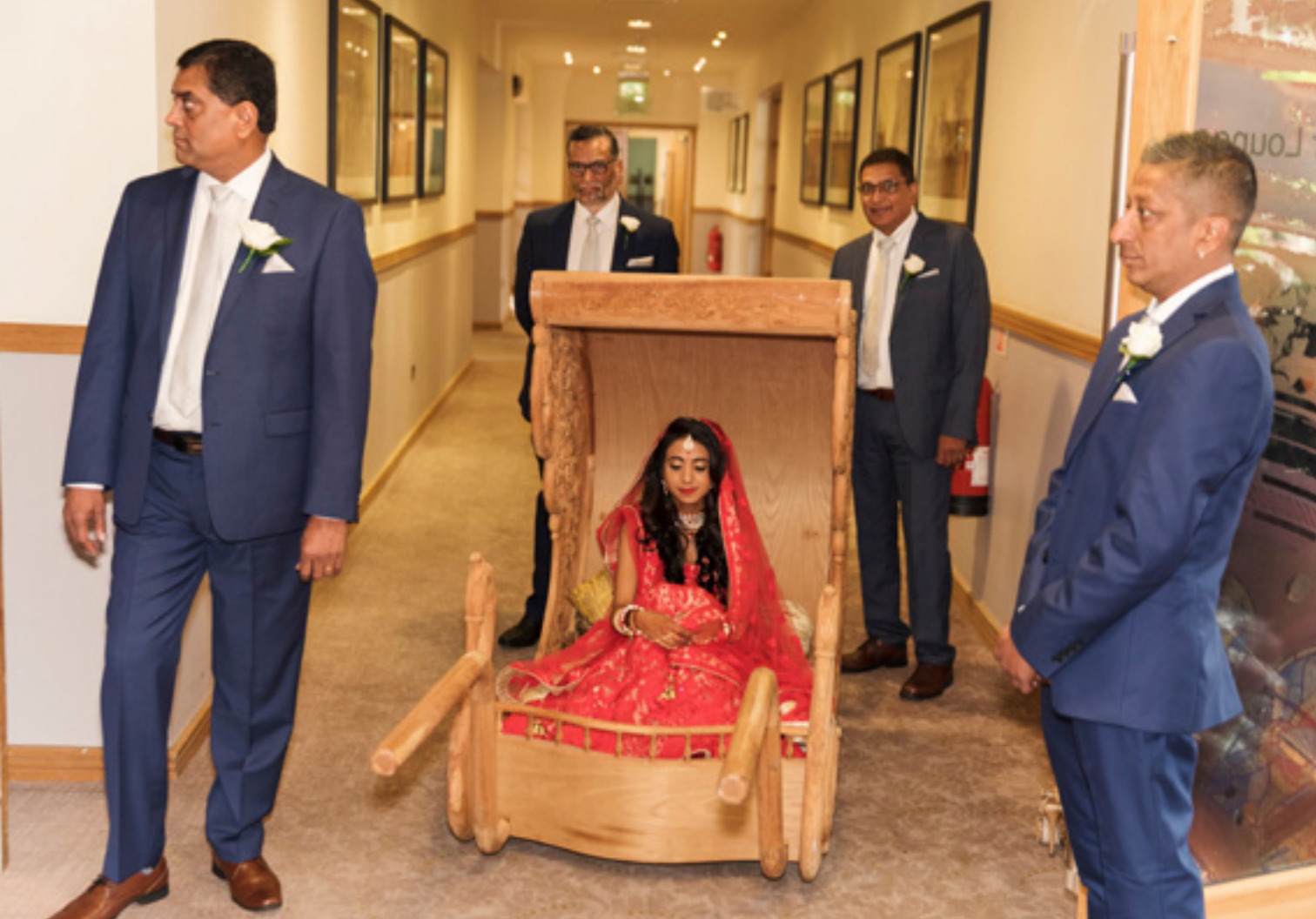
Hindu esküvő Windsorban. Egyesült Királyság, 2017

korában odaigérték. „Ránéztem, és azt gondoltam, hogy nem! Tizenéves vagyok, de alacsonyabb nálam! ... Visszaengedtek az iskolába, de tizenöt és fél éves koromra már hatalmas lett a nyomás” – magyarázta tovább a hallgatóságnak.