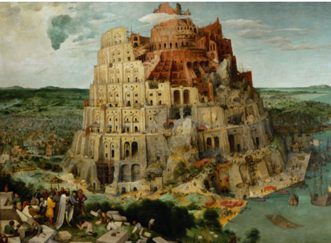
Babel tornya (1563). Id. Pieter Bruegel festménye

a dicsőség) vagy Véghelyi Balázs Bábel tornya újra épül című költeménye arról, hogy a 21. századi Bábel építői „veszélyesebbek a régieknél”, és tornyuk „lerombolhatatlan lesz, / mert nem kőből, de ködből épül” – hazug eszmék, hamis ideológiák ködéből –, „és elnyeli az eget is fölöttünk”. Elveszi sokaktól az Istent.