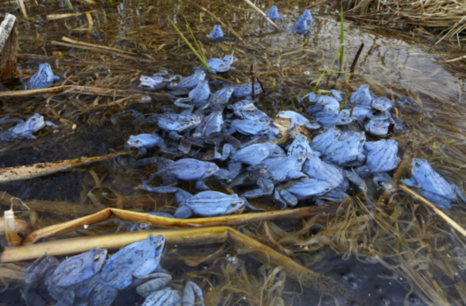
Mocsári békák ( Rana arvalis ) párzási időszakban

és mesterien utánozza a sárgarigó hangját. Aki eddig nem vágta le a sövényt a kertje körül, most már ne tegye; ha kedvezni szeretne a madaraknak, várjon vele a fészkelési idény végéig: a gallyak sűrűje madárfészkeket rejthet, biztonságot nyújtva a bennük cseperedő fiókáknak a macskák, szarkák és egyéb fészekrablók ellen! A telelni érkezett vetési ludak is elindulnak lassan vissza a tundrákra, átadva helyüket a nyári ludaknak, amelyek márciusban gyakran már tojásokon ülnek. A tojó egyedül kotlik, ám a gúnár is őrzi a fészket, és részt vesz a kislibák terelgetésében.