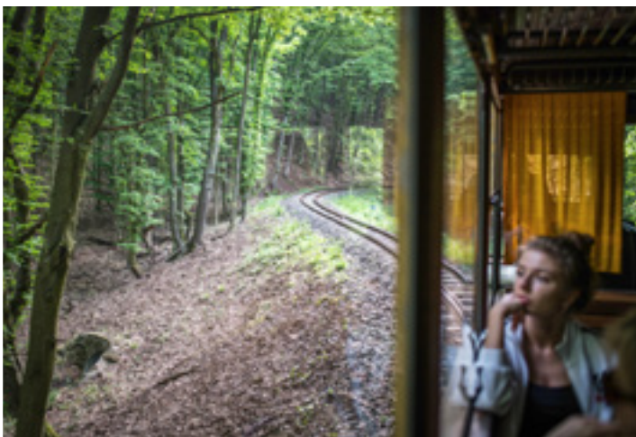
Bezina-völgy, erdei vasút