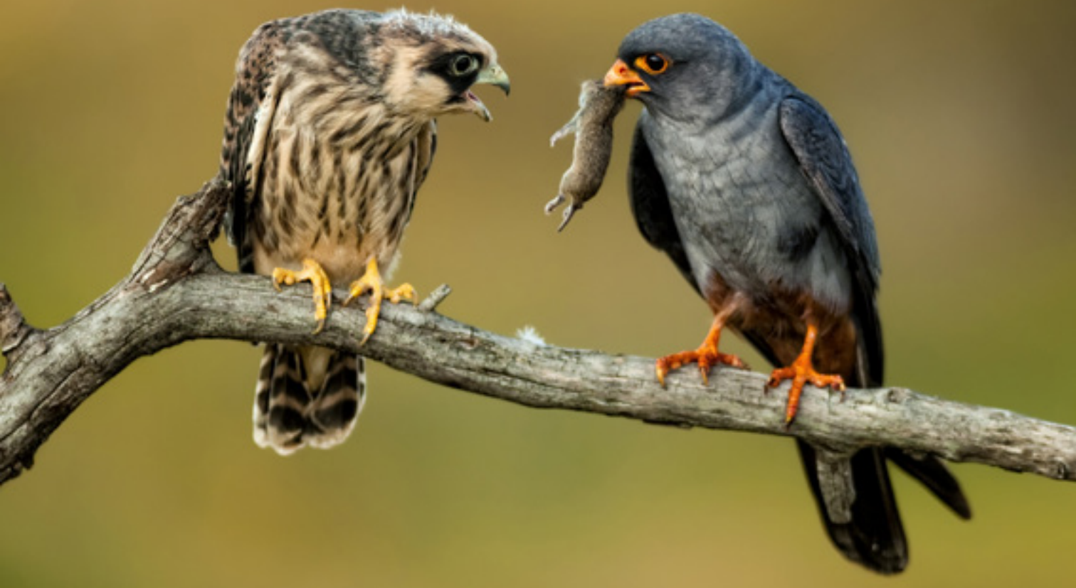
Kék vércsék udvarlás közben ( Falco tinnunculus )