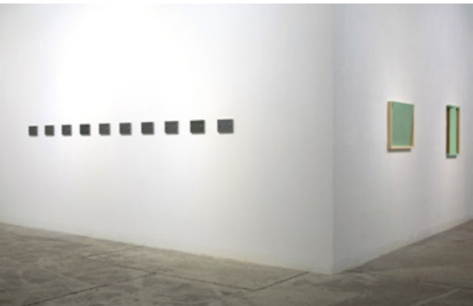
Szabó Dezső: Gradáció, 1996, üveg, luminogram, vas