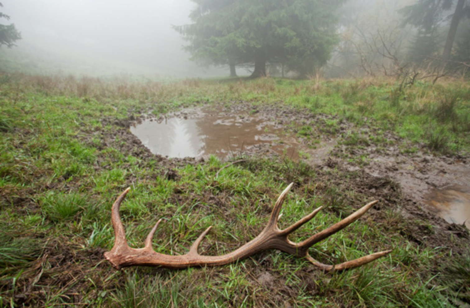
Gímszarva ( Cervus elaphus ) hullott agancsa

Egy-egy természetes nőstényt sokszor több hím is letámad, nemritkán már az úton is kénytelen a hátán cipelni rákapaszkodó udvarlóit.