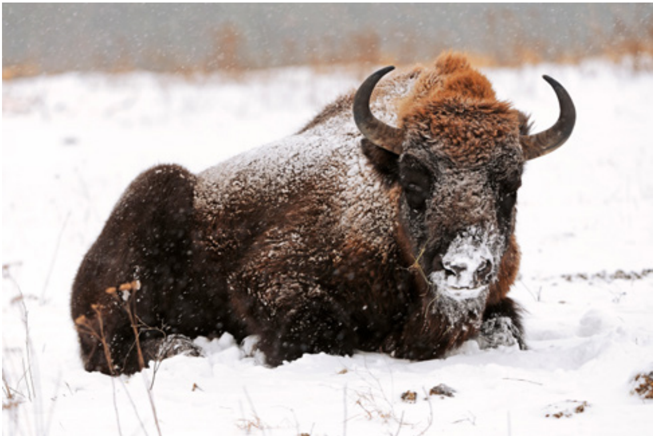
Európai bölény (Bison bonasus)