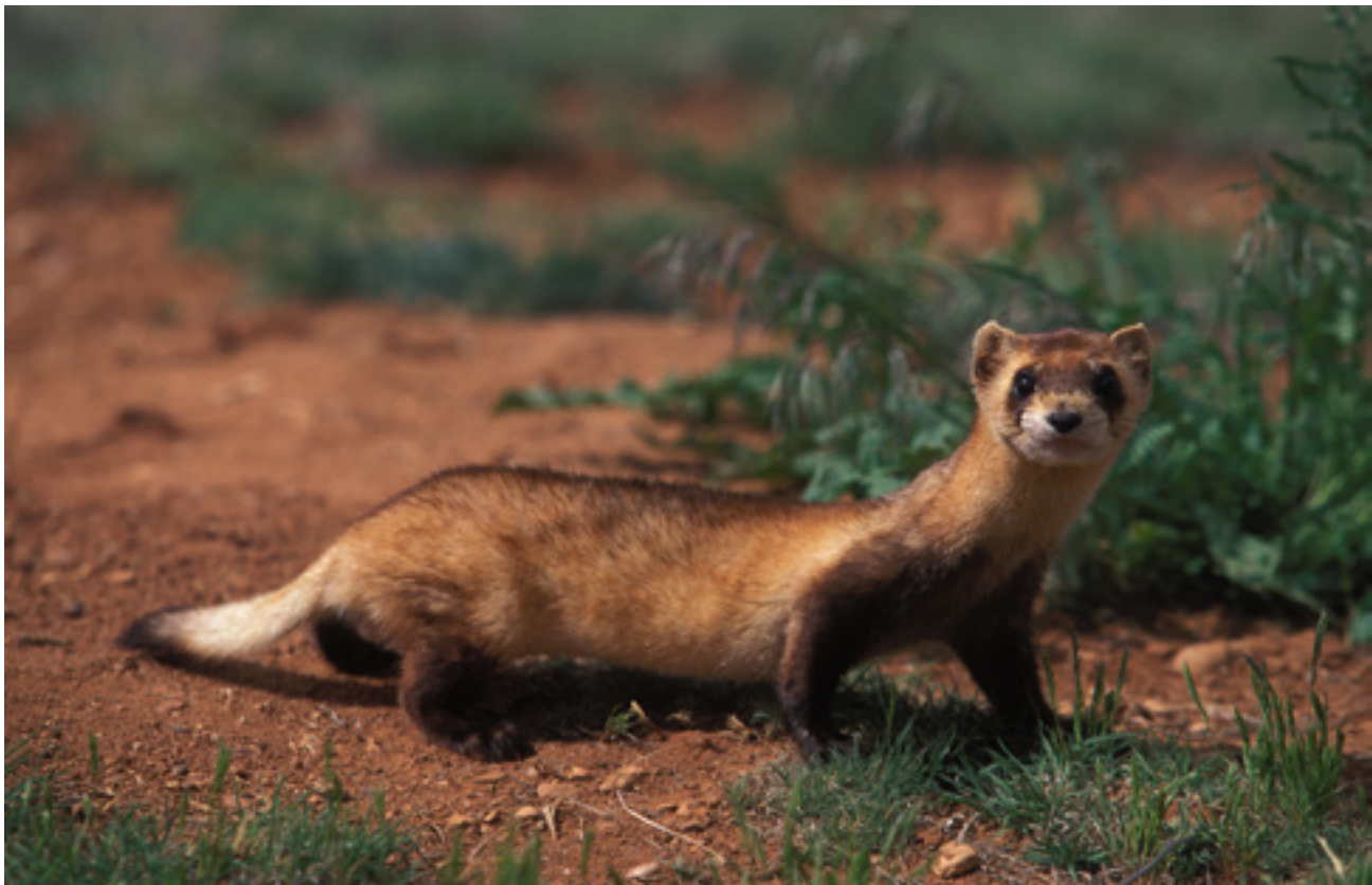
Feketelábú görény ( Mustela nigripes )

Nemcsak állatok, hanem növények is lehetnek veszélyeztetettek, és felkerülhetnek akár a kihalt fajok listájára is. Hazánkban több olyan élőhely-rekonstrukciós program is zajlik, amelynek célja a behurcolt, tájidegen növények kiirtása, hogy az őshonos fajok újra teret nyerhessenek.