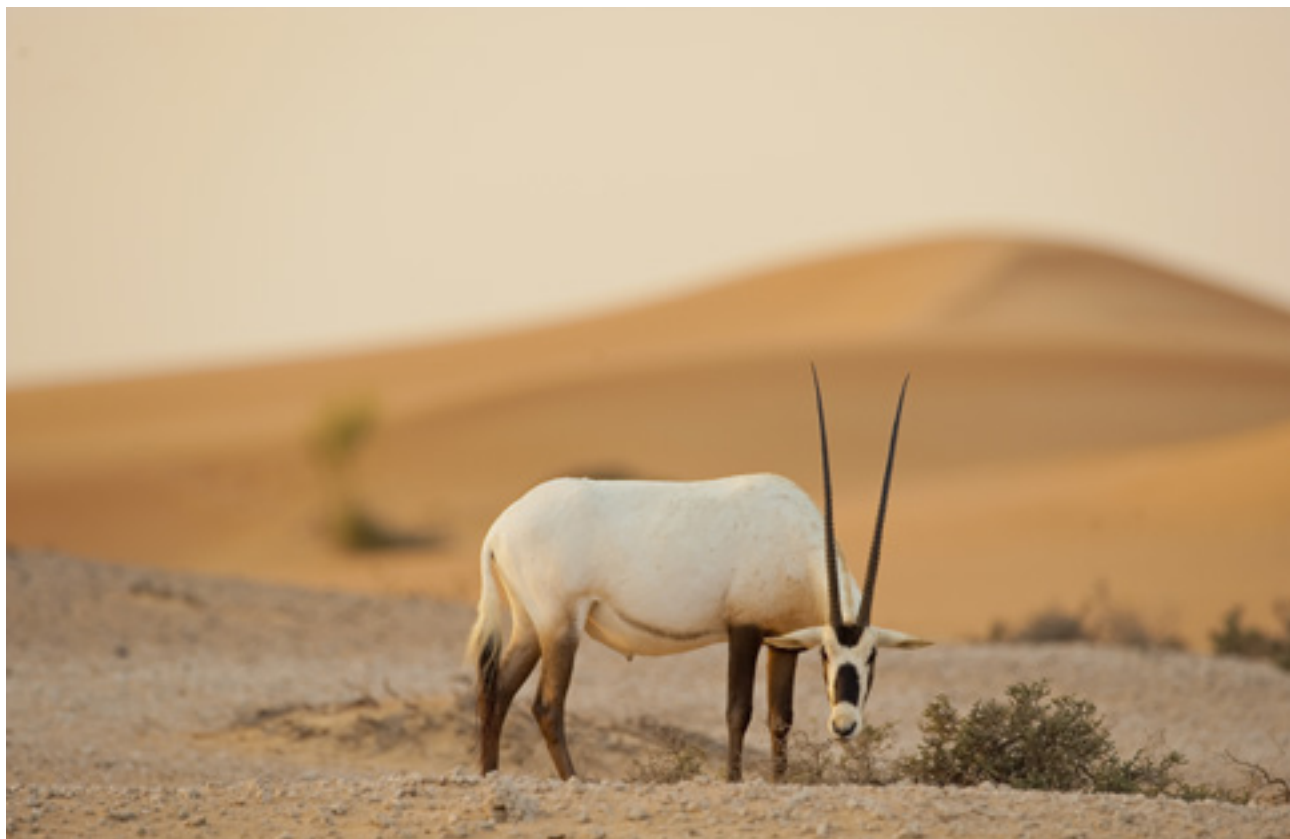
Fehér oryx. (Oryx leucoryx)