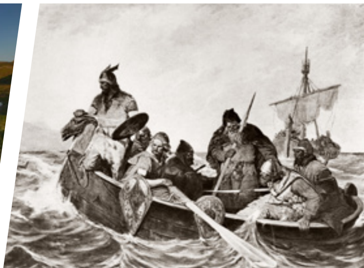
L'Anse-aux-Meadows, az eddig ismert egyetlen megmaradt viking település Észak-Amerikában. Northern Peninsula, Új-Fundland, Kanada