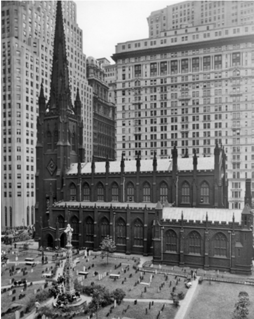
Az 1846-ban felépült Trinity (Szentháromság) templom Manhattan-ben egy 1950-es években készített fényképen. New York, Egyesült Államok

a kétféle rend törvényeit Isten alkotta. A Biblia szerint a szent sátor, majd az úgynevezett első, salomoni templom építése előtt Isten azt parancsolta, hogy a földi szent helyet hajszálpontosan a mennyei szentély – persze nem anyagi, hanem szellemi szentély – mintájára készítsék el. Így a jeruzsálemi templom minden eleme, alaprajzától és berendezési tárgyaitól kezdve színeig és a felhasznált