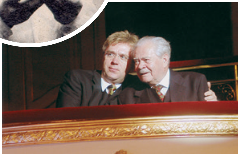
Fiával a 85. születésnapjának ünnepén a Vigszínházban (Budapest, 2005)