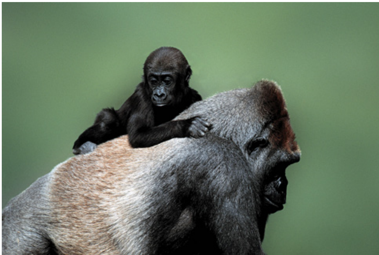
Nyugati gorilla ( Gorilla gorilla )