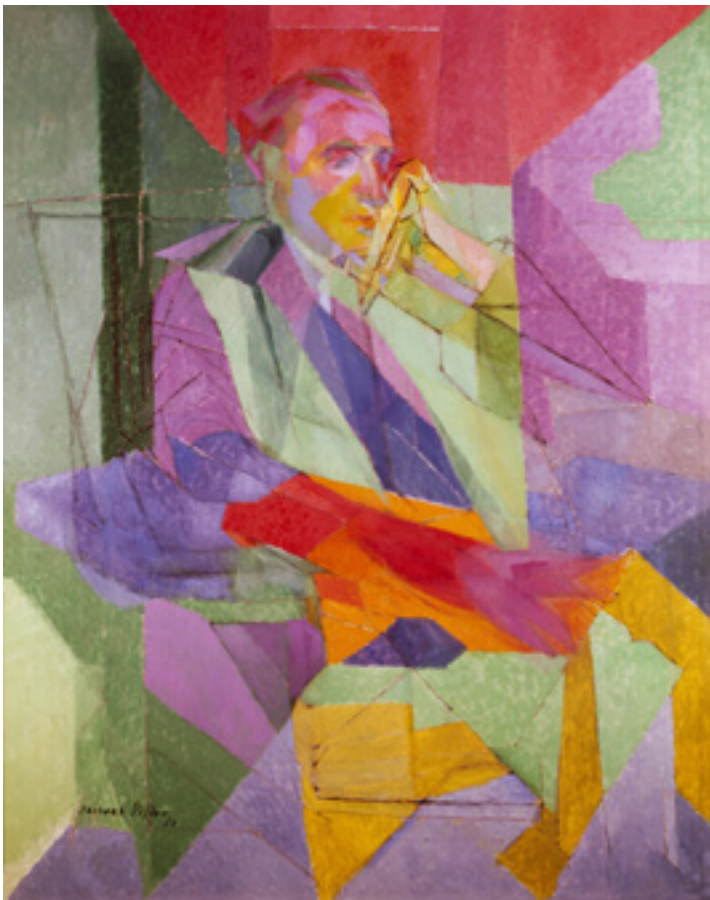
Jacques Villon (1875–1963): Marcel Duchamps portréja. 146×114cm, olaj, lenvászon, 1951.