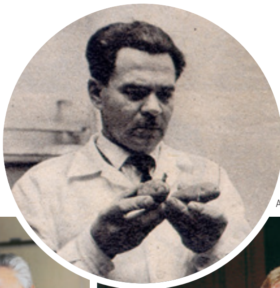
Az első, sajtóban megjelent fotója (1966)