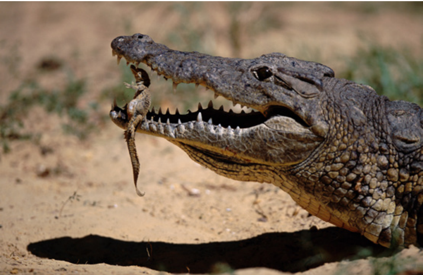
Níluszi krokodil ( Crocodylus niloticus )