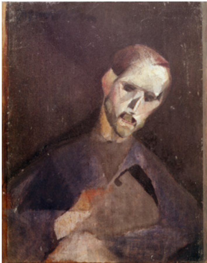
Jacques Villon (1875–1963): Raymond Duchamp-Villon portréja. 35×26,5 cm, olaj, fa, 1911.

ellenkezője is, egyfajta önmegvetés, aminek gyökere szintén a kisgyermekkorra nyúlik vissza. Végül sok-sok ember van, akiben ez a három ósok, a kisgyermekkorai sérülés, a felelősség háritása és az önmegvetés, a kóros kisebbségi érzés együtt jelentkezik – hogyan is ismerhetné önmagát? De bármi az ok, tény, hogy ha az ember pusztán saját erejéből akarja megismerni önmagát, garantáltan tévedni fog. Mások véleménye? Ezt fontos meghallgatni, de nem jó végső igazságnak elfogadni, mert az efféle vélekedés sokszor felszínes, téves, elfogult, netán rosszindulatú is lehet, vagy épp a hízelgés, az érdek motiválja. Akkor milyen forrásból ismerhetjük meg önmagunkat?