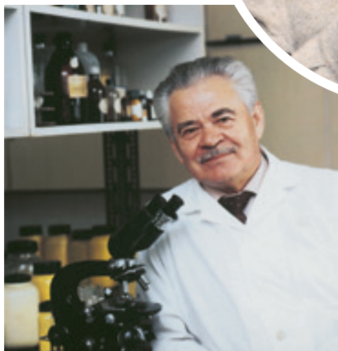
A legendás történetű fénymikroszkóppal (Kisvárdra, 1993)