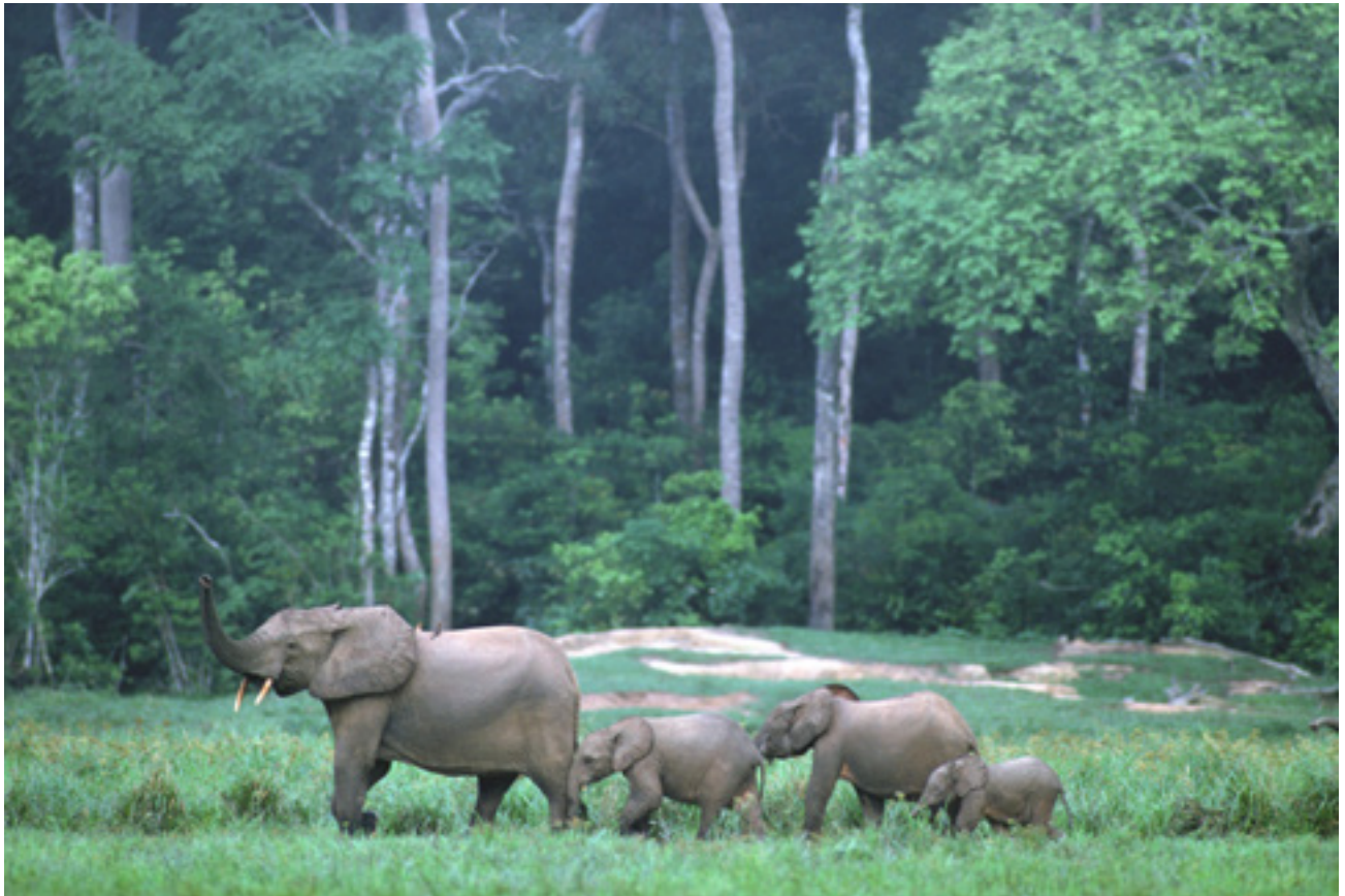
Afrikai elefánt ( Loxodonta africana )