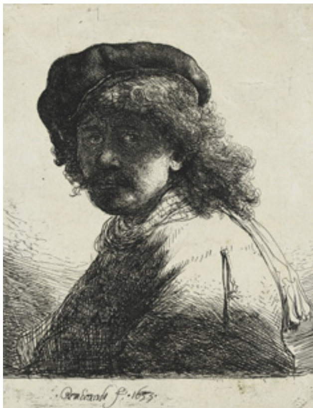
Rembrandt Harmensz van Rijn Sápas önarckép ellenfényben, 1633 rézkarc, papír, II. állapot, 133 × 104 mm

A németalföldi barokk stílusban alkotó művész pályája során mintegy hetven önarcképet készített kora húszas éveitől egészen késő öregkoráig. A köztudatban e tény mint az önmagunkkal való kíméletlen szembenézés gesztusát tartjuk számon. Ám a kutatók ma már inkább úgy vélik, az önarcképei sokkal inkább technikai és megvilágítási kísérletekként, sőt, még szerepjátékként is szolgáltak.