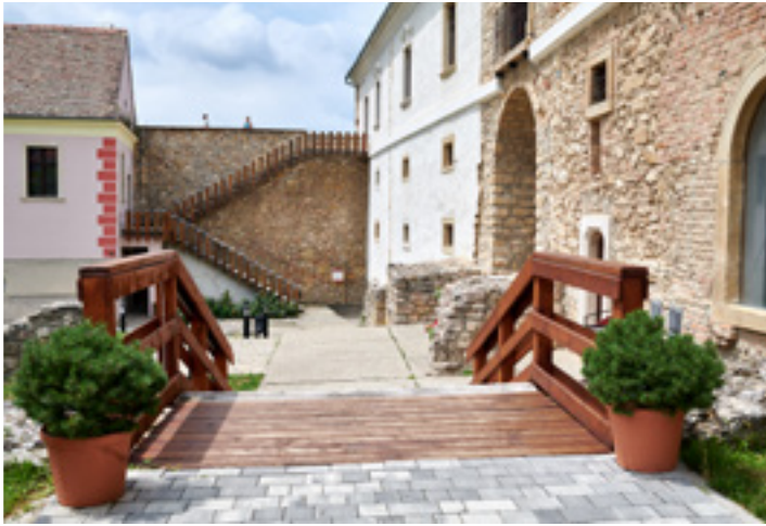
A pécsváradi vár