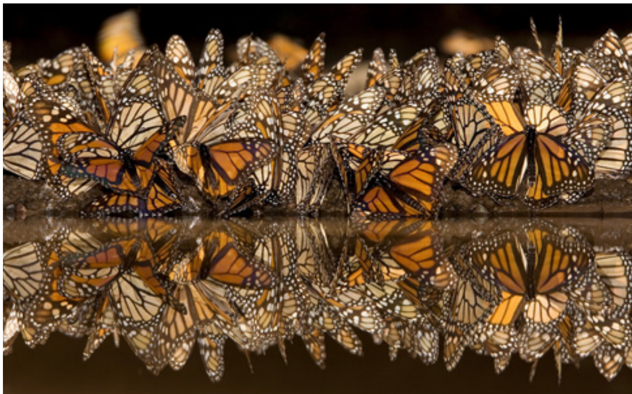
Pompás királylepké (Danaus plexippus)