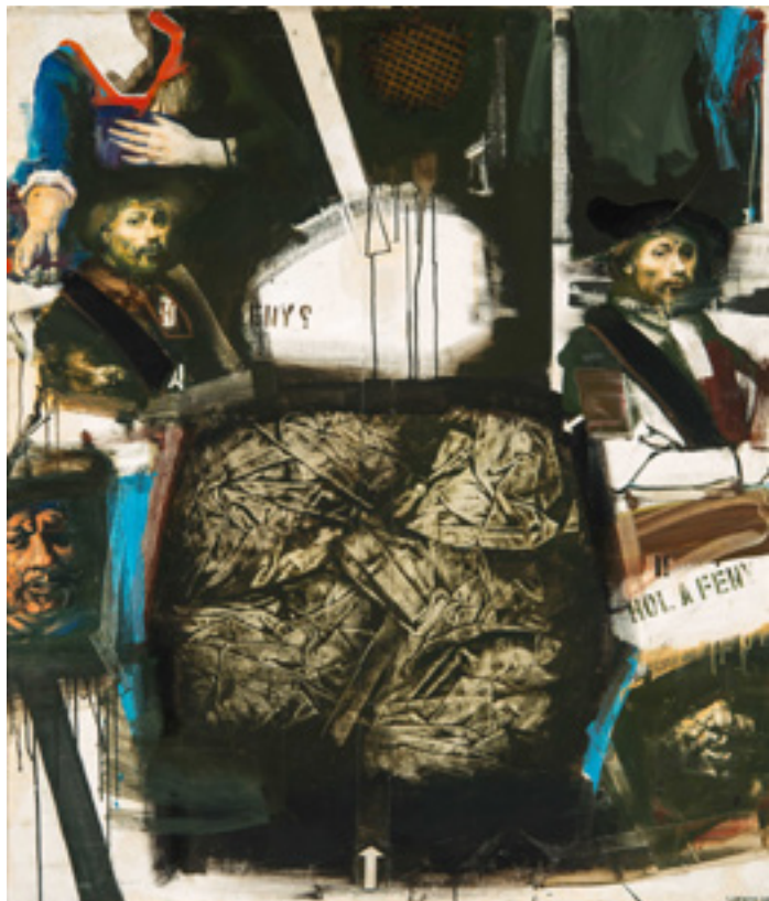
Lakner László: Rembrandt tanulmányok, 1966, olaj, vászon, 110 × 95 cm Szépművészeti Múzeum Budapest – Maqvar Nemzeti Galéria, Budapest