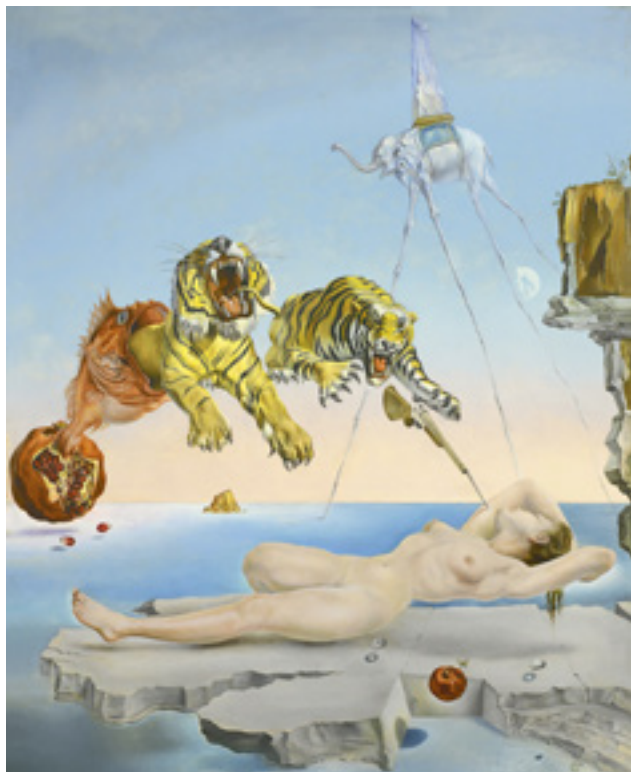
Salvador Dalí: Álom, melyet a gránátalma körül repkedő méh váltott ki egy pillanattal az ébredés előtt, 1944; olaj, fa, 51×41 cm; Museo Thyssen-Bornemisza, Madrid; © Museo Nacional Thyssen Bornemisza, Madrid, © Salvador Dalí, Fundació Gala-Salvador Dalí

Budapest, Magyar Nemzeti Galéria, 2019. október 20-ig