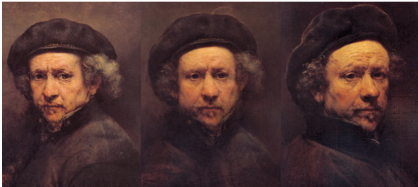
Forgács Péter: Idő/közben: Rembrandt morfok, 2006 Videoinstalláció, 35.30 min. Szépművészeti Múzeum, Budapest