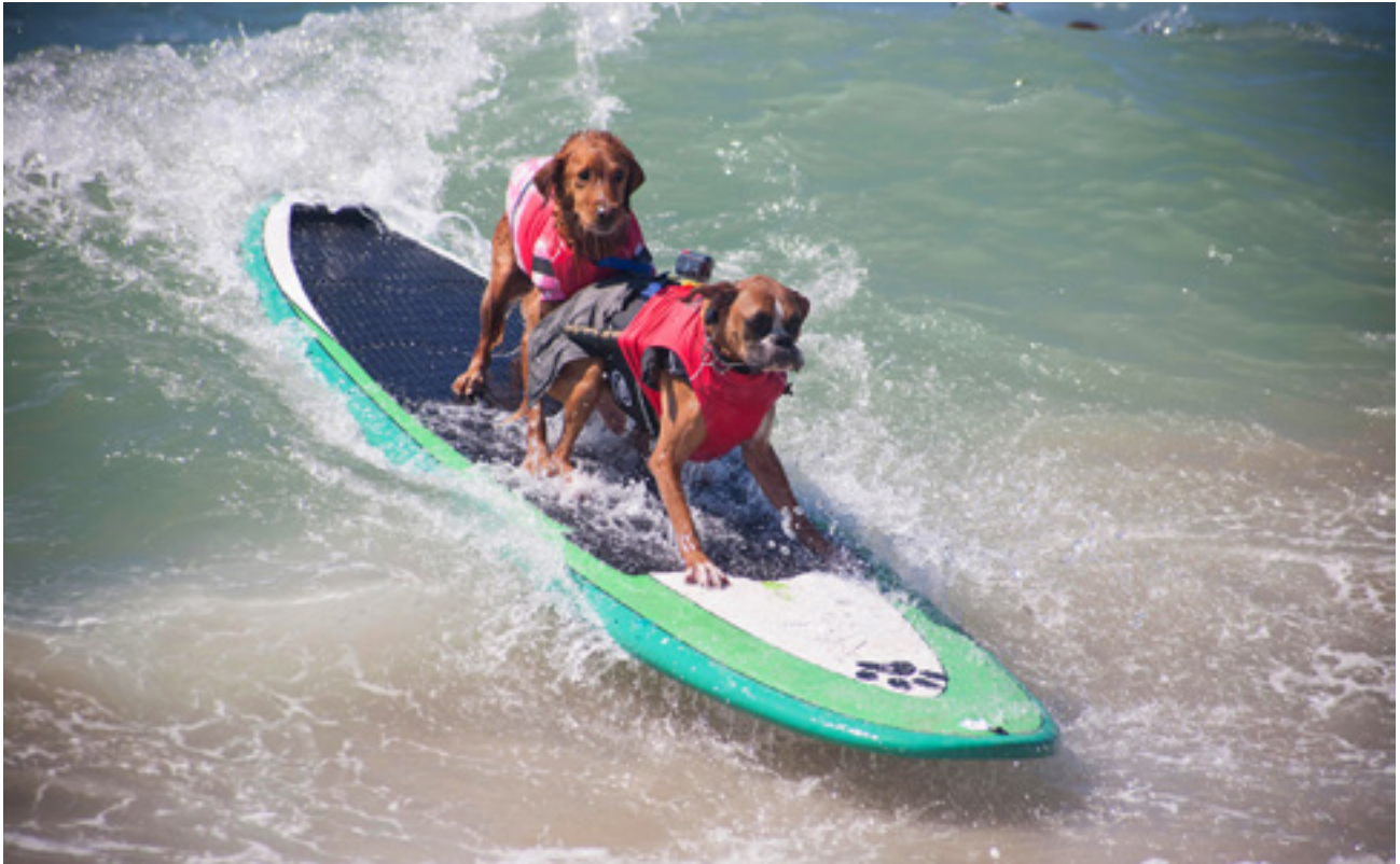
Páros versenyzők az évente megrendezésre kerülő Surf City Surf Dog kutyaszörf-versenyen. Huntington Beach, Kalifornia, USA, 2014