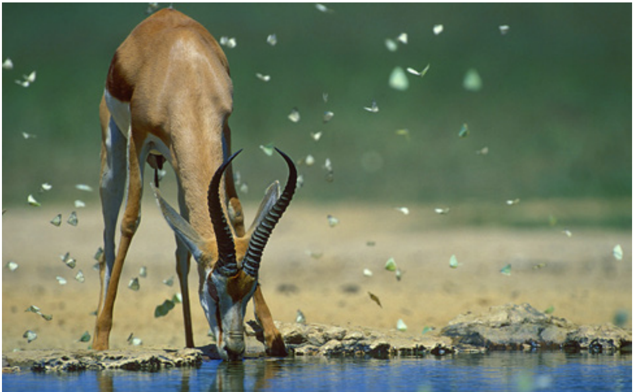
Vándorantilop ( Antidorcas marsupialis )