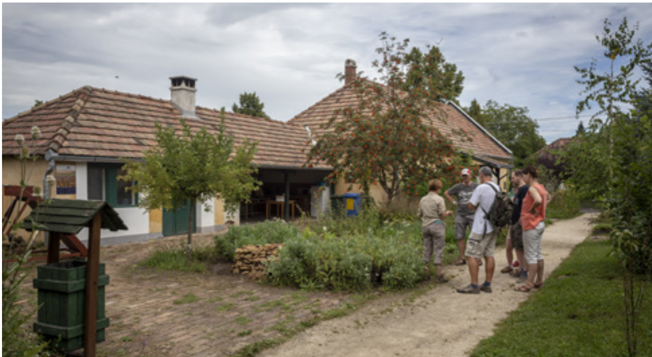
Dr. Szalai Miklós Gyógynövény Tankert és Oktatóközpont