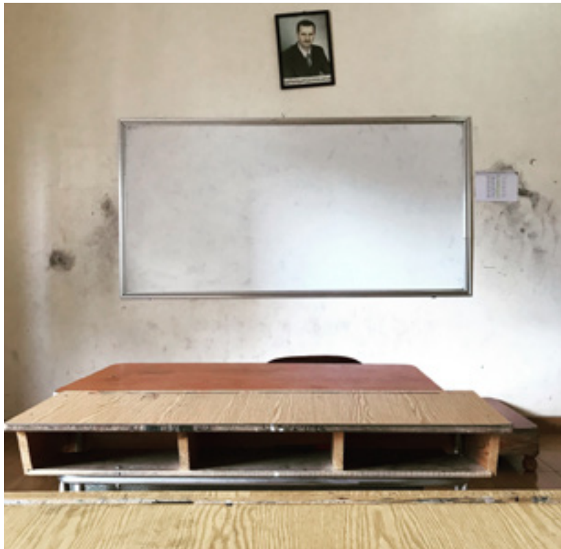
Örmény protestáns iskola

meggyilkolása után még Damaszkuszban is megemlékeztek róla, gyászmiséjén pedig számos muzulmán is részt vett.”