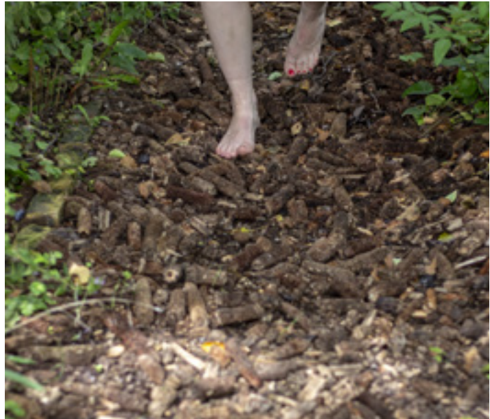
A meztlábás ösvény

volt. Az esperes ugyanis receptjeinek egy részét eladta a Szilasmenti Termelőszövetkezetnek, amely a megfelelő vizsgálatok után keverékeket gyártott. Saját teákat továbbra is készített, bevételeinek java részét pedig karitatív tevékenységre fordította. Gyógynövényes ismereteit, gyógyteáit a „Halimbai füveskönyv” című munkájában is átadta az utókornak. Házát, amelyben visszavonulásától haláláig élt, az egyházra hagyta, a megszépült kertet tíz évvel az emlékház felavatása után, 2010 augusztusában nyitották meg.