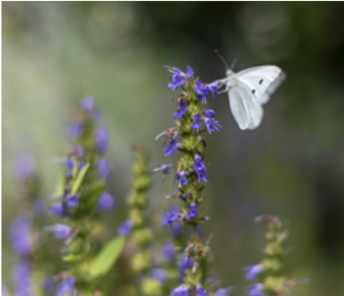
Káposztalepke orvosi zsályán