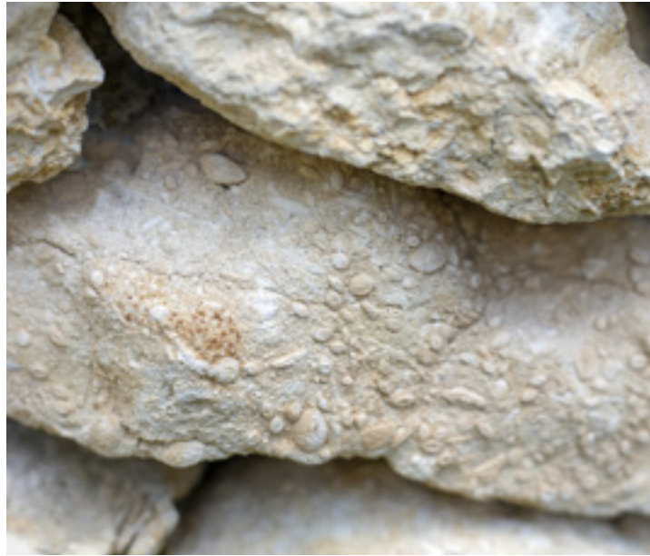
Nummuliteszes szőci mészkő

Az önkormányzat szeretné a teát forgalmazni is, azonban a füvek piacra dobása nem egyszerű. – Régebben ugyanis három termékcsoport volt: az élelmiszer, a gyógyhatású készítmény és a gyógyszer. A gyógyteák és a gyógytea-keverékek a másodikba tartoztak, viszont az a kategória megszűnt – mondja az alpolgármester. Emiatt a gyógytea vagy élelmiszer lehet (viszont akkor nem lehet ráírni a jótékony hatásokat), vagy pedig gyógyszer, de azok engedélyeztetése nagyon nehéz. Például, ha olyan teakeveréket készítenek, amely epebajokra jó, akkor kell olyan klinikai vizsgálattal rendelkezniük, amely a hatást igazolja. Egy ilyen viszont több millió forintba kerül, amit a település nem tud vállalni. A gyógynövényes kert fő feladatáként szeretnék meghagyni az ismeretterjesztést. Ahogy az alpolgármester fogalmaz: azzal egyrészt többet segítenek az embereknek, másrészt pedig igen nagy szükség van rá, hiszen az interneten rengeteg téves információ kering a gyógynövényekről.