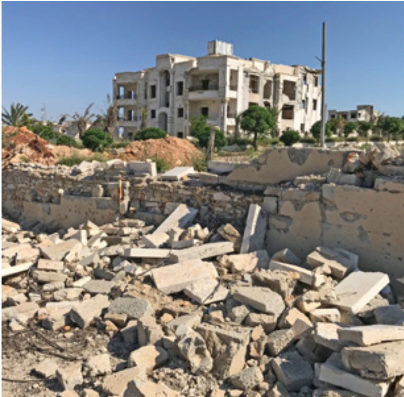
Lerombolt görögkatolikus iskolaközpont