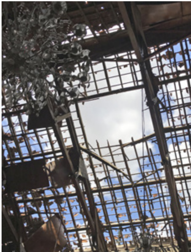
Örmény protestáns templom bombatámadás után