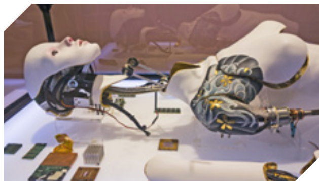
Android és alkatrészei a Waste c. mesterséges intelligenciát bemutató kiállításon. Belgium, 2017. november 26.