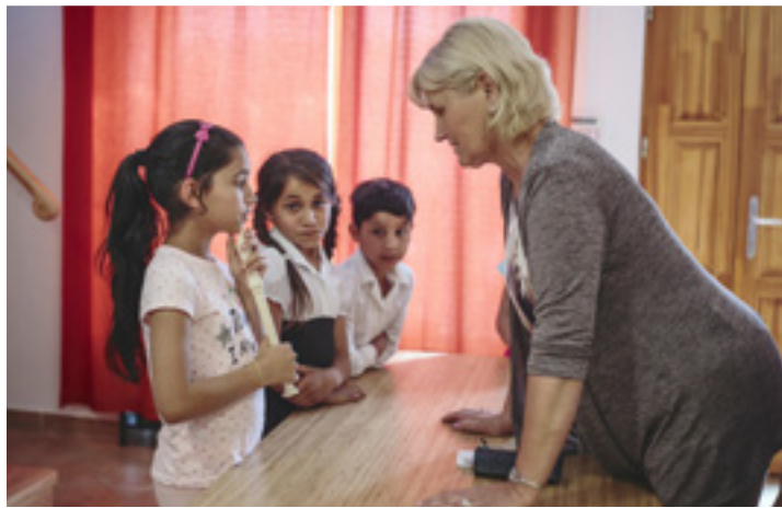
Megbeszélés a tanár nénivel az anyák napi műsor előtt