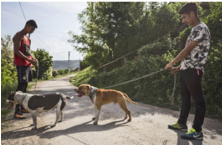
Kutyát sétáltató fiúk a Petőfi Sándor utcában