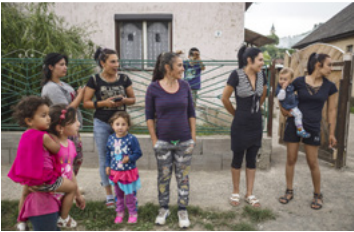
A Káló és a Rác család Kálóék Bartók Béla utcai háza előtt