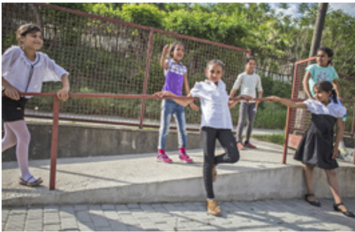
Kislányok a Nemadomfel ház udvarán