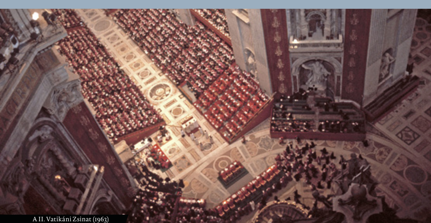
A II. Vatikáni Zsinat (1963)

való lefordítása minden egyes, a politika kérdéseiben állást foglaló hívő személyes mérlegelésének tárgya.