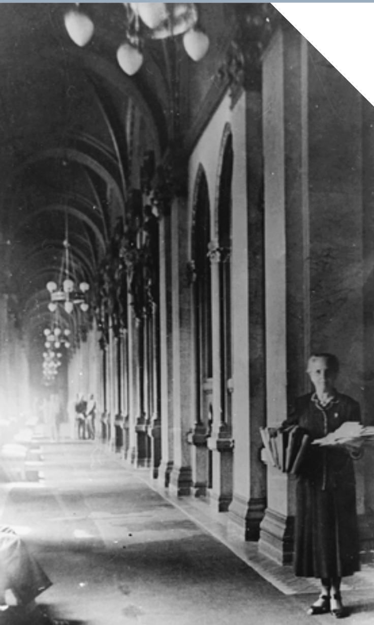
Slachta Margit, az első képviselő a magyar parlamentben, az Országház folyosóján (1920)

A keresztény hit megélése ugyanis nemcsak magánügy, hanem legalább ugyanannyira közügy is, vagyis egy „keresztényebb” társadalom építése.