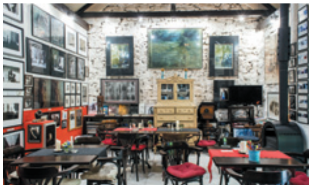
A Pajta Galéria (Salföld) kiállítótere

Amennyiben egész éjszakára „rabok” maradtunk, reggel érdemes Köveskálra tekerni, a falu méltán magasztalt gasztrokultúrája országszerte egyedülálló. Nekünk eddig a Kővirág a kedvencünk, a bejáratnál olvasható „Étel, Ital, Ágy” mottót nagybetűsen kell érteni, mindhárom a legmagasabb színvonalat hozza.