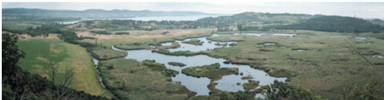
Kilátás a Külső-tóval, Balatonfüreddel és Tihannyal az Apáti-hegy tetejéről