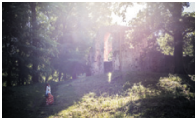
A pálos kolostor romjai Salföld közelében