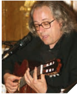
Kép - Wikimedia Commons