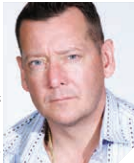
Kép - Pesti Magyar Színház

keveredtünk, a hajót méteres hullámok dobálták. Amikor partra sodródtunk, nekünk kellett a vitorlást visszatolni a vízbe: már másfél órája küszködtünk, amikor édesapámat is megkértük, másszon le a hajóról. De nem jött, hanem azt válaszolta: a kapitány nem hagyja el a süllyedő hajót!” A tónál ma is rengeteg időt töltenek. „A feleségem májustól októberig szinte végig a nyaralóban él, én meg a munkám miatt jövök-megyek. Hajózni nem nagyon van időm, de ha jönnek vendégek, akkor azért kivitorlázunk: elmegyünk a mély vízre, hogy ott ússzunk, de van, hogy Tihany és Sajkod felé is elkanyarodunk” – meséli. Van példa arra is, hogy nyaralójukba nagyobb társaság érkezik: tavaly például a Liszt Ferenc Zeneművészeti Egyetem zenetudományi szakán végzett tanítványai keresték fel, velük beszélgettek és játszottak egész nap. Mindig nagyon várják a gyerekeket is. „A lányom Berlinben él, neki két lánya van, kisebbik fiam Kanadában él: neki egy fia és egy lánya született. Legidősebb fiamnak most született kislánya Budapesten. A legnagyobb unokám most három és fél éves, vele lassan már jól lehet kommunikálni, de a többiek még nagyon picik. Nekik most kezd kinyílni a világ.”