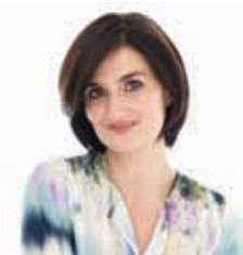
SZÁM KATI • BEKÖSZÖNTŐ

Részletek és foglalás legjobb áron honlapunkon!