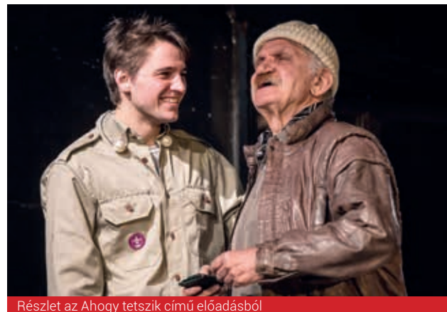
Részlet az Ahogy tetszik című előadásból