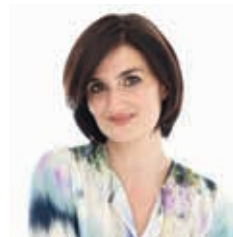
SZÁM KATI • BEKÖSZÖNTŐ

A Babakötvény forgalomba hozatalának és forgalmazásának általános feltételeit az aktuális Ismertető és a Nyilvános Ajánlattétel tartalmazza, mely megtekinthető a forgalmazó helyeken, illetve a www.allampapir.hu és a www.akk.hu honlapon. Infláció alatt értve az Ismertetőben és a Nyilvános Ajánlattételben meghatározott kamatbázist. A 2013. évi központi költségvetési törvényben a 2013. évben született gyermeket illető első utalási összeg. Jelen tájékoztatás a tőkepiacról szóló 2001. évi CXV. törvény vonatkozó rendelkezései alapján kereskedelmi kommunikációnak minősül, és nem tekinthető ajánlattételnek, teljes körű tájékoztatásnak, befektetési vagy adótanácsadásnak. A Kibocsátó felhívja a befektetők figyelmét, hogy a Babakötvény esetében sem zárhatóak ki teljeskörűen az infláció változásából eredő kockázatok, és valamennyi további befektetési kockázatot és lehetőséget a befektetőnek kell felmérnie.