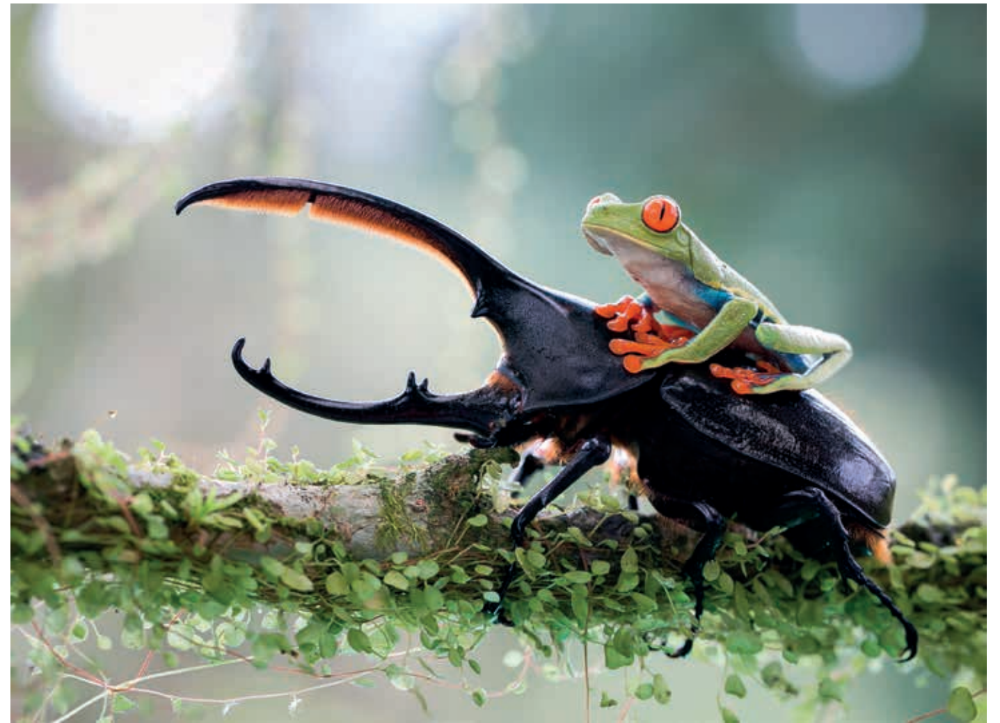
Nicolas Reusens Boden makrófotózásra szakosodott természetfotós, kedvenc terepe a trópusi esőerdők világa, főleg közép-amerikai országokban fényképez, ahová rendszeresen szervez workshopokat természetfotósoknak. Wwww.nicolasreusens.com .