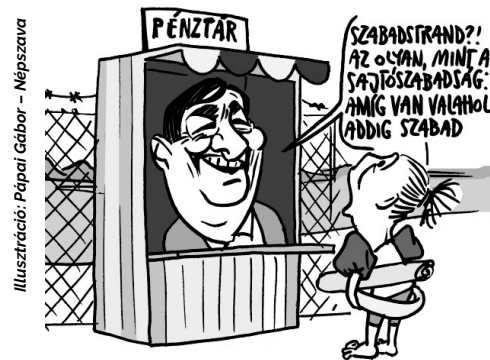
Illusztráció: Pápai Gábor - Népszava

Rohamosan csökken az ingyenes fürdőhelyek száma a Balatonnál, idén már csak 64 olyan partszakasz akad, ahol belépődíj nélkül lehet mártózni. A negyven, tóparttal rendelkező önkormányzat közül húsz egyáltalán nem biztosít ingyenes strandot.