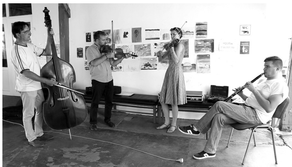
A Törköly zenekar céljai a névben rejlenek: jobbá tenni a hagyományok termőtalaját, és jókedvet hozni