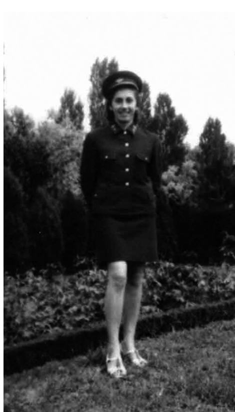
Élő példa, hogy az egyenruha nem csak a férfiakat öltözteti

– A modernizálás magával hozta a hanyatlást is, ami kezdetekben csak belső körökben volt érezhető. A gombnyomásra működő vezérlés