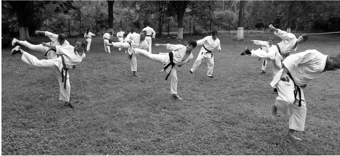
Több csoportban végezték a különböző gyakorlatokat a karatésok