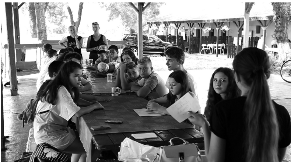
A tábor vezető négy felnőtt közösen alakította a formális és nem formális programokat

A nyelvtábor egyik napja különleges élményt tartogatott a táborozók számára: egy napos kirándulást tehettek Bihar megye központjába, Nagyváradra. Ez alkalomból Pásztor Sándor, a Bihar Megyei Tanács elnöke fogadta az ifjú látogatókat a tanács épületének dísztermében, és köszöntő beszéde után kisebb figyelemmel ajándékozta meg az őket. A megyei tanács elnöke elmondta, a tábor fontosságát abban látja, hogy a gyerekek