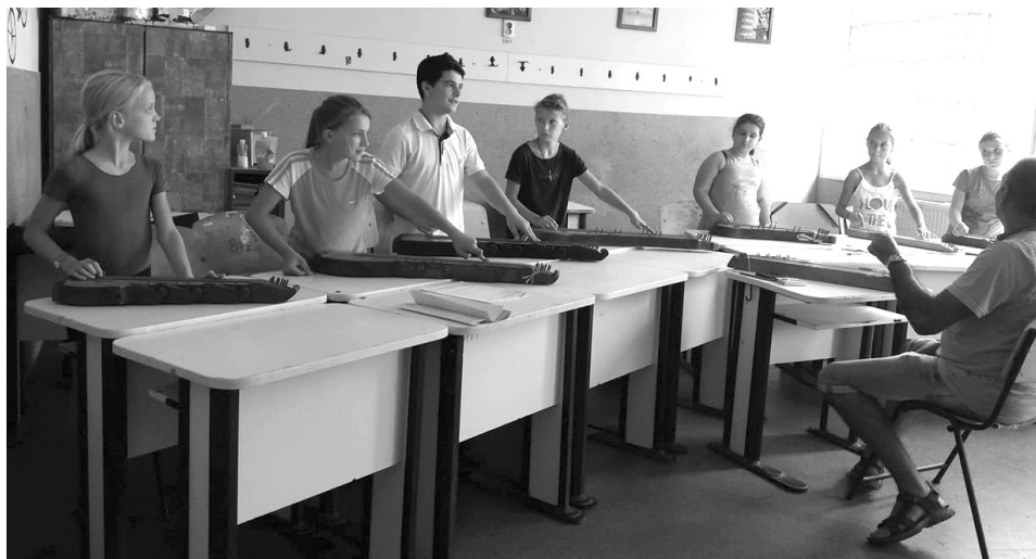
Az idei tábor citeraórái egy felnőttegyüttes kialakulását helyezték kilátásba

... énekelték a III. Érmelléki Népművészeti Tábor kiscsi résztvevői. Tényleg nem kellett messzire mennie annak, akinek felkeltette a kíváncsiságát az augusztus végén a Gyermek Jézus Szabadidő- és Sportközpontban megtartott tábor plakátja. Idén a hangsúlyt a néptánc- és citeraoktatásra helyezték a szervezők. A négy napos rendezvény alatt a néptánc iránt érdeklődők két korosztályban vehettek részt a foglalkozásokon, míg a citeraoktatás hat-nyolcfős csoportokban zajlott.