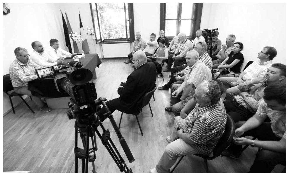
Főként a turisztikailag jelentős településeket képviselték (Szalacs, Szentjobb, Székelyhíd)