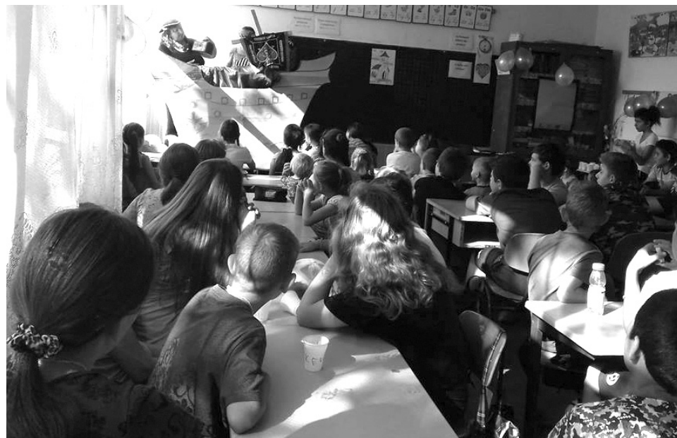
Nincs az a kicsi hely, ahová egy kalózhajó ne férne be, ha a Biblia tolmácsolásáról van szó

„Pénzt vagy örök életet!” – ezzel a címmel szervezték meg a július harmadik hetében a Vakációs bibliahetet a hegyközszentmiklósi iskolában. A rendezvény Királyhágómelléki Református Egyházkerület idei nyári gyermekmissziós heti programja alapján zajlott.