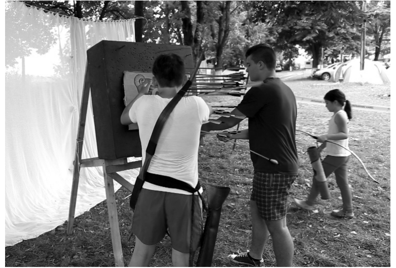
A lövés előtti bátorítás, de a nyilak összeszedése is közös feladat

Körülbelül harminc kisebb-nagyobb sportoló fiatal vett részt a Phoenix Sportegyesület szokásos nyári karate- és íjásztáborában, amelyet a hegyközszentmiklósi strandon rendeztek július 30-a és augusztus 4-e között.