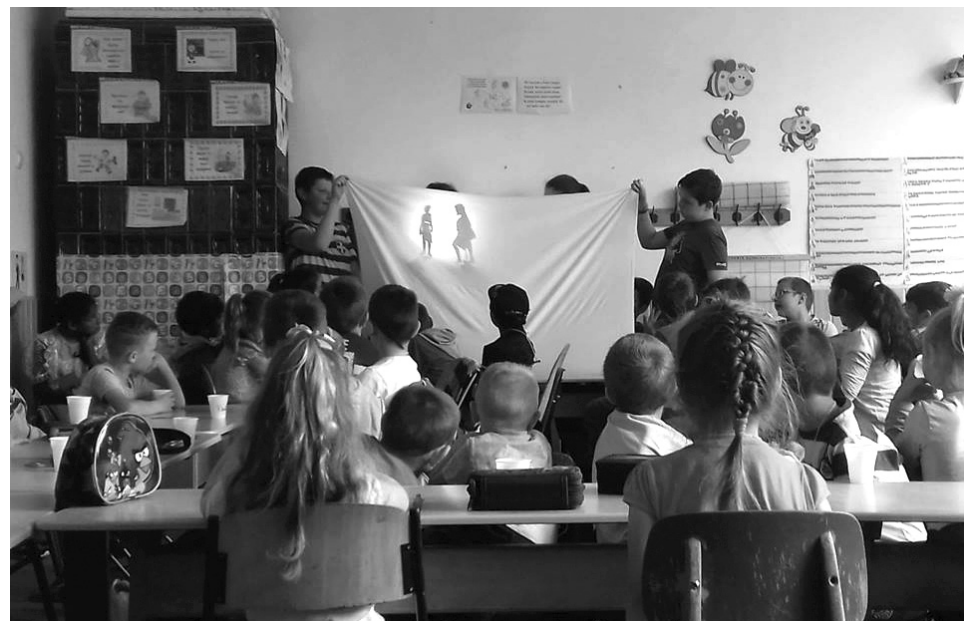
A gyerekek a táborban az árnyjáték módszerét is elsajátították