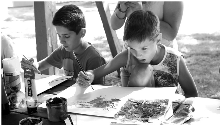
Papírra nyomott foltok és vonalak mutatták a fantázia útját

Besegítő szervezőként személyesen is része lehettem a tábor nyüzsgő életének. Sok év alatt kikristályosodott egy napirend, illetve táborrend: mindig jókedvű tornával indul a nap, ezt követi a csoportbontás, ami csak annyit jelent, hogy mindenki mással kezd, azután előbb-utóbb minden tevékenység