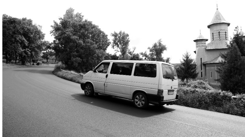
A felsővárosra vezető dombot régebben macskakő borította