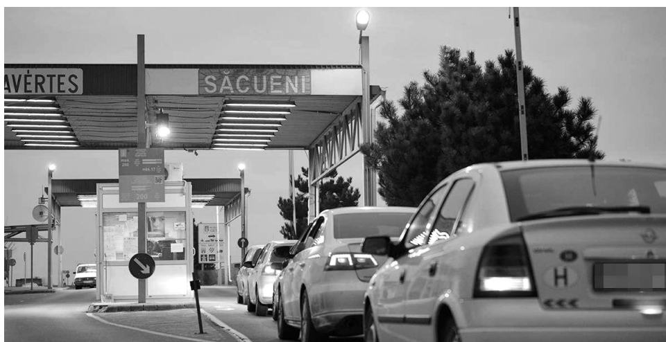
A hosszabb nyitvatartás a sokszor kilométeres sorok feltorlódását is enyhíthetné