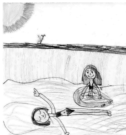
Molnár Noémi (I. SBS o.)