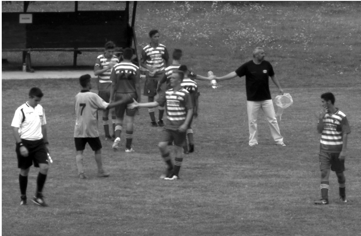
Lesz ez még jobb is! Megszületett az első győzelem, bizakodóak a fiúk

Legutolsó bejelentkezésünk óta – a Törekvés által elvesztett osztályozó mérkőzés után – jó néhány fordulatot éltünk meg. Már akkor úgy búcsúzott tőlünk a Bihar megyei labdarúgó-szövetség, hogy nagy esélyünk van arra, hogy vereség ide vagy oda, mégis feljussunk a negyedosztályba. Ehhez „mindössze” annyi kell, hogy valamelyik csapat ne tudja vállalni az indulást és máris szabad az út. Majd lassan elcsendesedtek a kedélyek, a beiratkozási időt is meghosszabbították, mi pedig továbbra is lebegtünk a két osztály között. Végül pedig jött a hír – mindössze két héttel a bajnokság rajta előtt –, hogy a magát Bihar FC-vel hasonlítható Nagyvárad