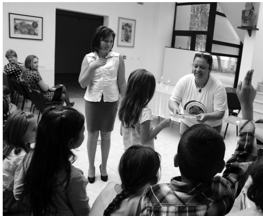
A tanító nőikkel érkezett gyermekek mesekönyvet is kaptak ajándékba Sándor Kata közgazdász írónőtől

Közgazdasági mesekönyvet mutatott be Sándor Kata közgazdász, író, az Erdők Uniója Alapítvány képviselője városunkban. Az eseményre többtucat második osztályos gyerek és több tanító volt hivatalos szeptember közepén a székelyhídi múzeumba. A könyvbemutató igazán temperamentumosan nyitotta kapuit ami talán annak is köszönhető volt, hogy Sándor Kata író, igazán fiatalosan és energikusan valamint meglepően közvetlenül vezényelte le. Az író közgazdászként is dolgozik, ezért is a mesekönyvben lévő mesék alapmondanivalója a valós életben történő közgazdasági problémákról, illetve helyzetekről tanítja olvasóit. A mesekönyv mondanivalójának és tanulságának könnyebb megragadása céljából társul hozzá egy színezőkönyv is. Ezeket a könyvbemutató után ingyenes csomagban vehették át a gyerekek, illetve tanítók zsírkrétával társítva.