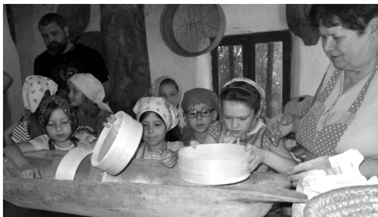
Süssünk, süssünk valamit (bifarfélegybázi tájbáz, I. és II. SBS o.)