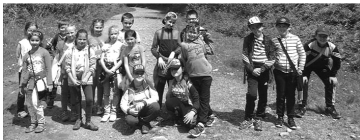
A fenyves árnýékában (Bibarfűred, III. SBS o.)