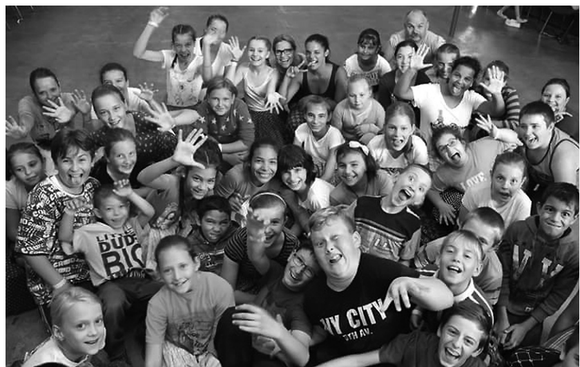
Tombol jökedu: mindenki jól értezte magát a népművészeti táborban