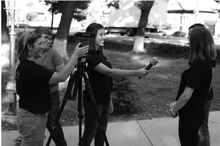
A fiatalok lelkesen próbálgatják az interjúkészítést