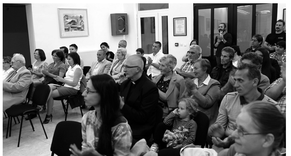
Családtagjaik, barátaik kíséretében érkeztek a kötetben megszólalók az eseményre