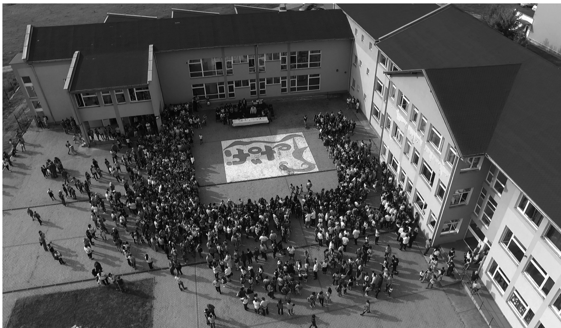
Az iskola udvarán zajlott székelyhídi tanévnitőn összesereglettek a vakációról visszatérő nebulók

A nagyobb létszámú iskolákhoz képest családis hangulatban telt az érolási elemi iskola nyitóünnepsége. Mészáros Me-