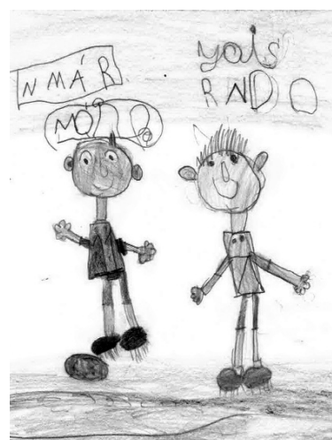
Szilágyi Márk (I. SBS o.)