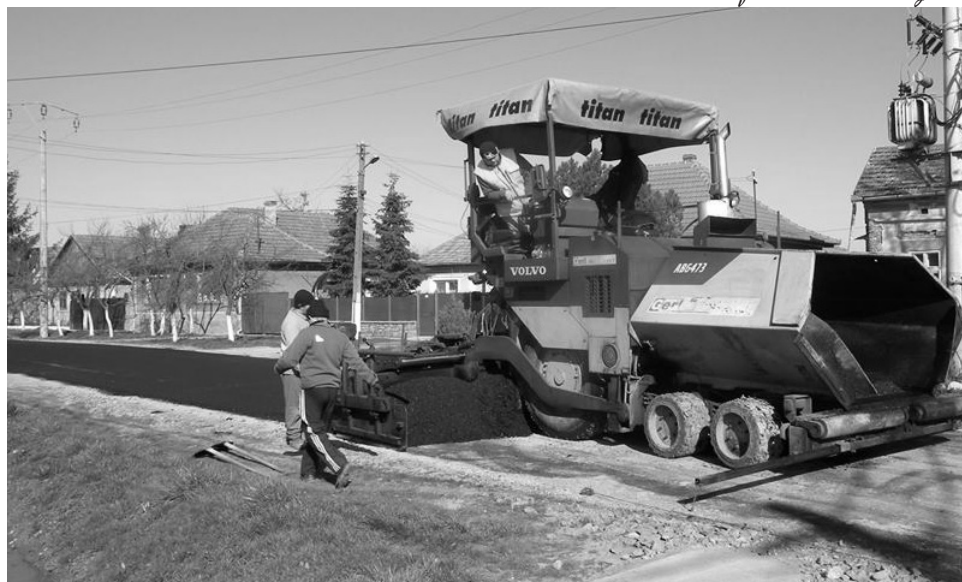
Az aszfaltozással Szék városrész lakóinak régi vágya teljesül

Polgármesterként igyekeztem a lehető legszorosabb kapcsolatot ápolni a lakossággal, amennyire csak időm engedte, a fogadóórákon kívül is meghallgattam mindenkinek a panaszát és kollégáimmal együtt igyekeztünk segítséget nyújtani