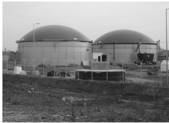
Nemsokára átadják a biomassza-erőművet

Érköbölkúton sikerült befejezni a lakodalmasházat. Ez egy nagyon fontos megvalósítás volt ezen a településen, hisz éveken keresztül nem volt hol tartásuk az efféle családi eseményeket, ünnepségeket. Elkészült az érolasi közösségi ház építési terve és folyamatban van a kivitelezés megkezdése. Csokalyon sikerült ivóvízvezetést fűmni, amiből a lakosok már hordják a tiszta, jó minőségű ivóvizet. Jelen pillanatban Nagykágyán folynak hasonló munkálatok. Nem maradhat ki a felsorolásból, hogy sikerült aszfaltozzunk Hegyközszentmiklóson és Nagykágyán is. Ezek mind-mind olyan projektek, amelyek kicsi apró lépéssel, de gazdagabbá és szebbé tették a székelyhídiakat és a hozzá kapcsolt településeken élők életét, életkörülményeit, mindennapjait.