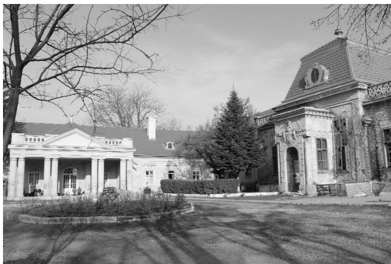
A Stubenbergekastély megmenekült az enyészettől

Bihar megyei RMDSZ stratégiájában is szerepel egy olyan terv, hogy kialakítsunk egy érmelléki brandet, mint ahogy Székelyföldön a székely termékeknek van. Annyira tudatosok kell legyünk, hogy ha van Érkeserűben egy víztöltő állomás, akkor annak a vizét fogyasszuk, ha például Szentjobbon vagy Szentimrén