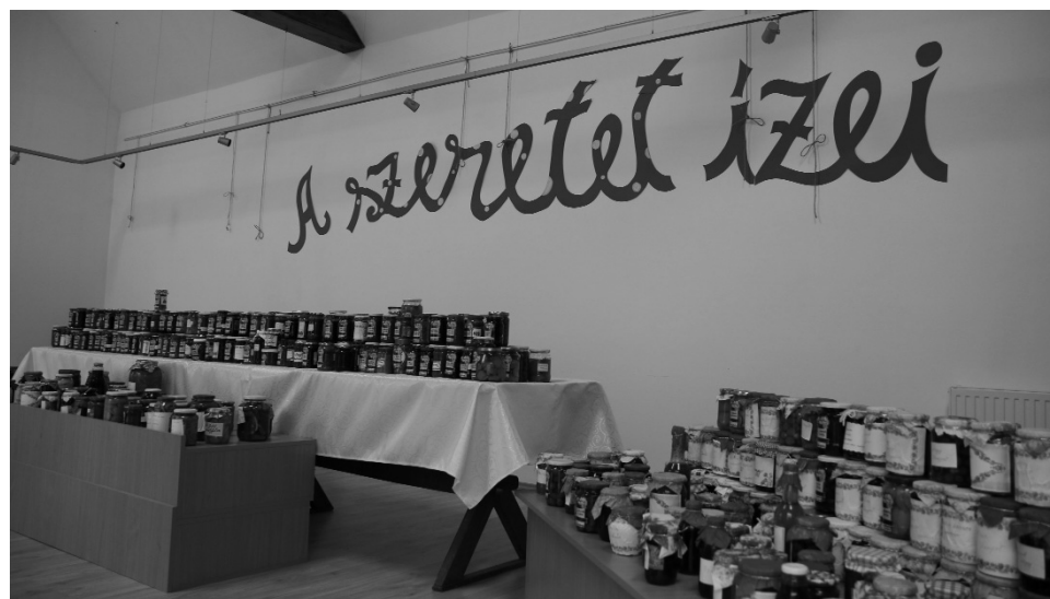
A gazdanapon gyűjtött szeretet ízei a megye gyermekotthonainak lakóihoz jutottak el

Nagy reményekkel indultunk a tavalyi évről, aztán valahogy úgy gondoltuk, ha csak a felét meg tudjuk valósítani, akkor is örülni fogunk. Épp ott tartunk, hogy az