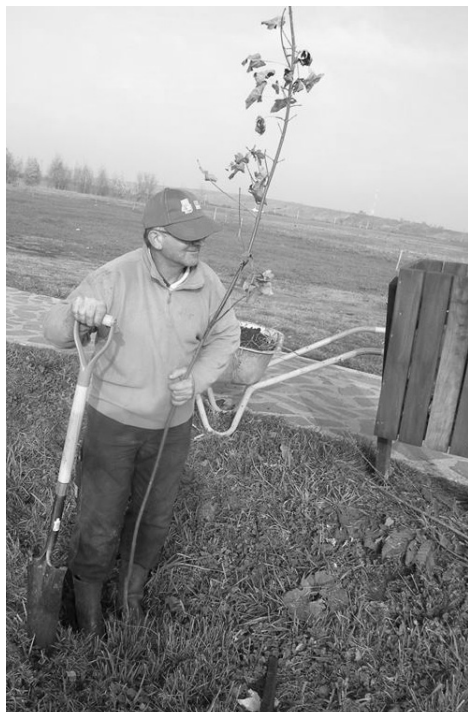
Pótolják a csemetéket a városi parkban

Megszerveztünk számos több éve futó, hagyományos kulturális programot: magyar kultúra napi jótékonysági bált, Érmelléki borversenyt, Székelyhídi Városnapokat, az Érmelléki Ősz rendezvényeit, kórustalálkozókat. Emlékeztünk nagy költőinkre, megünnepeltük nemzeti ünnepeinket. A Petőfi Sándor Elméleti Líceummal,