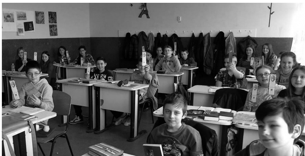
Az olvasómaratonon részt vevő diákok könyvjelzőket kaptak