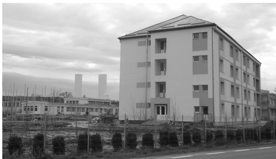
Majdnem teljesen kész a nagykágyai szakközépiskola kollégiuma

Aszfaltoztunk a Szíkon és a Házhelyen, a központban a közeljövőben fogunk. Régi adósságot próbálunk ezzel törleszteni, hiszen erre ígéretet tettünk a falugyűlések során. Az az igazság, hogy a nagykágyai iskola felújítása minden önkormányzati erőforrást felemésztett, emiatt nem tudtunk a tervezett ütemben haladni vele, de dolgozunk rajta, hogy minél hamarabb be tudjuk fejezni a munkálatokat.