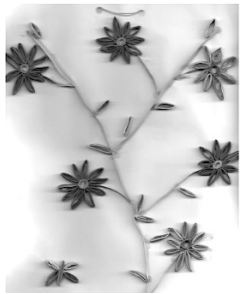
Dienes Fruzsina, IV. B o. (Székelyhíd)