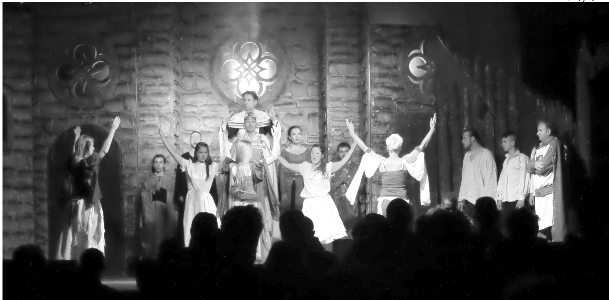
A városnapok vasárnap esti fénypontját jelentette az István, a király című rockopera a nyíregyházi Mandala Dalszínház előadásában

Bár az I. Székelyhídi Városnapok megszervezése rendkívül vegyes véleményeket generált a lakosság körében, és többen fájlalták az Érmelléki Ősz „meg-