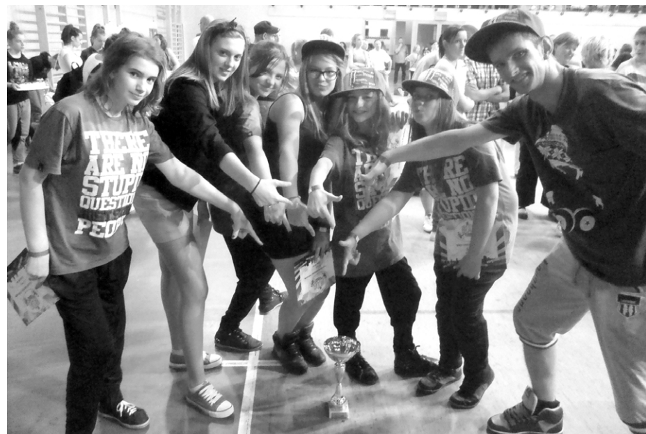
Az elnyert kupára mutatnak táncosaink a sikeres fellépés után