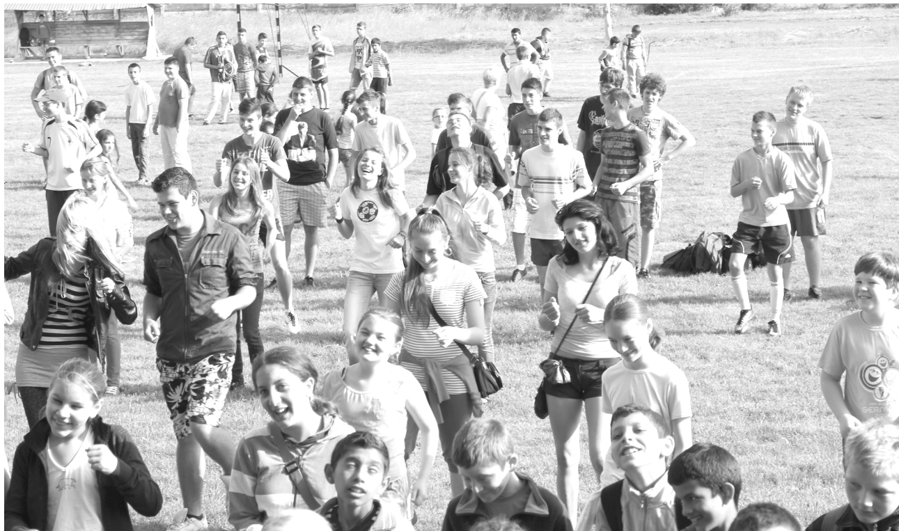
Reggeli torna kicsiknek és nagyoknak