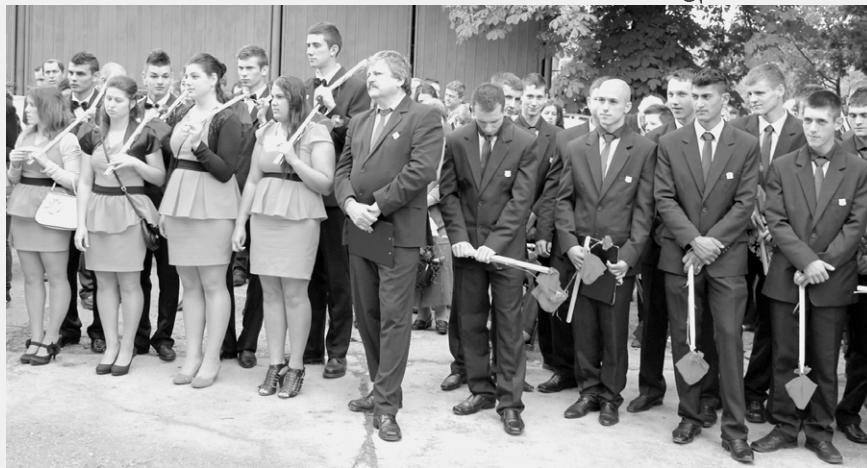
Búcsút vettek iskolájuktól a nagykányai végzősök

tették a virágokat, ők díszítették ünnepelőbe az iskolát, idén viszont már nekik szólt a virágtenger és a ballagási ének. Az egyik végzős beszédében külön ki is emelte: „megtanítottak minden szépre, jóra, de egyvalamire nem tanítottak meg, a búcsúzóra.”