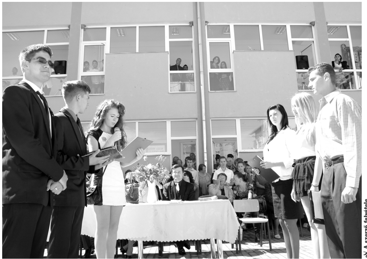
Stafétaátadás: a végzősök képviselői a tizenegyedikesekre bízta az iskola szimbolikus kulcsát