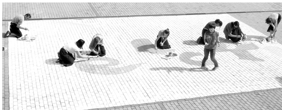
Készítik az iskola címerét az udvaron