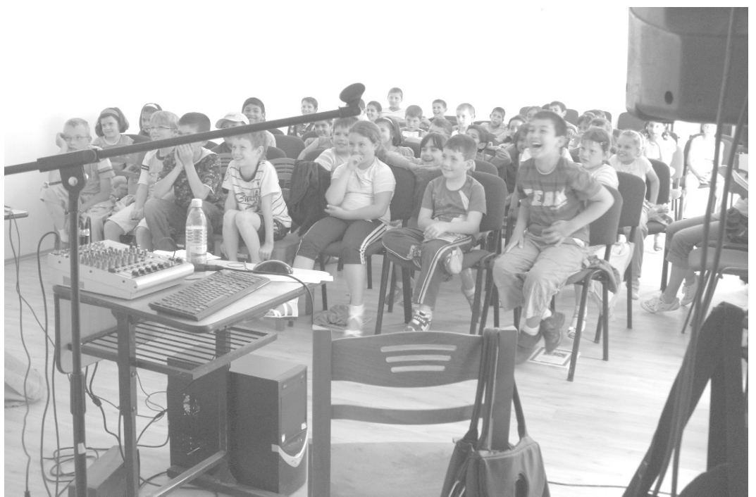
Népszerű volt a moziteremmé varázsolt kiállítóterem