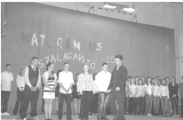
A műsorban többek között szavalatokkal...