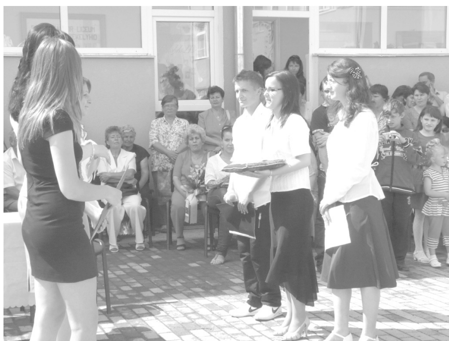
Jelképes kulcsátadás a XI. osztályosoknak