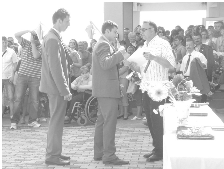
A díjazott kézilabdázók