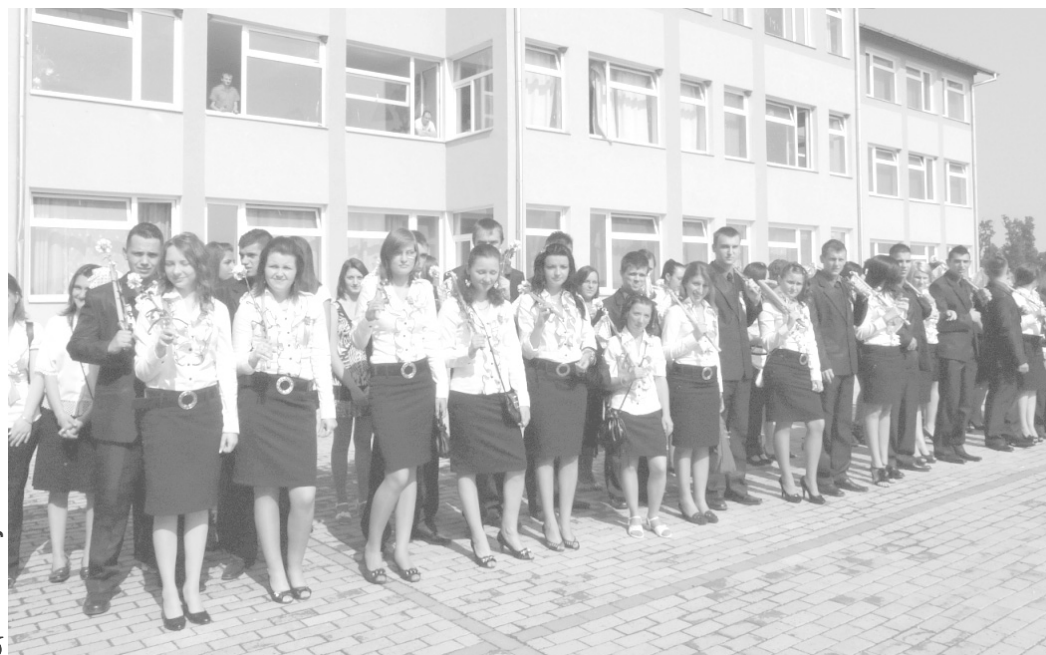
A XII. C osztályos ballagók