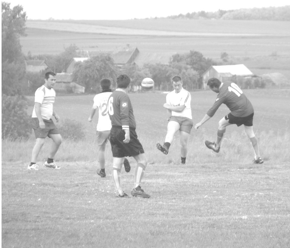
A foci összekapcsolja a generációkat a településen