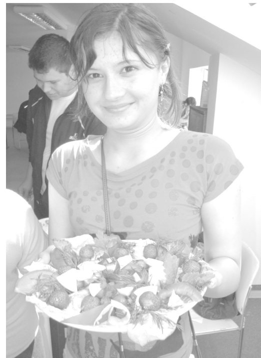
Étvágygerjesztő a salátakészítő verseny kínálat