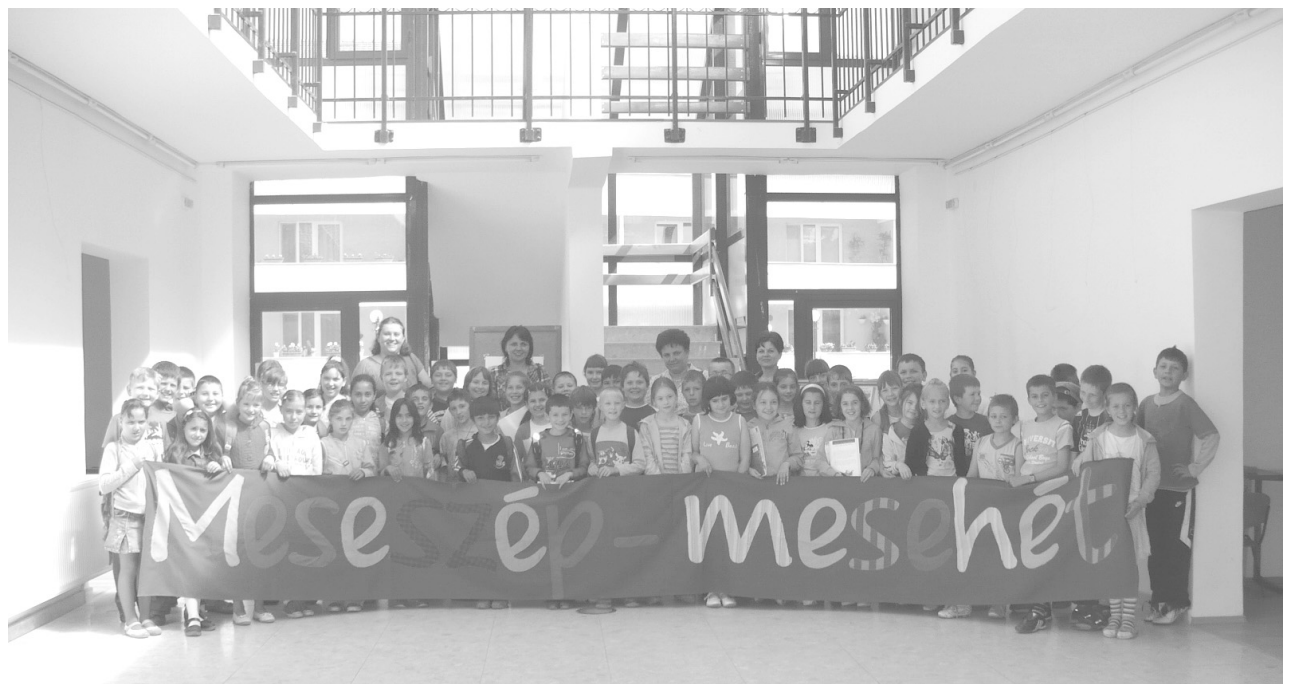
Csalóka csoportkép a rendezvényen részt vevő kicsik egy részével