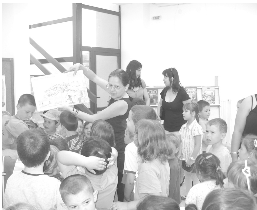
Ki tudja, mi az?