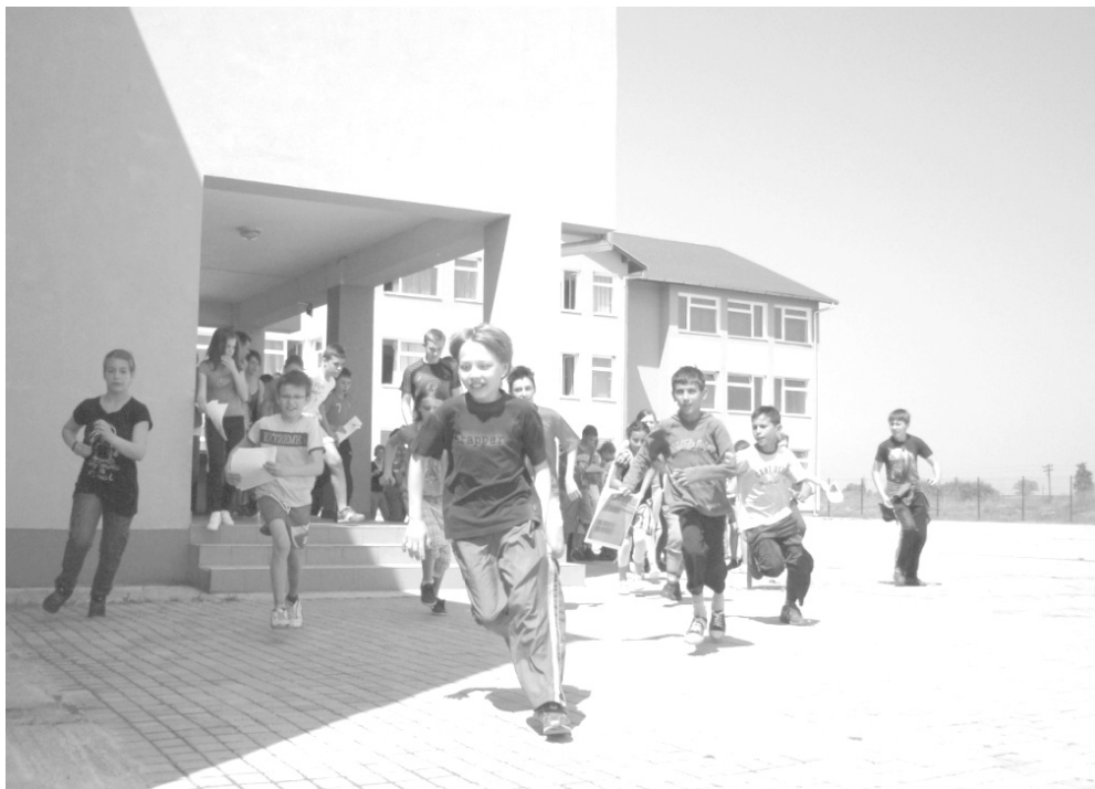
Most indult a City Tour