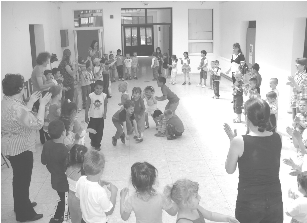
Dalolva játszunk a múzeum épületében