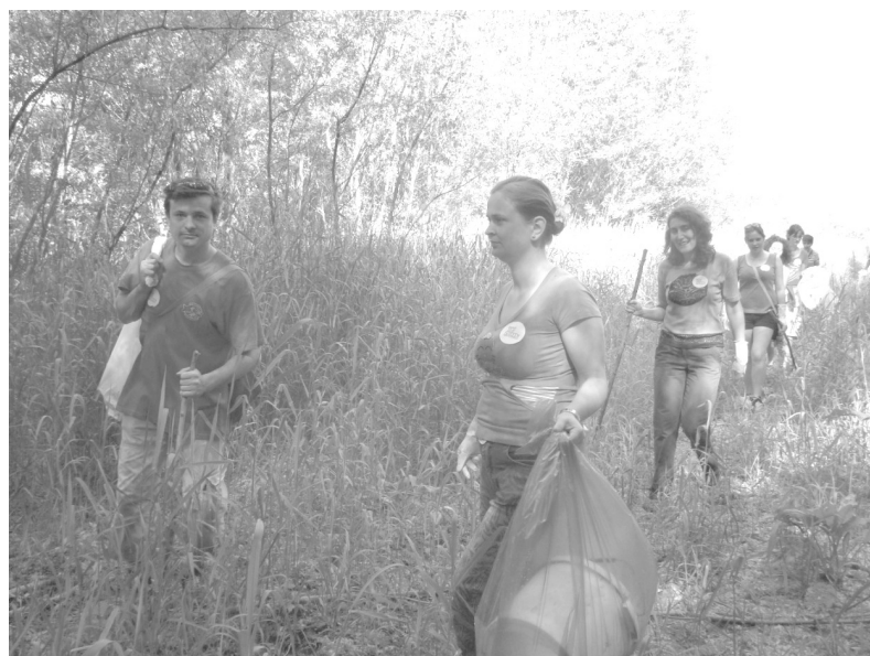
A Te szedd! program székelyhídi résztvevői a Tisza-part takarításánál

Mi a találkozó és az egész Közös Ügyünk üzenete? Ugyanaz, mint eddig volt: védj a környezetet, ne bánts a folyót, mert a vízre unokáinknak is szüksége lesz!