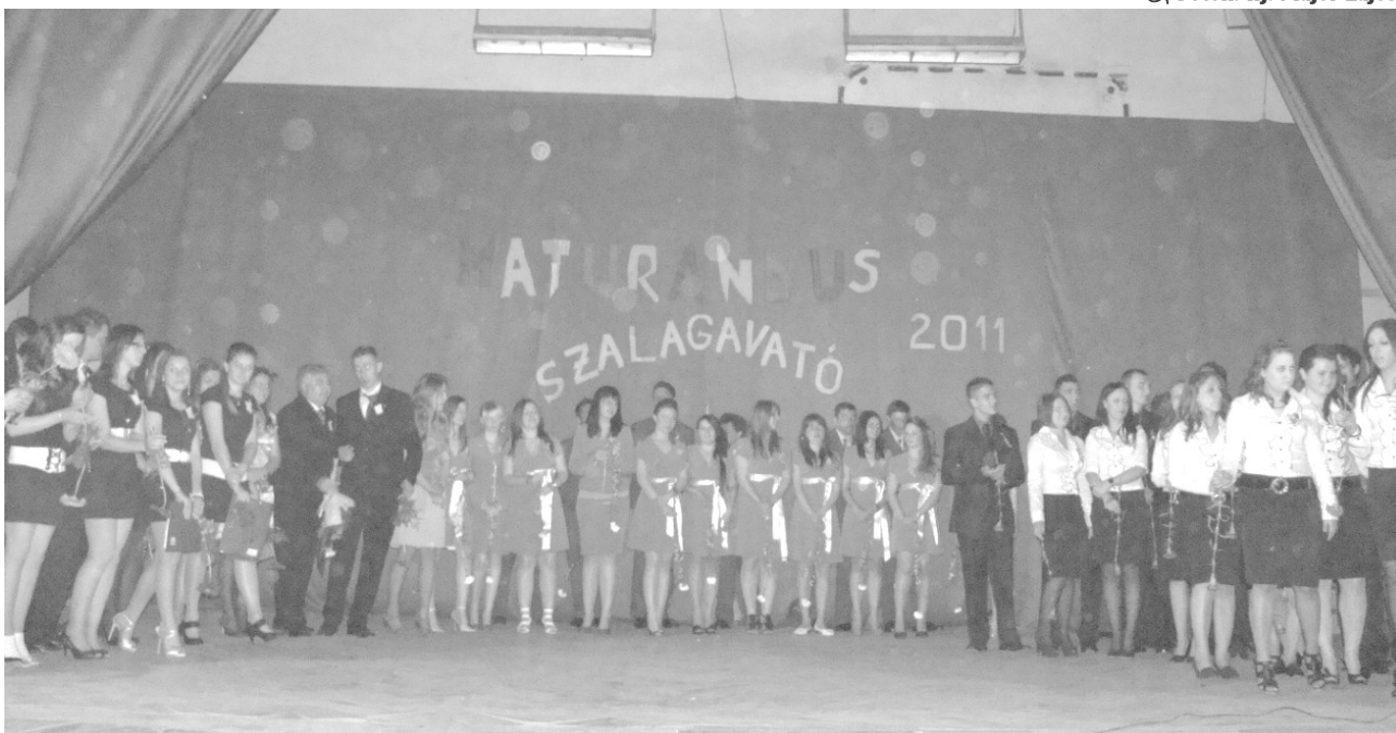
Kítűzőt és virágot kaptak ajándékba a nagykorúsítottak

Következő műsorszámként a XI. C mutatta be Mocsárvári gondok címmel előadásukat. E jelenetből meg-