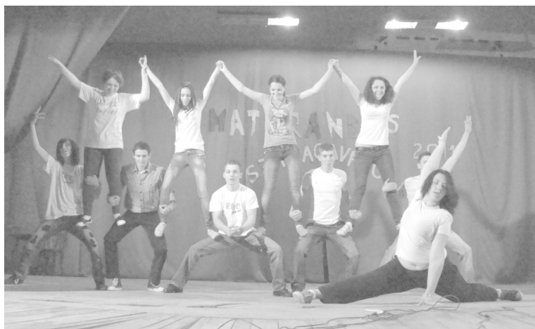
... és sok-sok táncal köszöntötték a XII. osztályosokat