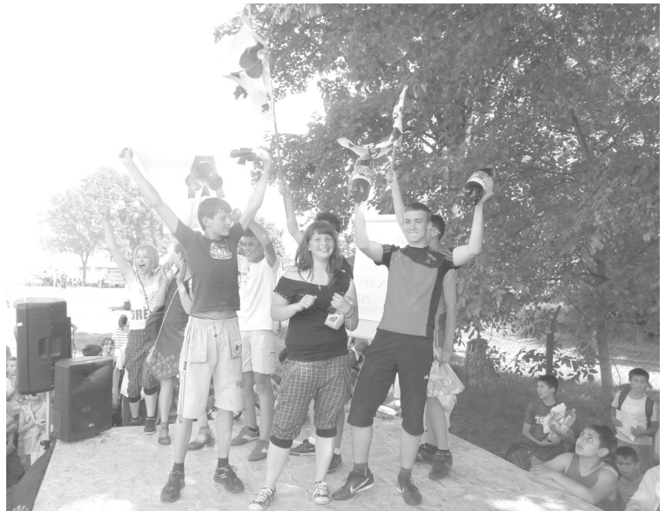
Részváltak a nevükre: a verseny végén ismét az Ászok lettek az ászok

Azok sem unatkoztak ám, akik nem kívántak részt venni a 7próbában, ugyanis számtalan program várta az érdeklődőket ezen kívül is, például: kerékpáros ügyességi verseny, bográcsfőzés, fodrászverseny, számítógépes és kulturális vetélkedő, fotó és filmvetítés, lovasbemutató, favágó bemutató, tánc- és zenei előadások, tombolasorsolások, karaoke, stb. Színes volt a választék, úgy vélem. Köszönet érte első sorban a szervezőknek, továbbá a Scola Nostra Egyesületnek, a Communitas Alapítványnak és a többi támogatóknak.