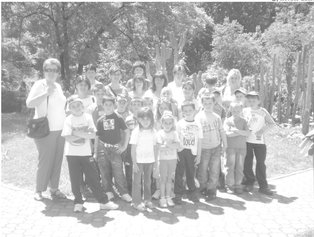
A kirándulók a kolozsvári botanikus kert növényei között

Friss vízzel töltöttük meg üres palackjainkat a Sebes Körös forrásánál, pénzt költöt-