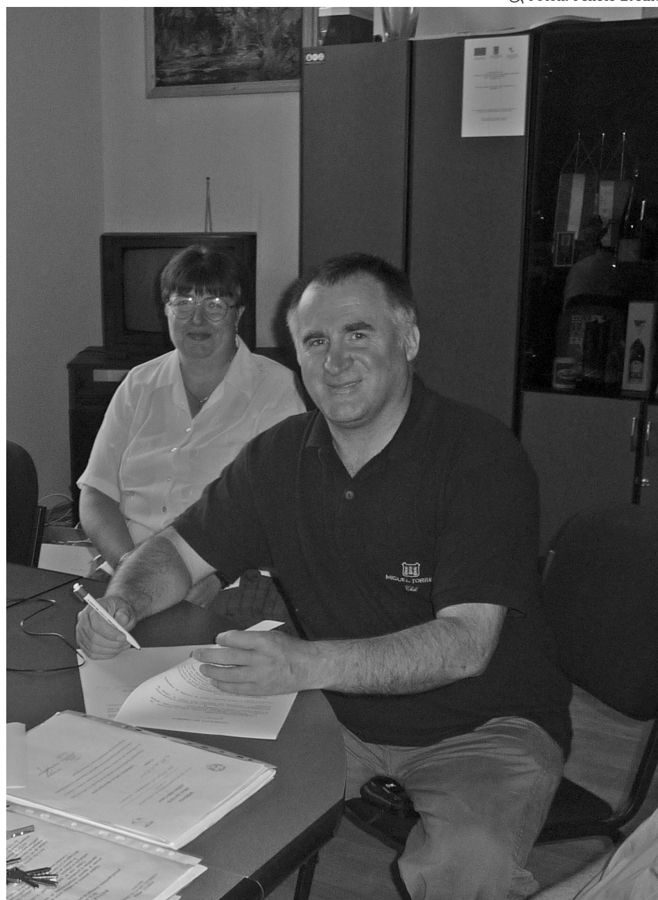
„A gyerek rám néz, és ha az én szemem tükrében azt látja, hogy te aranyos vagy, ügyes vagy, szép vagy, egyszerűen a gyerek annak érzi magát”

hogy engem meg a püspök hajt el. Aztán el is küldtem a néni; mondtam, hogy nekem misézniem kell, ha akar, üljön le a templomban, imádkozzon, kérje a Szentlelket, hogy mutassa meg az utat, hogy mit csináljon a gyerekekkel. Megrázó volt, a mise elkezdődött, én olvastam az evangéliumot, minden napra megvan a megfelelő textus, és aznapra az a rész volt, hogy „aki egyet is a legkisebbekből befogad, az engem fogad be”. Akkor úgy éreztem, hogy a mennyi Atya megkért, hogy fogadjam be ezt a kislányt. Ezért mondom azt, hogy nem én kerestem ezt a feladatot, hanem a feladat keresett engem.