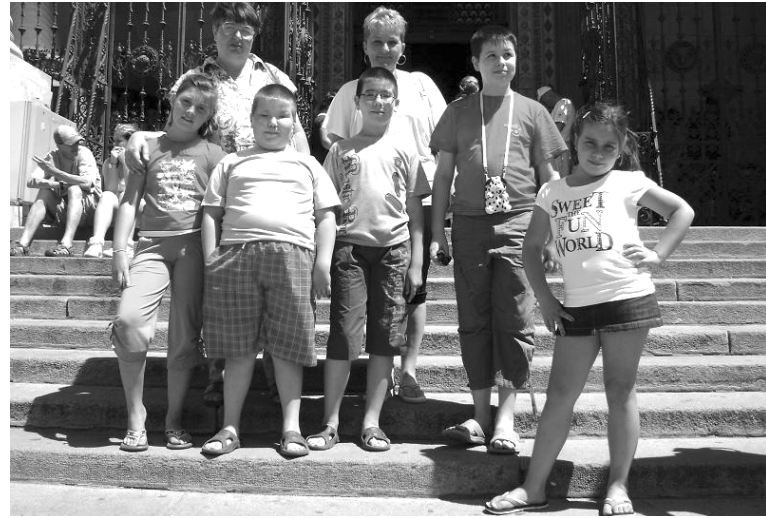
A székelyhídi csoport a budapesti Szent István-bazilika előtt

szönni a Szent Ferenc-alapítvány hála csapata az RMDSZ által gyűjtött pénzüsszeget, amiből a kirándulások költségeit fedezni tudták.