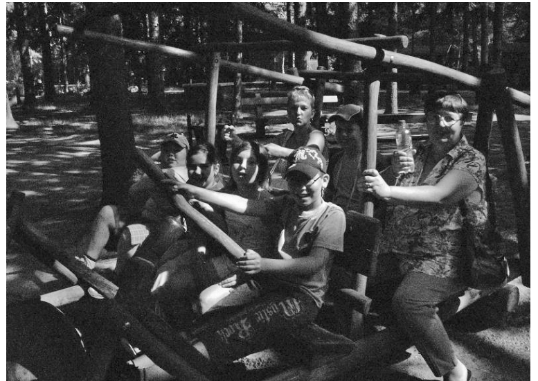
A gyerekek a debreceni állatkertben szórakoznak

Míg az alapítvány többi lakója magyarországi táborokba vagy nevelőszülőkhöz indult, addig a székelyhídi kis csapat Debrecenbe tartott, hogy felfedezze az állatkert rejtelmét. A felejthetetlen élmények után, jól elfáradva elindultak haza, ahol újabb kirándulás várta őket. Ezúttal a kicsiket Nagyváradra vitték: az állatkertbe, játszótérre, városnézésre, népművészeti kiállításra valamint kutyakiállításra. Felkészültek bevásárlással a következő héten rendezett református bibliahétre, ahol ők is hozzájárultak az étkeztetéshez. A bibliahéten minden gyerek részt vehetett, felekezettől függetlenül. Végül július utolsó hetében újból kirándulást szerveztek Zsibóra azokkal a gyerekekkel, akik az említett kirándulásokon nem vettek részt. Ezúton is szeretné megkö-