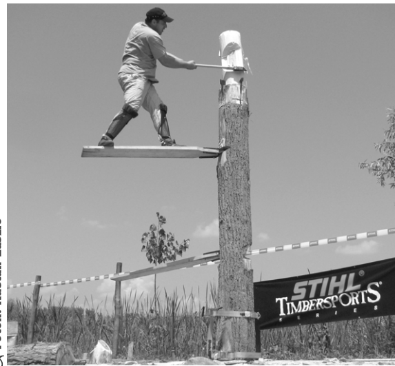
✂ Fotók: Kustán László