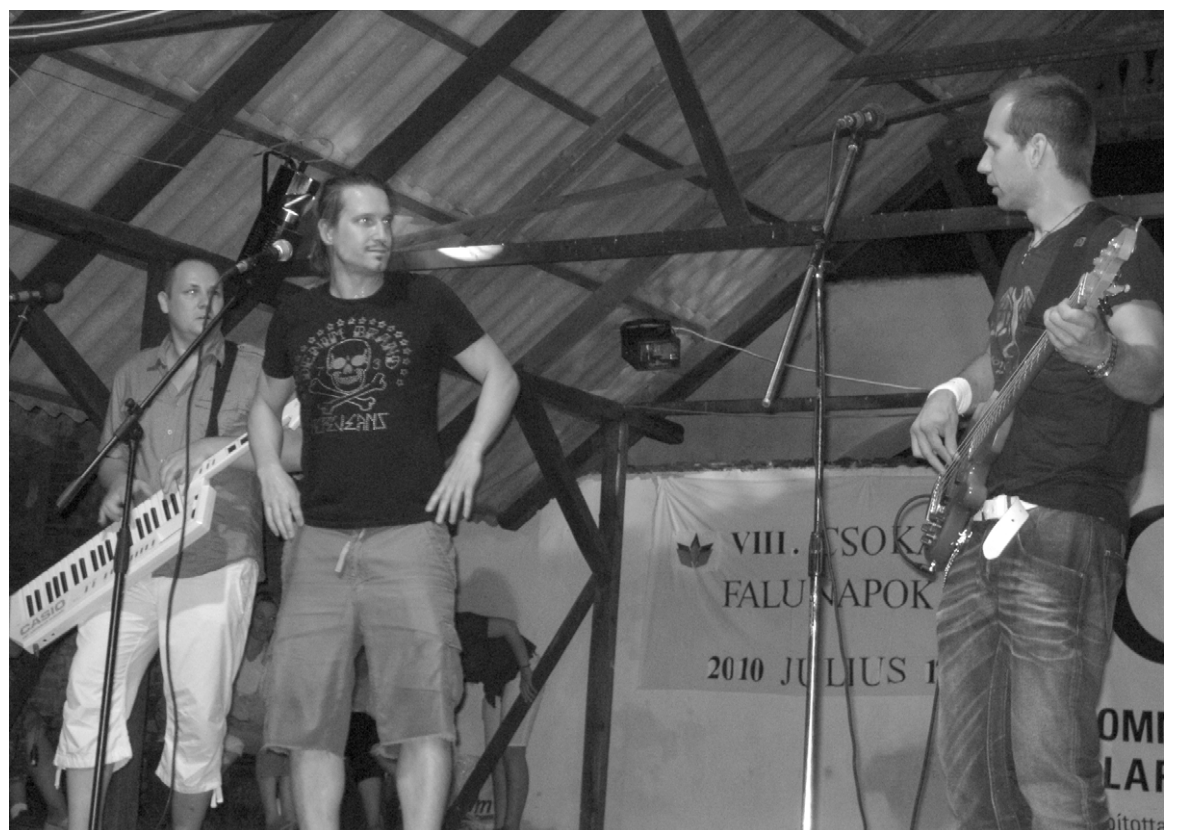
Színpadon a magyarországi United együttes