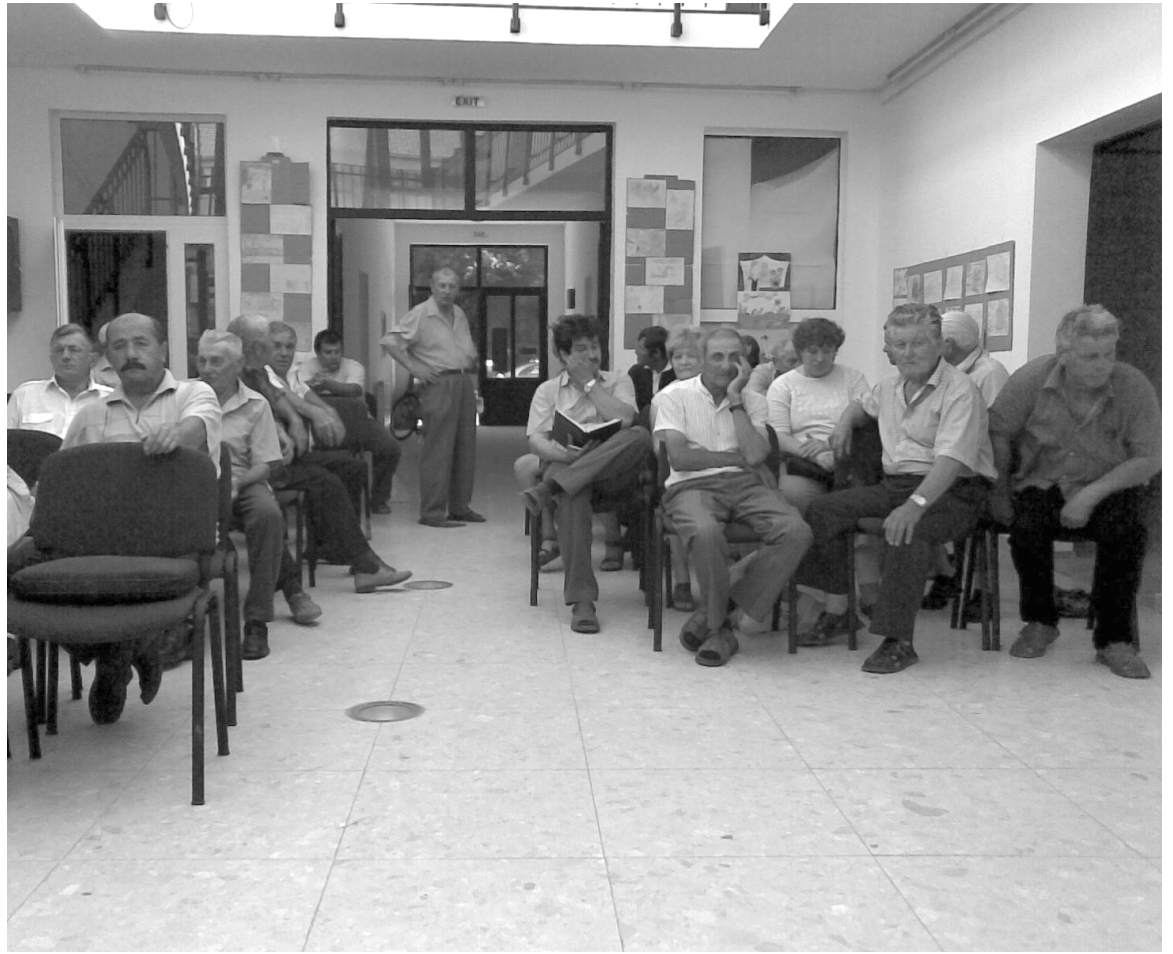
A városi múzeum épületében összegyűlt érdekeltek számos kérdést tettek fel az erdészeti szakembereknek