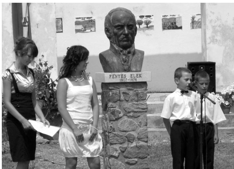
Diákszavlatok a Fényes Elek Emlékparkban tartott ünnepségen