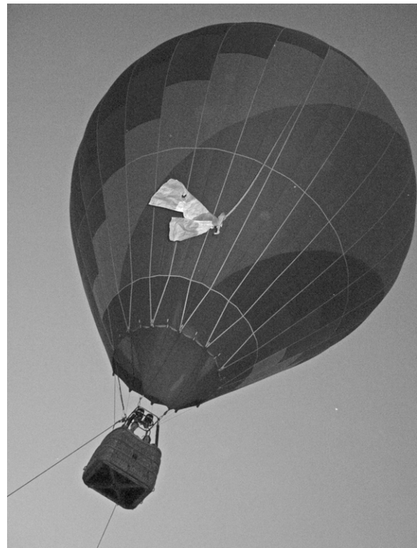
Idén is sokan kémlelték a tájat a hőlégballonnal

A csokalyi ünneplőknek délután az időjárás is kedvezett, a meteorológus-