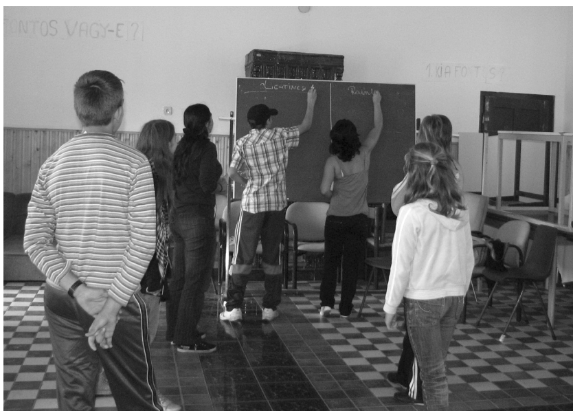
Játékosan könnyebben megy az angol nyelv tanulása