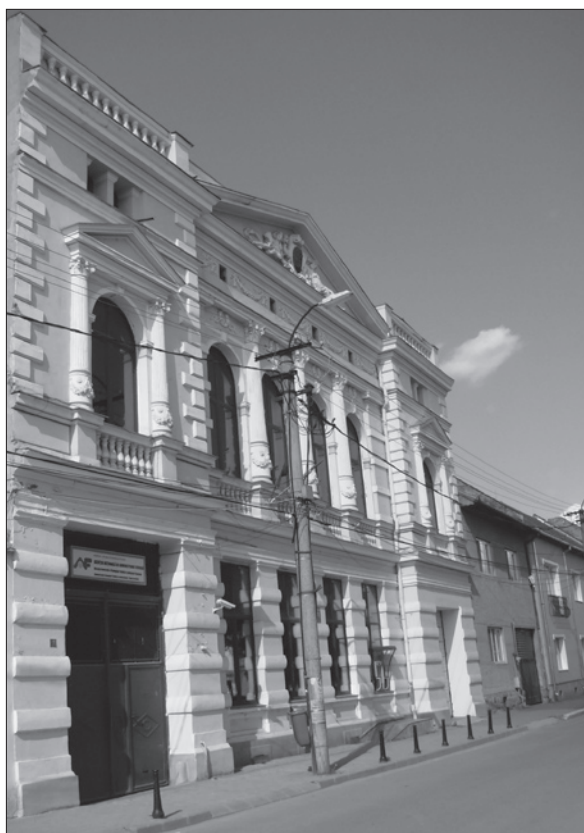
4. ábra Az egykori Takarékpénztár, ma Román Állami Kincstár épülete. A szerző felvétele (2011)