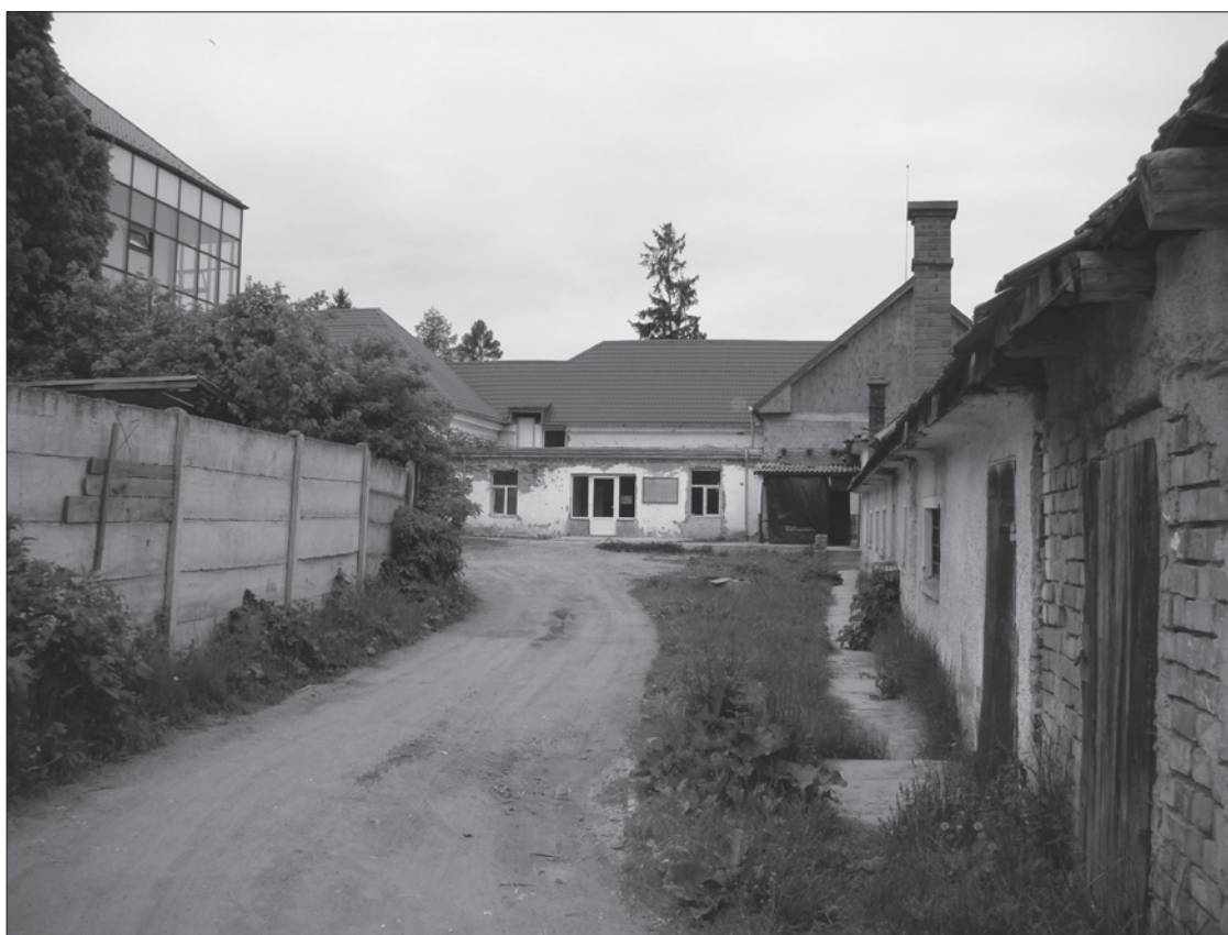
2. ábra Az egykori Takarékpénztár, ma Román Állami Kincstár udvara. A szerző felvétele (2011)