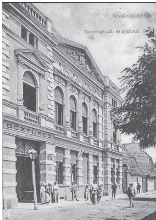
3. ábra Takarékpénztár és gőzfürdő 1909-ben. A képslap a Székely Nemzeti Múzeum tulajdona