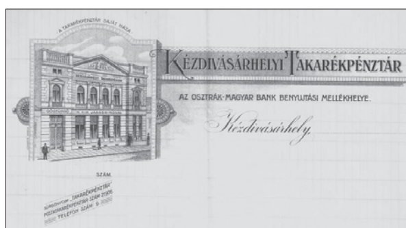
5. ábra A kézdivásárhelyi Takarékpénztár aprónyomtatványa