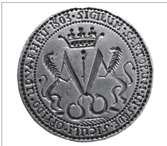
10. ábra Székelyudvarhelyi szabó céh pecsétnyomója