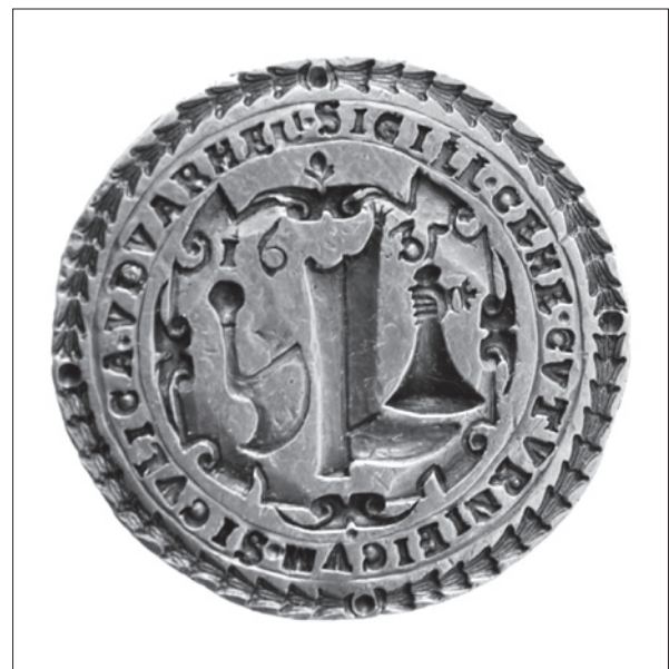
6. ábra Székelyudvarhelyi csizmadia céh pecsétnyomója