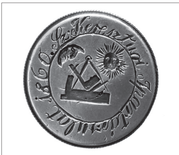
19. ábra Székelykeresztúri II. Ipartársulat pecsétnyomója