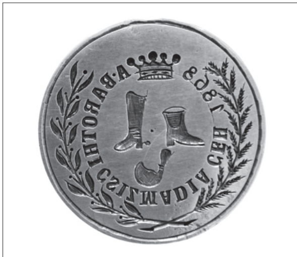
15. ábra Baróti csizmadiák pecsétnyomója.