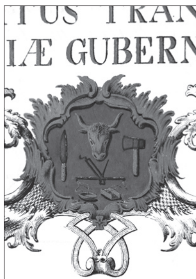
21. ábra Székelyudvarhelyi mészáros címer az 1809. évi céhszabályzaton