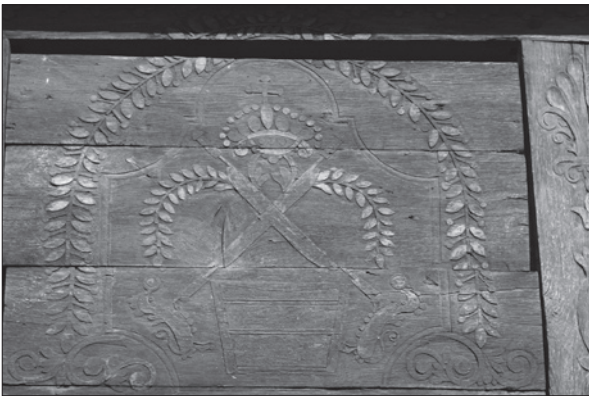
1. ábra Tímár címer egy szejkefürdői székely kapu tükrében