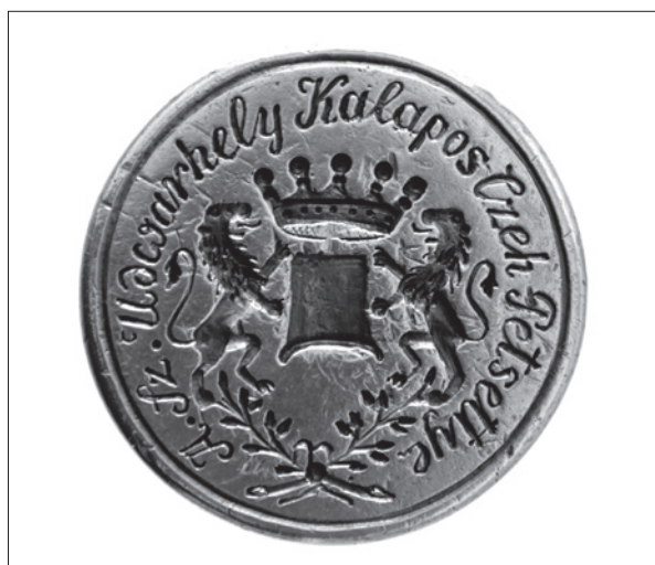
9. ábra Székelyudvarhelyi kalapos céh pecsétnyomója