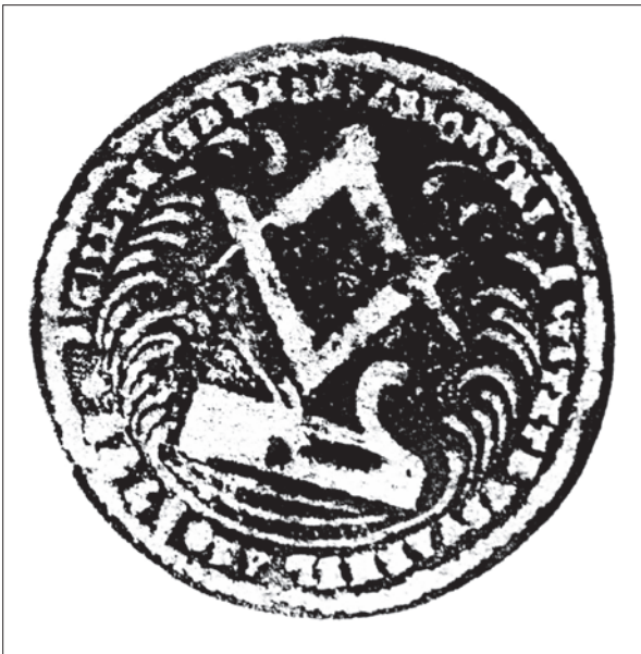
3. ábra Székelyudvarhelyi asztalos céh pecsétnyomójának lenyomata