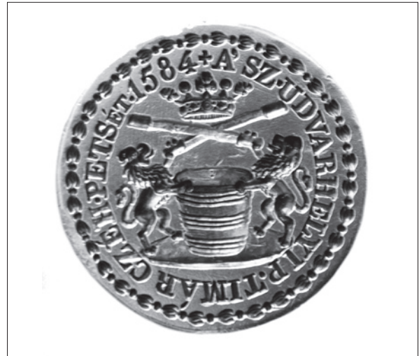
14. ábra Székelyudvarhelyi tímár céh pecsétnyomója