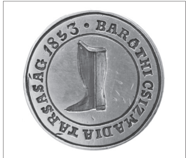
16. ábra Baróti csizmadiák pecsétnyomója