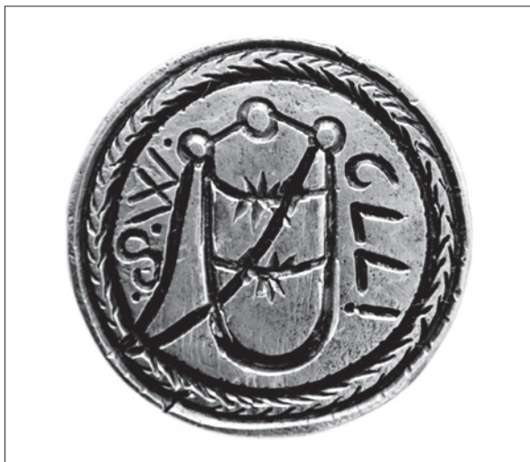
12. ábra Székelyudvarhelyi szíjgyártó céh vagy mester pecsétnyomója.