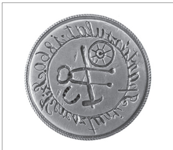
20. ábra Székelykeresztúri II. Ipartársulat pecsétnyomója