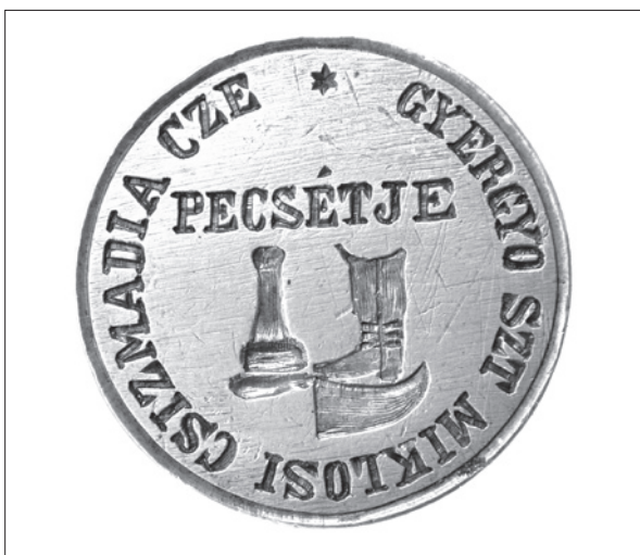
17. ábra Gyergyószentmiklósi csizmadiák pecsétnyomója