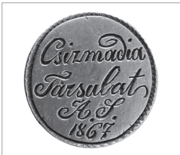
7. ábra Székelyudvarhelyi csizmadia társulat pecsétnyomója