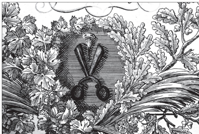
22. ábra Sepsiszentgyörgyi szabó címer az 1836. évi céhszabályzaton