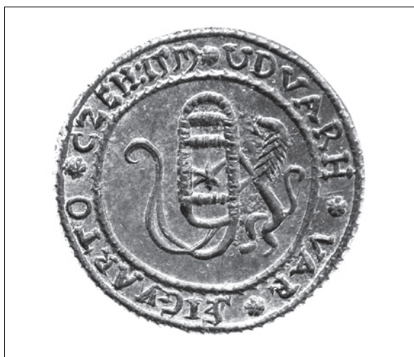
11. ábra Székelyudvarhelyi szíjgyártó céh pecsétnyomója