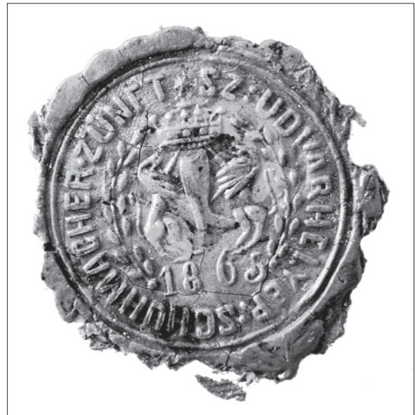
4. ábra Székelyudvarhelyi cipész pecsét lenyomata