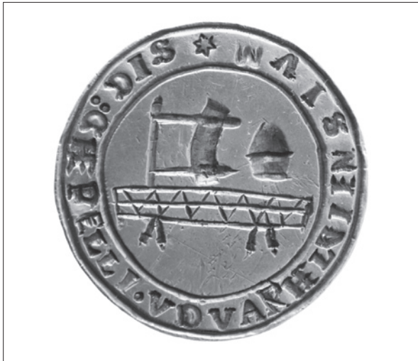
13. ábra Székelyudvarhelyi szűcs céh pecsétnyomója.