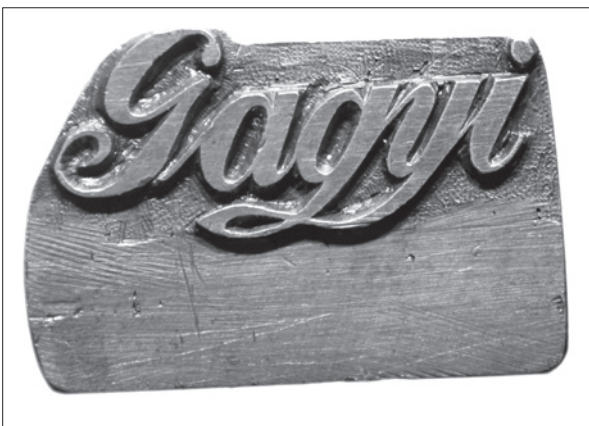
5. ábra Székelyudvarhelyi cipész mester pecsétnyomója