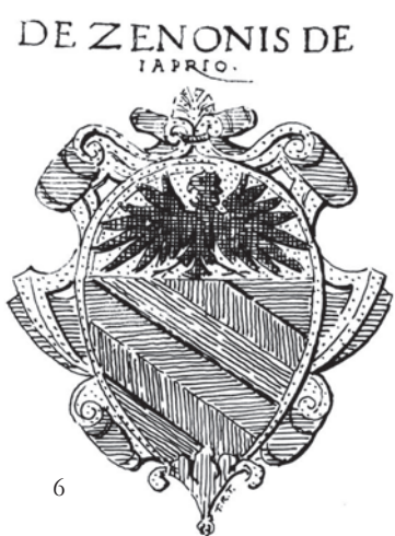
Planşa 1 I. Piatra funerară a Iosephei Zenone; 2. Castelul Castelceriolo; 3. Blazonul familiei Zenone de pe piatra funerară; 4. Blazonul familiei Zenone (reconstituirea autorului după descriere); 5. Elemente ale blazonului familiei Zenonis de Iaprio de pe piatra funerară; 6. Blazonul familiei Zenonis de Iaprio (desenul autorului)