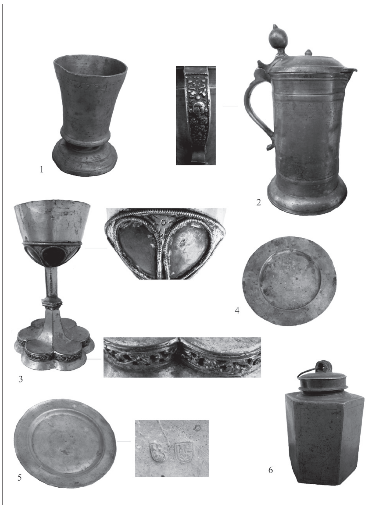
1. tábla 1. Talpas keresztelő pohár 1774-es adományozási évszámmal; 2. Jakob István által adományozott fedeles ónkanna 1772-ből; 3–4. Késő gótikus aranyozott kehely és a hozzá tartozó patena; 5. Mesterjegyes óntál; 6. Hatszögű fedeles ópalack a 18. századból