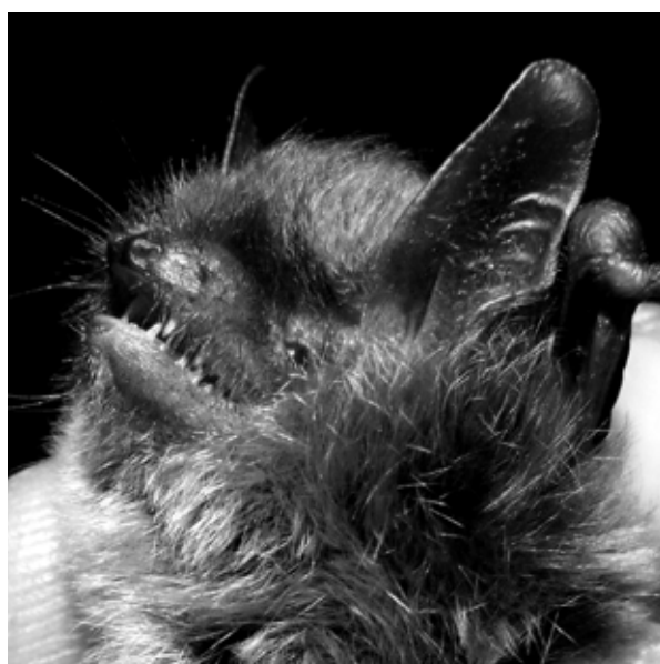
Figura 4 Forma tragusului și a nărilor la exemplarul capturat.