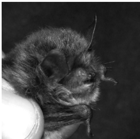
Figura 2 Myotis alcathoe – exemplar capturat în Cheile Vârghișului.