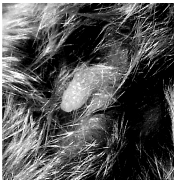
Figura 5 Forma penisului.