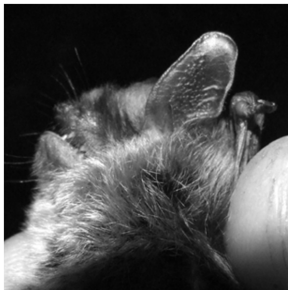
Figura 3 Myotis alcathoe – exemplar capturat în Cheile Vârghișului.