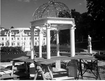
A kerti márvány pergola betonozási munkái, összeállítás, 2010