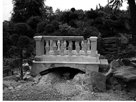
Híd építése a japánkertben, maradék kész kőelemekből hiányzó elemek faragása, 2014

tabláját. A horvátzsidányi Peruska Mária zarándokhelyen Szent Márton és Szent Kvirin kő emlékműveket készítettem, felújítottam I-II. világháborúban elesett katonák síremlékeit. Eberau kastélyában kő ajtókeretet csináltam, a bérbaltavári templomban felújítottam a homokkő ajtót és ablakkeretet, Acsádon a homokkő lovasszobrot, Magyarzsecsődön az 56-os emlékművet.