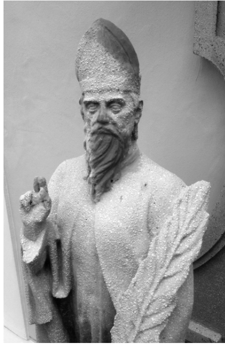
A Brenner János Kollégium Romkert felőli kapuzata, hiányos és helyreállított szobor az oromzatról (Szombathely), 2018