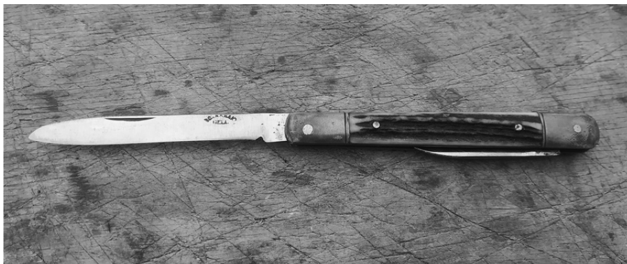
Egy csík a pakliban egy kb. 60 éves bicskán