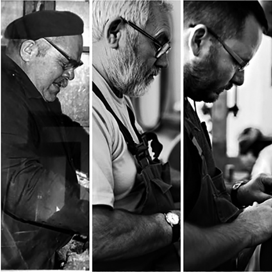
A három késes Boznánszky

pokat el tudjam sajátítani (anyagismeret, szakrajz, mechanika, mérések). Szombathelyen a 411. sz. Ipari Szakmunkásképző Iskolában (Vas Megyei Szakképzési Centrum Puskás Tivadar Szakképző Iskola és Kollégium) szereztem érettségim. Ezután egy évig a Dunaiújvárosi Főiskolára jártam, de abbahagytam és elhelyezkedtem egy helyi elektronikai termékeket gyártó cégnél. Logisztikai területen dolgoztam két-három évet. Ezután üzletkötőként tevékenykedtem az élelmiszeriparban. Majd jött a nagy ötlet: nemzetközi kamionsofőrként helyezkedtem el hazai, később osztrák cégeknél 2015-ig. Ekkorra sikerült elérnem azt az anyagi biztonságot, amivel már bele mertem vágni a nagy álmomba, hogy késes vállalkozó legyek. 2016 januárjában alapítottam meg saját műhelyemet. Mikor kezdtem, még úgy dolgoztam, hogy hétfőtől péntekig késeket készítettem, javítottam, szombaton elmentem a balatonfüredi vásárra, vásárnap meg a káptalantóti piacra. 3 ezer és 10 ezer forint közötti késeket árultam. A weboldalam és a Facebook-oldalaim már megvoltak és egyre több megrendelés érkezett, így a vásárookra járás később elmaradt. (Már nem volt annyi készletem, amit vásárra