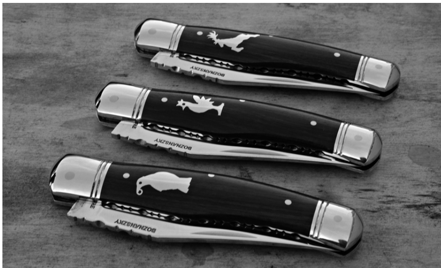
Dupla csíkok a pakliban