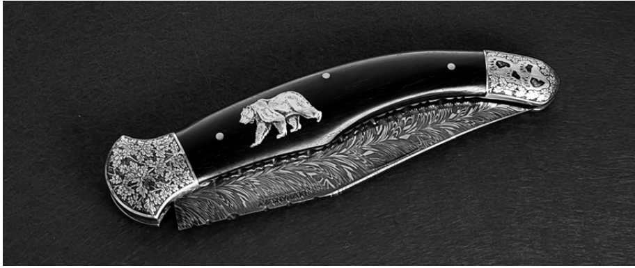
Medve berakásos bicska