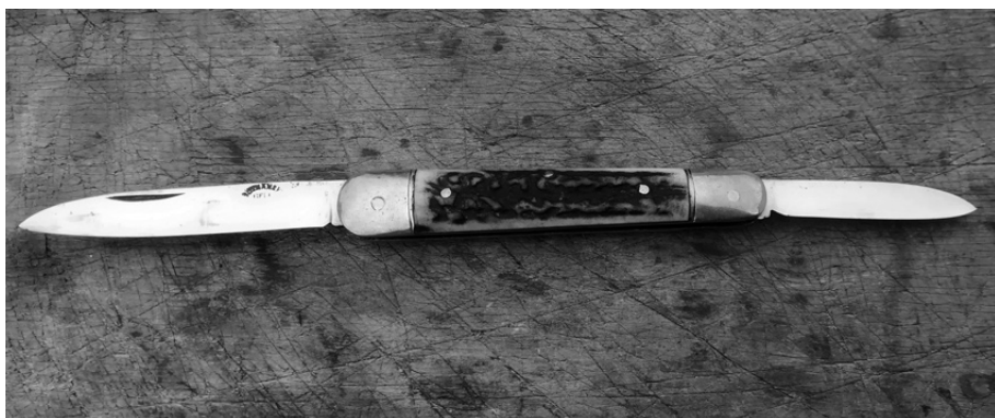
1960-ban készült szalonnázó bicska