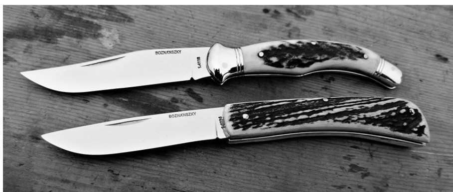
Fejsgörbe és melós bicska

fektettek annyi munkát az összerakásába, nyilván olcsóbb is volt. A náder bicska Náder Ignác szegedi késesről kapta a nevét. Minden mester igyekszik a bicskakészítésbe egy kicsit belevinni a saját egyéniségét. A szakavatott szem ezeket az egyedi jegyeket azonnal észreveszi. Mi az édesapámmal egyforma kést készítünk, de a kidolgozottság sajátosságaival meg tudjuk különböztetni a munkadarabokat. Viszont teljesen egyedi sem lehet, túl sok eltérést nem lehet belevinni a kidolgozásba, mert akkor már az nem egy adott bicskaforma.