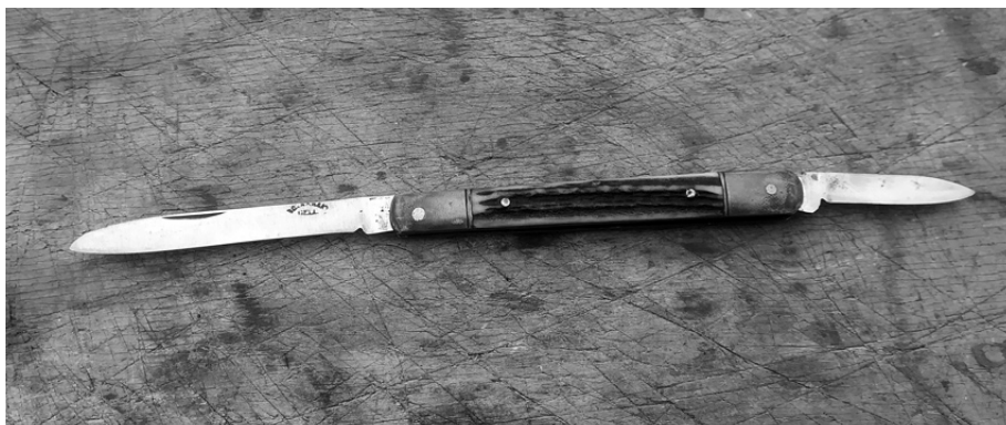
1959-ben készült „úri bicska”

Amikor elkezdtem kutatni a család történetét, akkor kezdtem el felvásárolni a nagypapa késeit. Ha apuhoz visznek régi bicskát köszörülni, amit a nagypapa készített, rögtön ajánlatot teszünk. Eddig 30-40 darab van belőlük. A műhelyemben őrzöm őket.