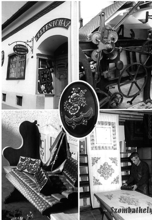
Az egyedi megrendelésre készített Zsolnay porcelánlap

Körülbelül húsz évvel ezelőtt döntöttünk úgy, hogy kicsit felújítjuk a házat. Akkor történt meg az utcai homlokzat átalakítása. A Zsolnay Porcelánmanufaktúrától rendeltük meg a feliratos és kékfestőmintás díszítő elemeket, melyek az utca felől látszanak. Új üzlethelyiséget alakítottunk ki. Csoportos műhelylátogatásokra nem volt kimondottan nagy igény, de akik jöttek, azokat szívesen láttuk.