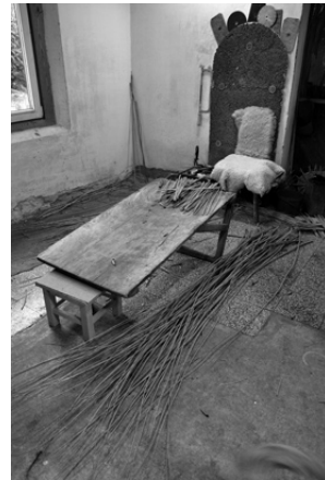
A mester munkaállomása

A kosárfonás nem olyan mesterség, amiből kulturális rendezvények, személyes találko- zások hiányában meg lehet élni. Voltak nehéz időszakok?