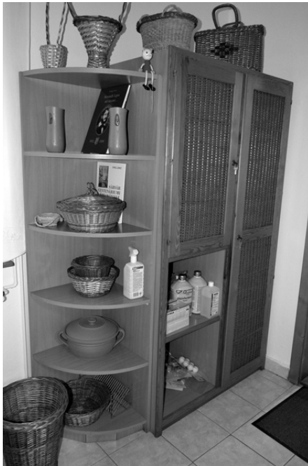
Egyedi bútort és néhány korábban készített kosár

Szóval így ismerik meg a termékeinket. Üzletet kötöttünk velük. A kiválasztott árukat előre egyeztetett mennyiségben, egy évben négyszer kellett szállítanom. Lett egy kis teherautónk is közben és így szépen, kiszámíthatóan tudtunk működni egészen a cég megszűnéséig, 2005-ig.