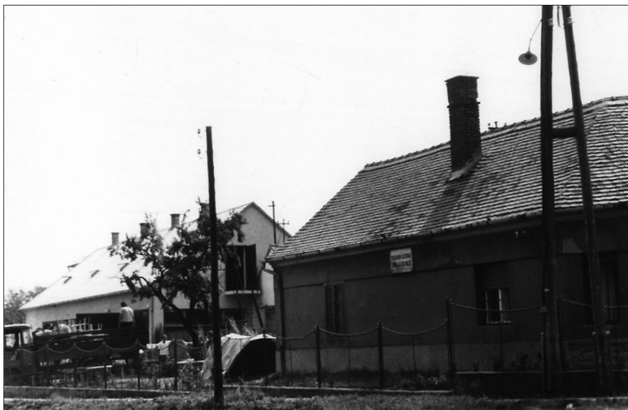
Kosárfonó Szövetkezet. 1978.