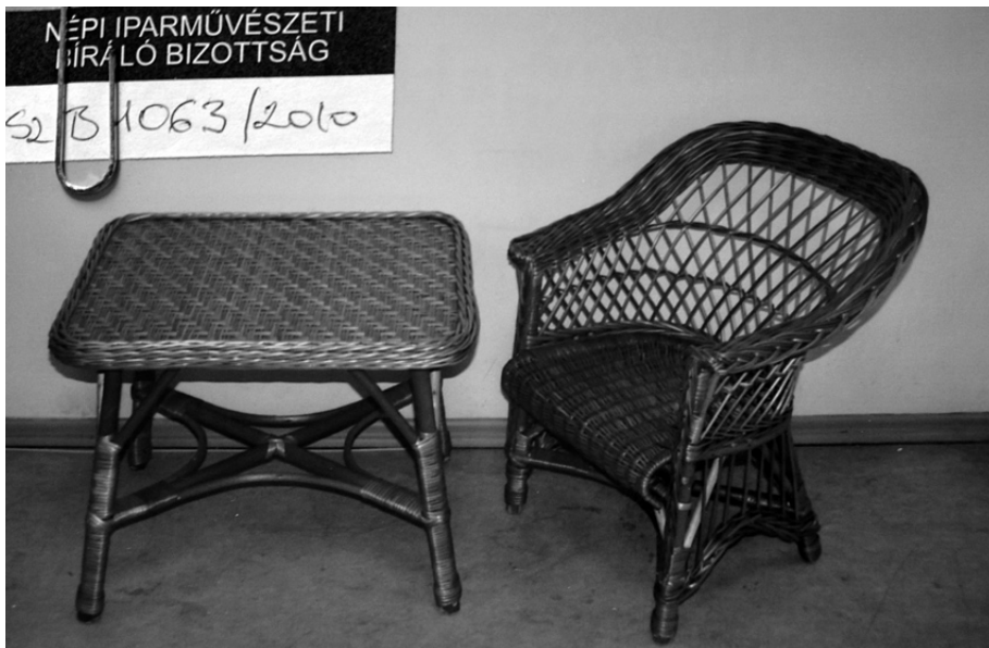
Gránátalma-díjas gyermekszobabútor. A XVI. Országos Népművészeti Kiállításon pedig Arany Oklevelet kapott.

A hagyomány, a tehetség és a mesterségbeli tudás hármasa érett össze munkásságában. Rendkívüli szerénységet, a szakma és hagyomány iránti alázatosságot feltételez az, hogy a zsűriztetést nem rögtön az elején kezdte. Aztán a gyümölcs beérett, kosáryi elismerés gyűlt össze.