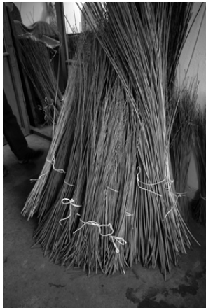
Fonásra előkészített vesszők

Van egy vesszőhasító gépünk. Aztán a műhelyben található egy áztató edény, ami- ben a vesszőt készítjük elő. Egy kényelmes szék, mellette a szerszám tároló és a fonó- pad, ami egyik irányban döntött azért, hogy ne vízszintesen legyen a mester előtt a kosár, hanem ferdén, hogy jól rálásson az egész fonásra.