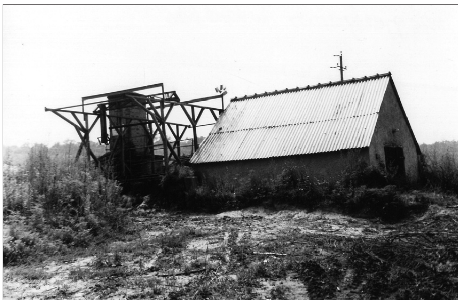
Régi vessző-kifőző a község határában. 1978.