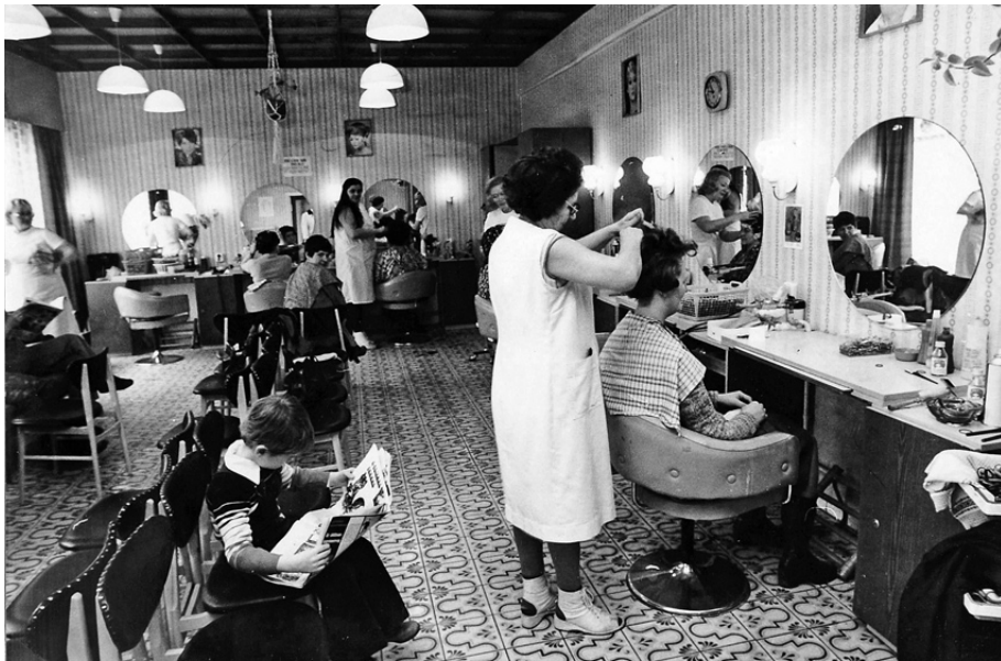
Az Ében Gyula téri fodrászszalon a felújítás után (Szombathely), 1980, február

Régen olajos padló volt a fodrászatokban, a tapéta itt-ott lógott a falon. Más igény-szintje volt az embereknek. Az üzlet kinézetének, berendezésének egyébként szakmailag nincs jelentősége, inkább üzleti előnyökkel jár. Jó értelemben némi rangot is jelent. A másik, amivel meghatározom a helyemet a konkurens cégek között, az az ár. Elég sok tanulóm volt és sok segéddel is dolgoztam. Mindig azt mondtam és mai napig tartom, hogy azért kell ismerni a másik szakember munkáját, hogy a magamét besorolhassam. Így tudom pozicionálni magamat.