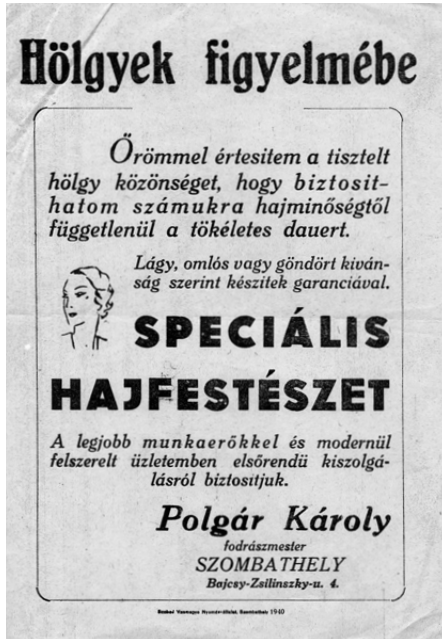
Aprónyomtatvány a Berzsényi Dániel Könyvtár helyismereti gyűjteményéből

Mivel a maszek szó abban az időben kvázi szitokszó volt, két év múlva be kellett lépnie a szövetkezetbe. Rendkívül jól dolgozott, ő csinált először hideg dauert.