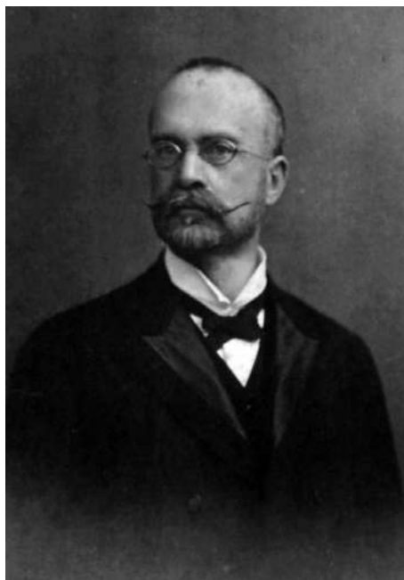
Bodányi Ödön MNL VaML Fotógyűjtemény