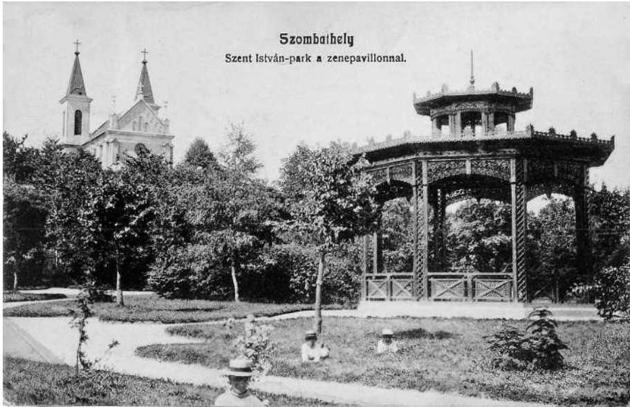
Szombathely Szent István-park a zenepavillonnal.