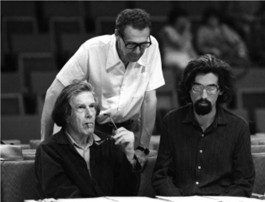
Cage – Kurtag – Wilhelm