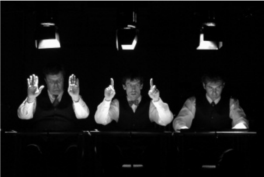
Amadinda – Asztali zene