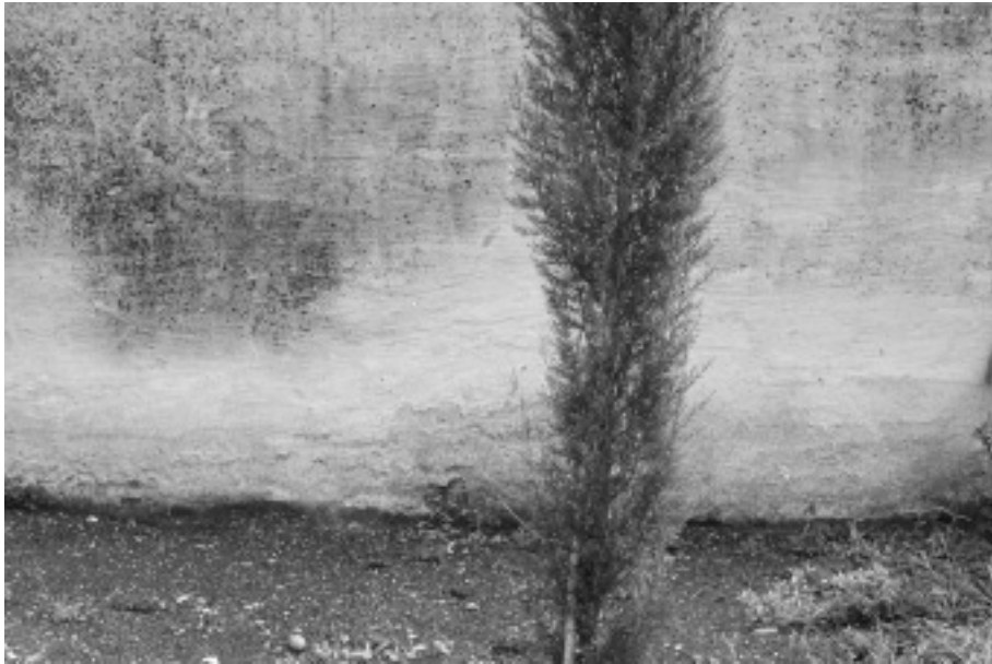
Tél – idő