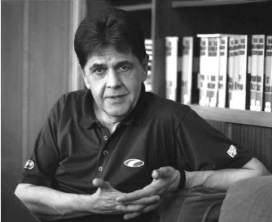
Lőrinczy Huba (1940–2007)