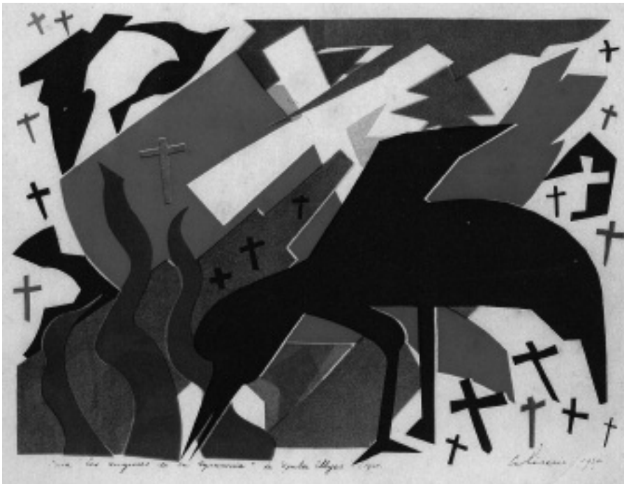
Carlos W. Aliseris: Illusztráció Illyés Gyula: Egy mondat a zsarnokságról verséhez, 1956