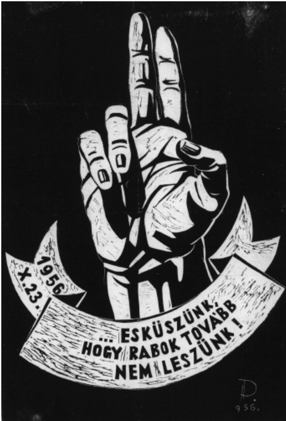
Pleidell János: Esküszünk, hogy rabok tovább nem leszünk! (plakát)