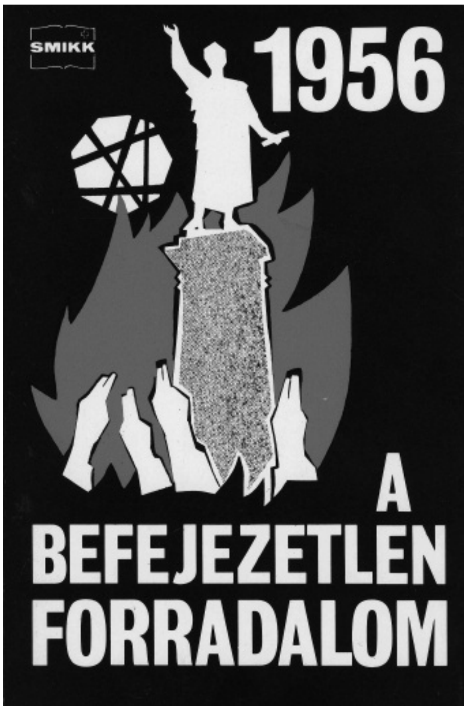
Török Pál: Könyvcímlap, Zürich, 1982