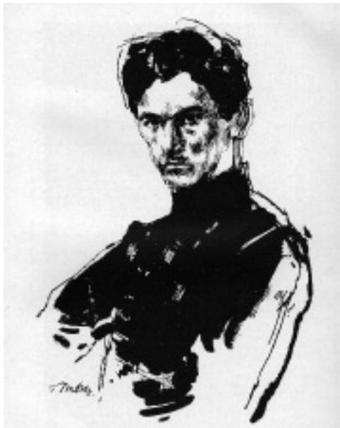
Ambrus Győző: Petőfi

Reám szakadt a tél, mint háztetőre, s amíg magam ki nem jövök belőle kijön belőle pár hideg szonett.