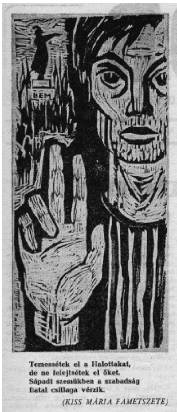
Kiss Mária: Temessétek el a Halottakat (illusztráció)