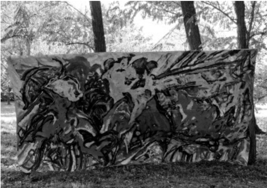
Florália Savaria Légió