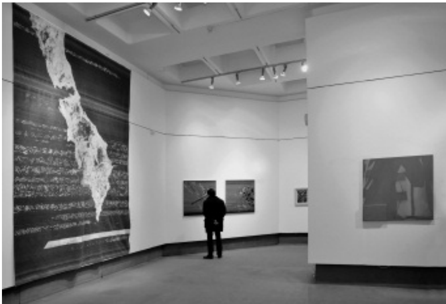
Polgár Csaba kiállítása a Szombathelyi Képtárban