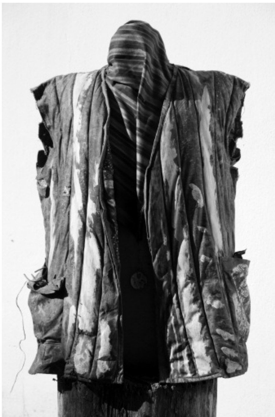
Változat a vattakabátra