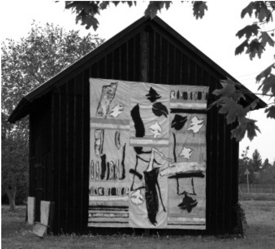
Spindlik és Moletták