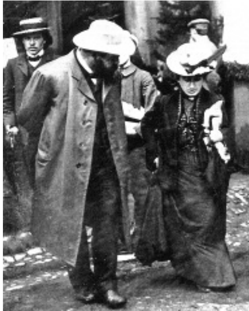
Parvus és Rosa Luxemburg

Parvus azonban tovább tevékenykedik a következő év őszéig, amikor három évre száműzik a fagyos Turuhanszkij vidékre. Sokat elárul a cári önkényuralom szigoráról, hogy a politikai foglyok lépten-nyomon megszöknek a száműzetésből, könnyűszerrel külföldre jutnak, és szerte Európában terjesztik felforgató tanaikat. Pontosan ezt teszi Parvus is: már útközben kereket old, hamarabb visszaér Pétervárra, mint a fegyenceket kísérő őrök. Aztán elutazik választott hazájába, Németországba. 1908-ig itt él,