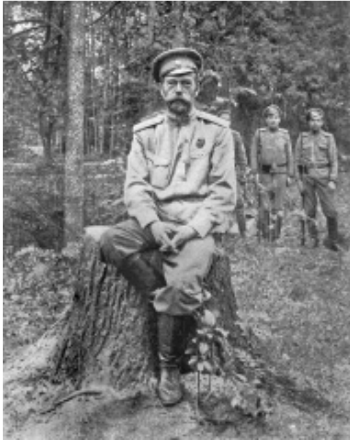
II. Miklós a tobolszki száműzetésben