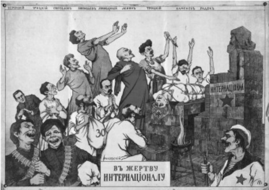
Áldozat az Internacionálisizmusnak. A Marx-oltár előtti rítus végrehajtói (balról jobbra)