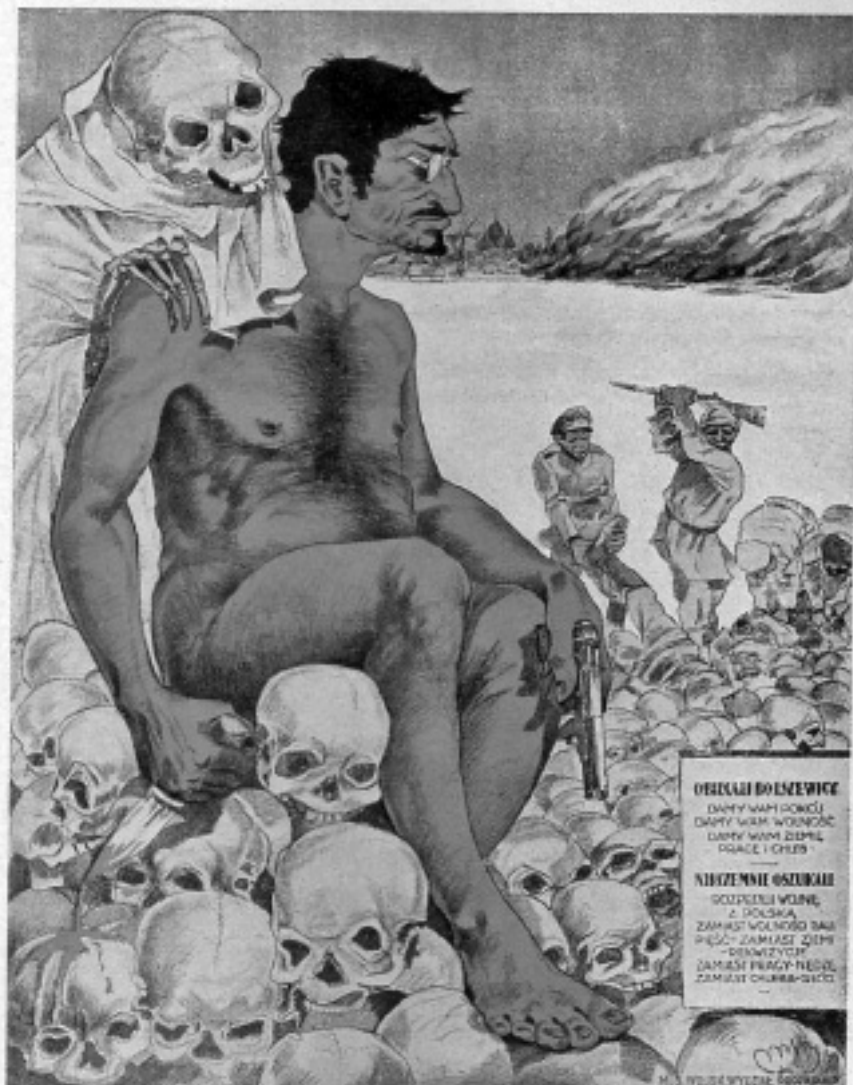
Gúnyrajz Trockijról egy lengyel bolsevikellenes plakáton