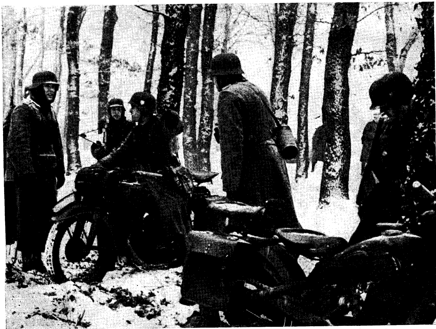
A motorkerékpáros hírvivő parancsot közvetít.

Nagyobb viszonyokban így támad a gépkocsizó gyalogság — önállóan. Támadásának iránya rendszerint — esetleg hosszabb kerülővel — az ellenség oldala és háta ellen irányul.