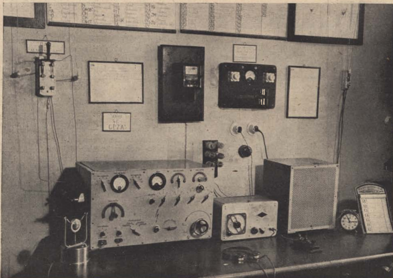
Az egyik híradó órs szolgálati helyiségének üzemi asztala. Baloldalon egy 100 wattos adókészülék, közepén a vevő, jobbra az adó anódpótló része. Elöl a mikrofon, fejhallgató és morzebillentyű.

8-hoz: Kétségtelenül a legsikerültebb megoldás az volna, ha a híradó csendőr Hazánk összes nemzetiségének nyelvét bírná. Ilyen szerencsés helyzetbe azonban aligha fog kerülni a híradó alakulat. Arra azonban feltétlenül szükség van, hogy a híradó csendőr ezeket a nyelveket felismerje és legalább egyet közülük elsajátítson. Ezt is — mint a gyorsírást — önszorgalomból, szótárak segítségével el lehet érni. Így az éterismeretét is bővíti és könnyebbé teszi.