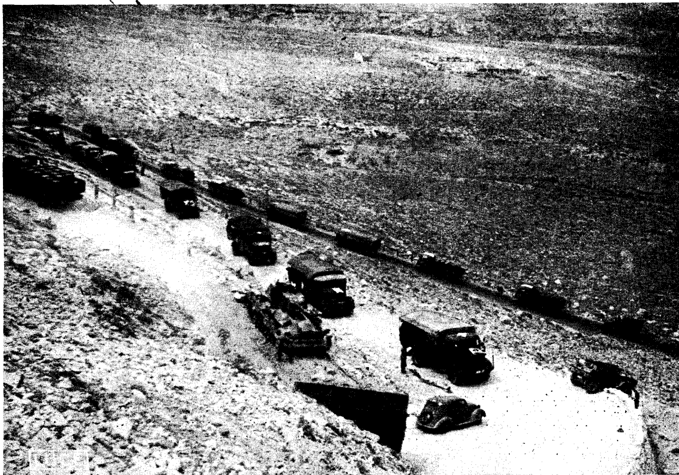
Hosszú szállítóoszlopok biztosítják az utánpótlást.

A páncélosok támadását rendszerint második, vagy harmadik lépcsőben követik és a még ellenálló ellenséges fészkeket küzdik le. Az elfoglalt területen védelemre rendezkednek be, illetve felkészülnek további előretörésre.