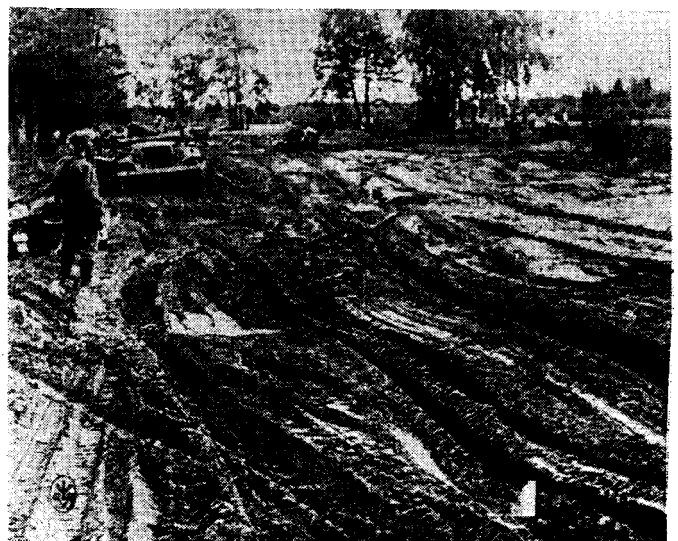
A motor nagy ellensége: a sár.

Ezek előrebocsátása után láthatjuk, hogy nagy viszonyokban szükség van nagy létszámú, kiváló erkölcsi erejű és kiképzésű gyalogságra, mely részben önállóan támad, részben a páncélos csapatok által áttört és lerohant területet veszi véglegesen birtokába. Olyan állam nincs a világon, mely megengedhetné magának azt a fényűzést, hogy minden emberét páncél mögé, harckocsiba bujtassa! Erre Dárius kincse sem volna elég — pénzben, olajban, meg benzinben sem lehetne ezt bírni! Kell tehát gyors gépesített hadseregrész, de kell gyalogság is! Természetesen minden állam arra törekszik, hogy minél több gépesített alakulata legyen, mert „villámháború“ csak ezzel képzelhető el.