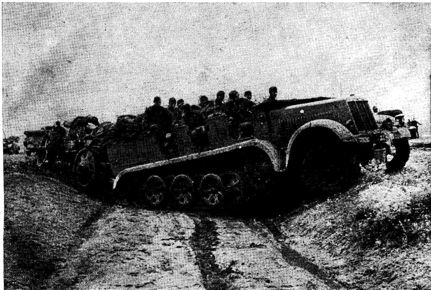
Gépvontatású löveg útban a tüzelőállás felé.