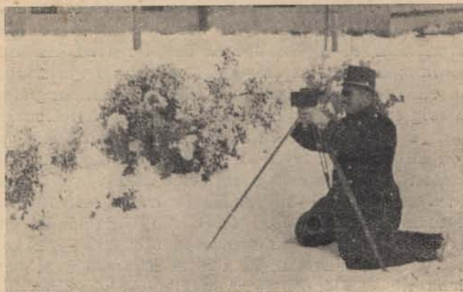
Télen is szórakozás...

Célravezető eljárásként marad tehát a tulajdonjog alapos igazoltatása, amire az útvonal-razzia különösen jó alkalmat ad.