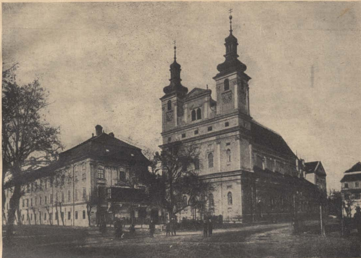
Amit vissza kell szereznünk: Nagyszombat.

vagy pedig lágy tárgyakkal (dunya, vánkos, pokróc, stb.) való letakarása, hogy ilyképpen fulladás kéltekezzen. Ilyen lehet az újszülött száj és orr befogása vagy más látható nyomnélküli megfojtása annak a látszatnak a keltésével, hogy szülés közben fult meg akár a kedvezőtlen fekvés (farfekvés), akár fel nem repedt burokban való megszületés, akár pedig a köldökszinór nyakra tekeredése folytán. A természetes halál látszatát keltő erőművi behatás, a vérzékeny tüdejű embernek e tulajdonságát ismerve, mellbevágása s ezáltal tüdővérzés megindítása, a szervi szívbajosnak szívenütése. E cselekmények külsérelmi nyomot rendszerint nem hagynak maguk után, a tettes által szándékolt eredmény azonban így is bekövetkezik.