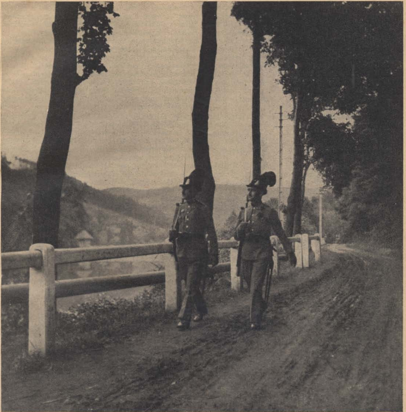
Amikor a fák még lombosak voltak...