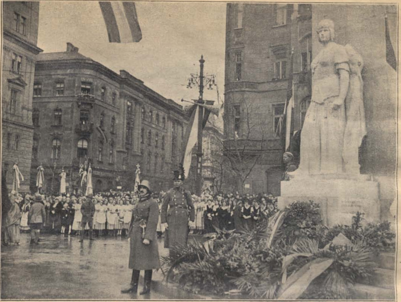
Vitéz Szinay Béla tábornok úr, a m. kir. csendőrség felügyelője a csendőrség nevében megkoszorúzta a vértanuk emlékművét.

vasútüyeleti járőr arra a feltevésre jutott, hogy a tettes valamelyik elkésett korcsmázó lehet, aki eközben vetődött be a vasúti vendéglőbe és az alkalmat felhasználva, elkövette a lopást. Ezért azonnal sorrajárta a község korcsmáit, ahol még addig nem takarítottak. Az egyik korcsmában az asztalon levő hamutartóban több, a helyszínen találhoz hasonló cigarettavéget talált. A korcsmáros meg tudta mondani, hogy ki ült annál az asztalnál és így a tettes személyét a járőr rövid idő alatt ki tudta deríteni.