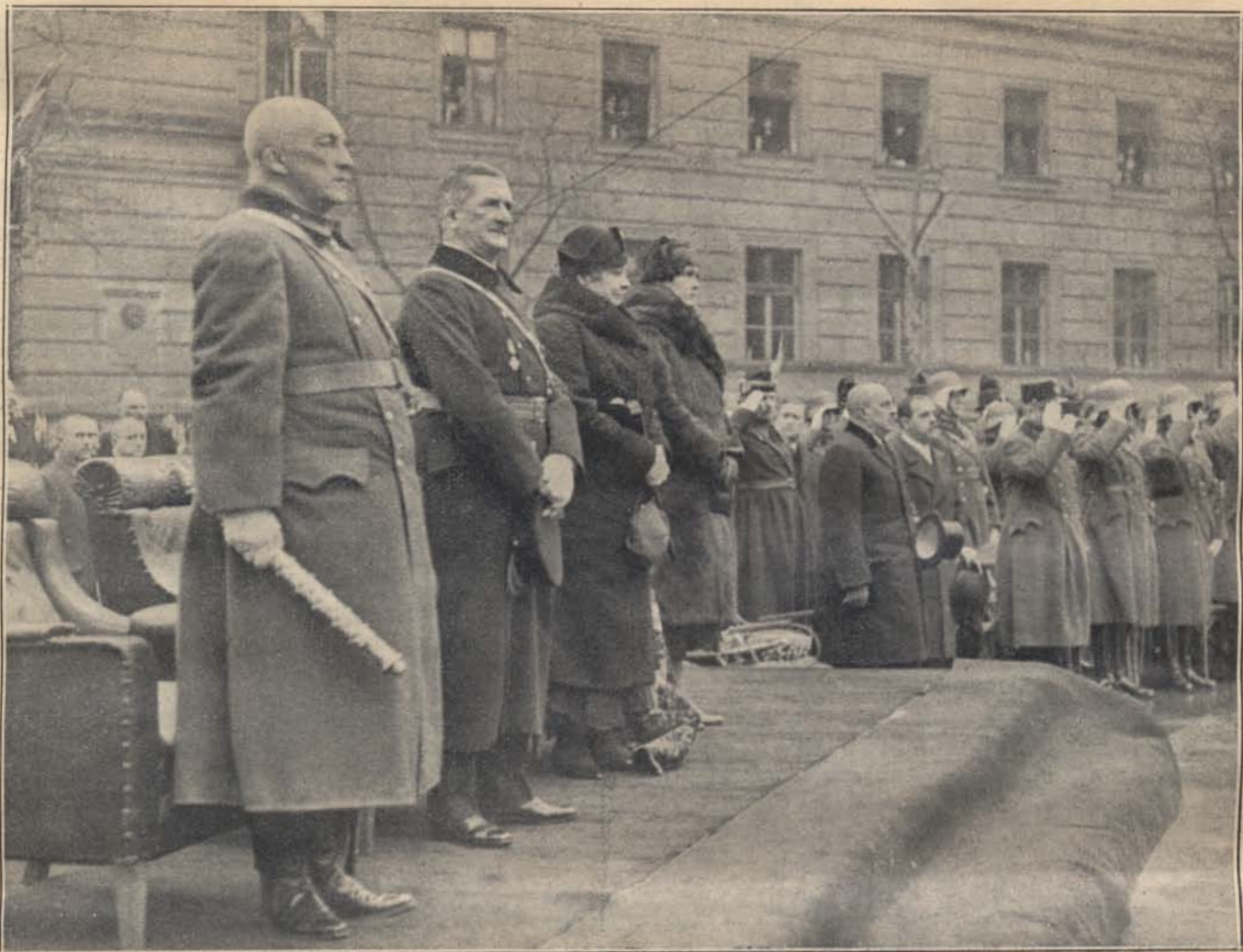
A kommunizmus alatt hősi halált halt vértanuk emlékművét március 18-án leplezték le Budapesten. A leleplezési ünnepségen Kormányzó Úr Ő Főméltósága, József kir. herceg Ő Fensége és Augusztia kir. hercegasszony is megjelentek.

mészteres egyszerű bűnpártoló is lehet.) Idetartozik a tettes dicsekvése, henegeése (különösen nőekkel szemben, vagy ittás állapotban), feltűnő érdeklődés, kérdezősködés az elkövetett bűncselekmény részletei és a nyomozás folyása iránt. Egy gyilkosság tettesére úgy jöttek rá, hogy csavargót fogtak el, kinek zsebei megmotozásakor tömve voltak újságokból kivágott szelvényekkel, melyek mind a kérdéses gyilkossággal foglalkozó hírlaptudósításokat tartalmazták.