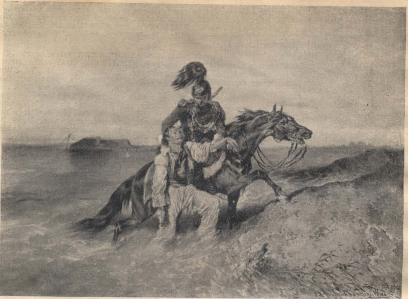
Osztrák csendőr kiment az árvízből egy magyart. Ilyen képek terjesztésével igyekezett annak idején az osztrák csendőrség népszerűséget szerezni a magyar lakosság körében.

támogatást, ha van kivel üzennie. Ha tehát történt volna Vecsésen hiba (aminthogy ott sem történt), azért még nem kell a csendőrnek a lakosság támogatásától ennyire félnie.