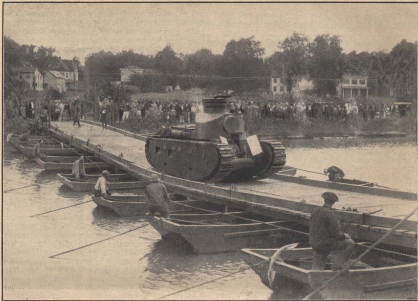
Ponton-hídon átkelő amerikai tank.

424. §-a, mely életfogytiglani fegyházzal bünteti a rablás vagy rombolás céljából csoportosan elkövetett gyújtogatást. Elkövetője lehet szervezett és szervezetlen tömeg.