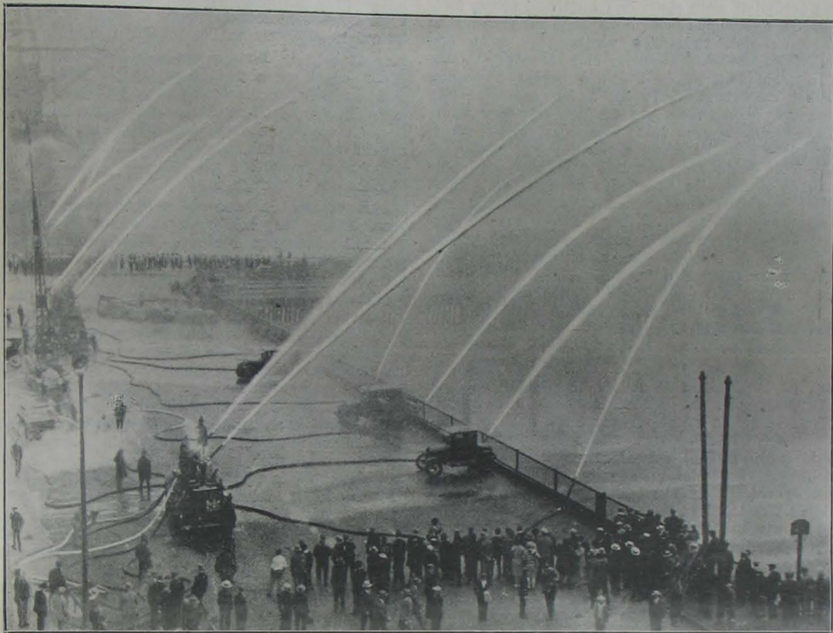
Amerikai tűzoltóság. A bosztoni tűzoltóság a magas víznyomás módszere alapján bemutat egy oltási gyakorlatot tanulmányuton lévő idegen állambeli tűzoltóknak. Csak ezen a módon lehet az amerikai felhőkarcolókat a vízsugarakkal elérni.

katonai nevelés, fegyelemkezelés a csendőrségi belső rendtartás létalapja s emellett magával a csendőrségi közbiztonsági szolgálattal is összhangban áll, a rendőrségnél erre fegyelmezési szempontból szükség nincs, de a rendőrségi szolgálat érdekeinek egyenesen hátrányára is lehetne. Természetesen ebből nem lehet arra következtetni, hogy a katonás magatartás, engedelmesség, fellépés, megjelenés stb. elsajátítását a rendőrlegénység részére fölöslegesnek tartom, én csak azt akarom leszögezni, hogy a szó katonai értelmében vett fegyelemkezelésre városi közbiztonsági szolgálat keretében szükség nincs, sőt az nem is kívánatos.