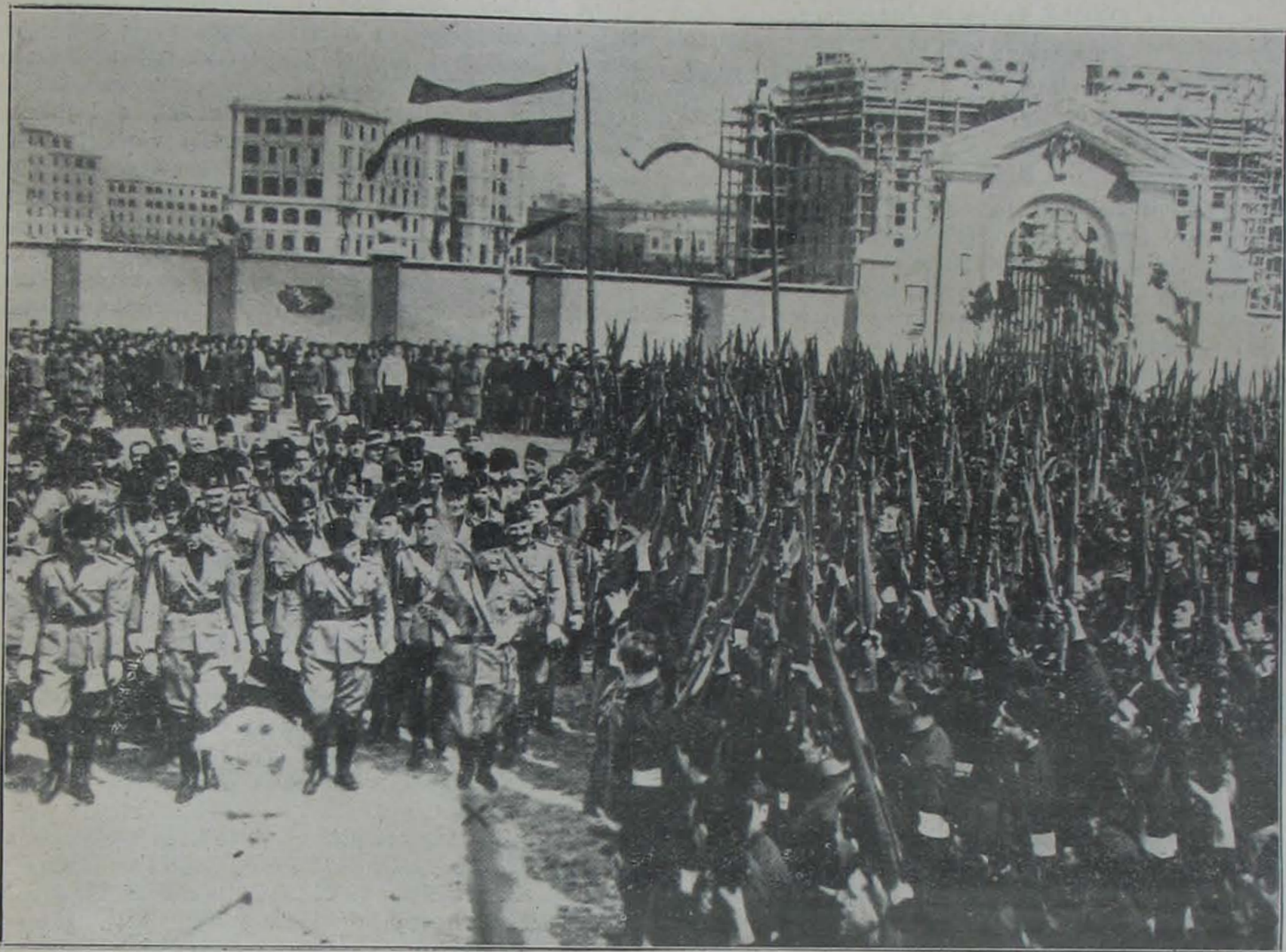
Az utolsó pokolgépes merénylet még fokozottabb mértékben váltotta ki az olaszok határtalan szeretetét a Duce iránt. Képünk azt a jelenetet ábrázolja, amikor Mussolini miniszterei kíséretében lelkes feketeingesei között megjelenik, kik őt magasra tartott fegyverekkel éljenzik.

de el is maradhatnak, ha éppen nincsenek fölösleges géppuskák és légvédelmi ágyúk kéznél.