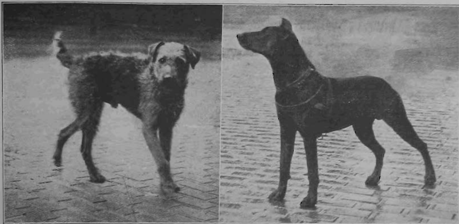
Képek a múlt számunkban ismertetett rendőr-kutyaversenyéről.

kedése folytán a védelemnek a határozathozásra nézve lényeges irányban törvényellenes korlátozását jelöli meg semmisségi ok gyanánt. Ez a rendelkezés összefüggésben van azzal, hogy az elnök és a tárgyalásvezető hivatalos teendői ketté vannak választva és célja az, hogy a vádlottat és védőjét különös oltalomban részesítse az elnök esetleges túlkapásával szemben, amit végre is, tekintettel arra a katonai főlé- és alárendeltségi viszonyra, amelyben az említett egyének egymással szemben állhatnak, nem lehet teljességgel kizártnak tekinteni.