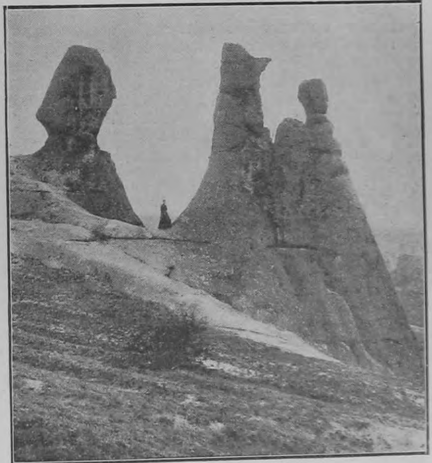
Szikla-esodák: Siroki kövek.

Mert a csendőröknek csak csekély töredéke lett a hadsereg kötelékében hivatásszerűen alkalmazva, teljes értékében kihasználva. A harcra alakulatokhoz beosztottak, épp úgy szerepeltek, mint a tartalékból bevonulók s így csak a puskaállományt szaporították.